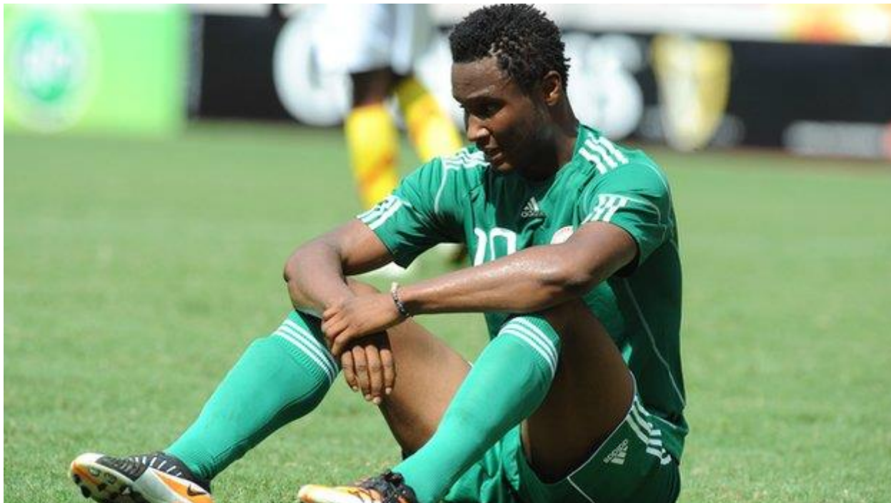
Джон Оби Микел

После матча сборной Зимбабве в Ханое я вернулся в Сингапур и спокойно жил в родительском доме. Денег хватало, поэтому я мог безмятежно ждать следующей возможности. Я не обращал внимания на местные матчи — полицейский ведь предупредил меня. Я понял, что проще и безопаснее организовывать договорняки за границей.