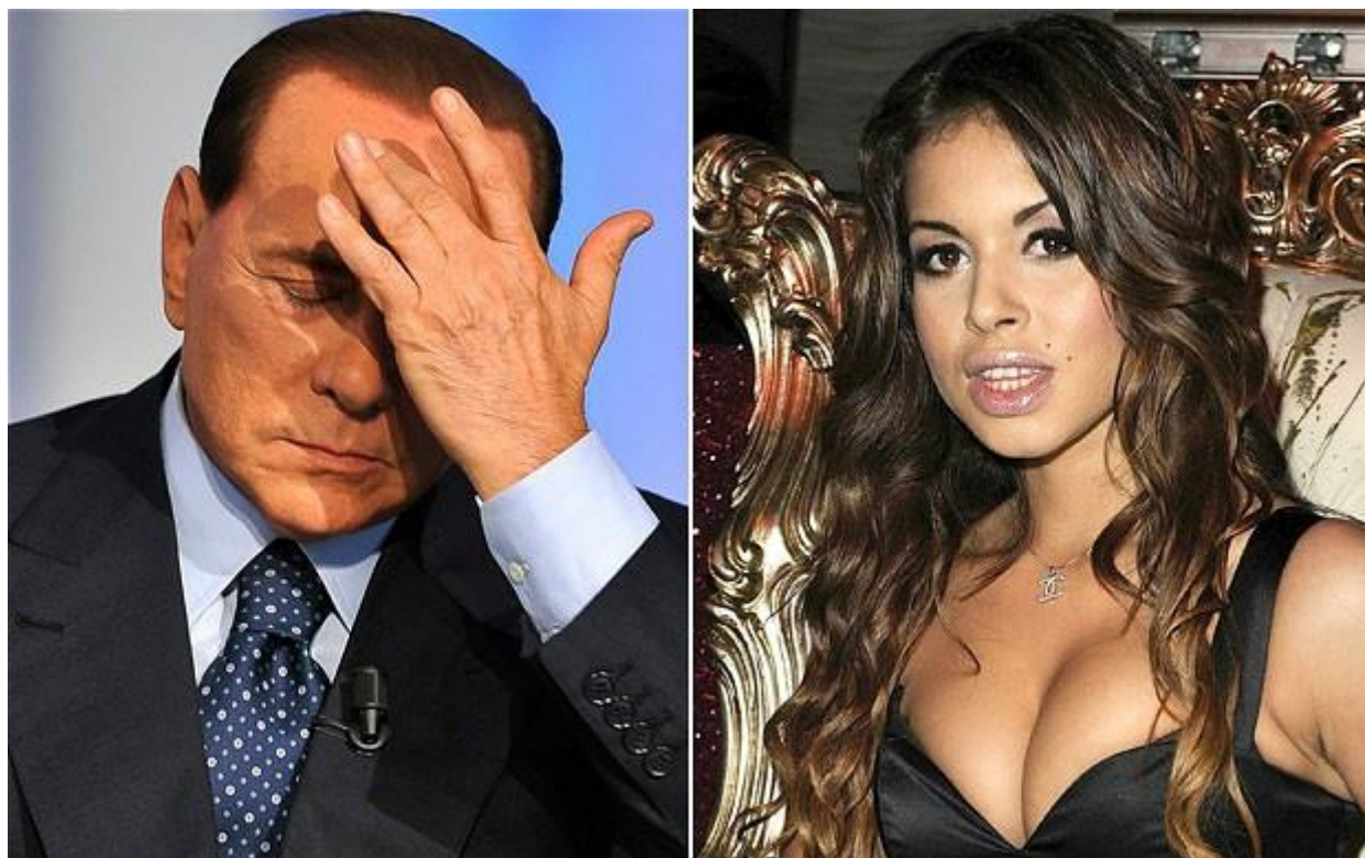
Сильвио Берлускони и Карима эль-Маруг