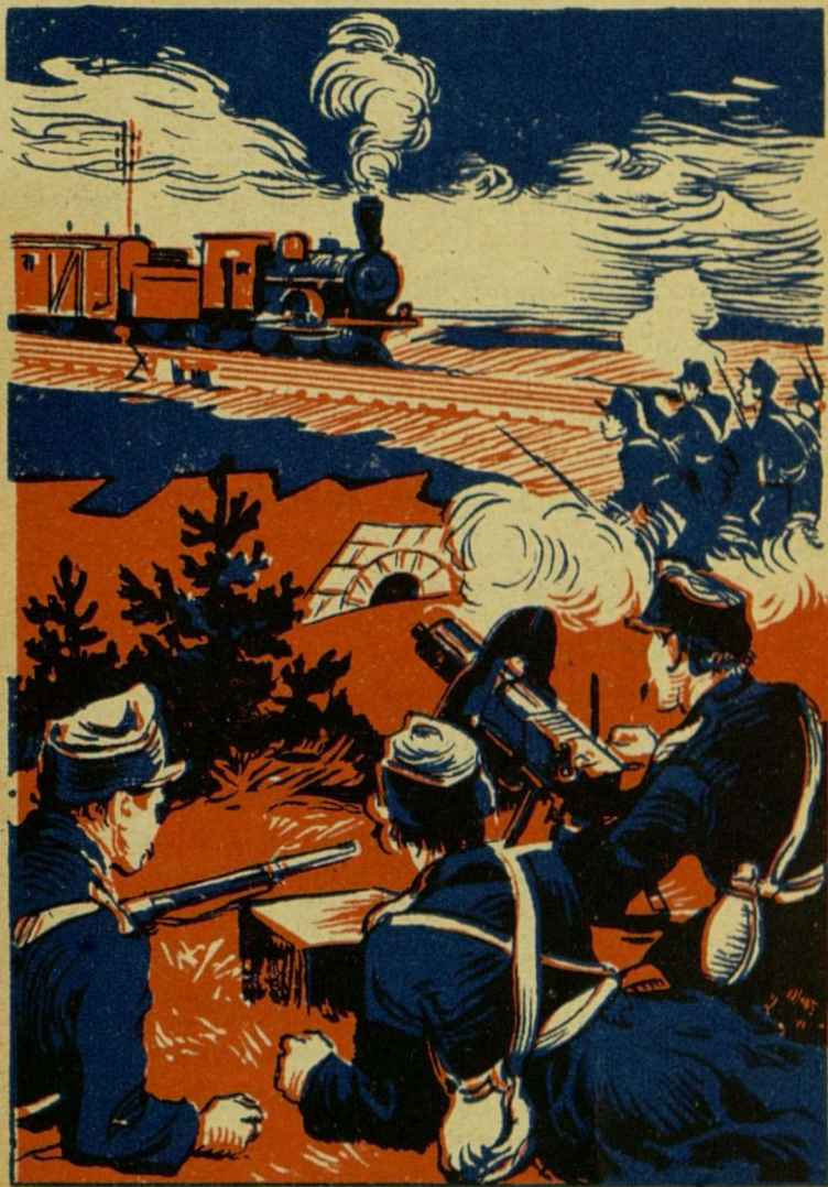
Чехи обстреливают поезд с красноармейцами.