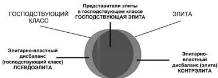
Рис. 1. Элитарно-властный дисбаланс

Так вот, в любом достаточно большом обществе существует элитарно-властный дисбаланс. Элитарно-властный дисбаланс – показатель включенности элиты в господствующий класс (рис. 1). Часть элиты, которая входит в состав господствующего класса, можно назвать господствующей элитой. Часть элиты, которая не входит в господствующий класс и нередко находится в оппозиции к господствующей элите, можно назвать контрэлитой . Часть господствующего класса, не являющегося элитой, но в то же время находящегося у власти, можно назвать псевдоэлитой .