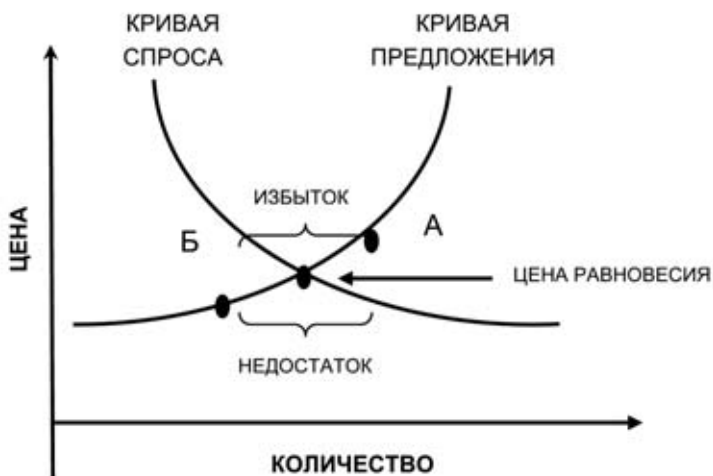
Рис. 3. Цена равновесия, определяемая спросом и предложением

В западных учебниках по экономике пишется, что рынок стремится к цене равновесия. Это не совсем верно. Продавцы всегда устанавливают цену выше цены равновесия. В идеальном случае эта цена превышает цену равновесия незначительно. Только такая цена позволяет продавцу присутствовать на рынке и заниматься своим делом – торговать. Установив равновесную цену, он лишится работы, т. к. продаст весь товар. Рынок подразумевает продавца и продаваемый товар, значит, цена должна быть выше равновесной. Вот почему на рынке всегда есть избыток товара, а основное ценовое правило функционирующего рынка гласит: цена блага всегда должна быть выше равновесной.