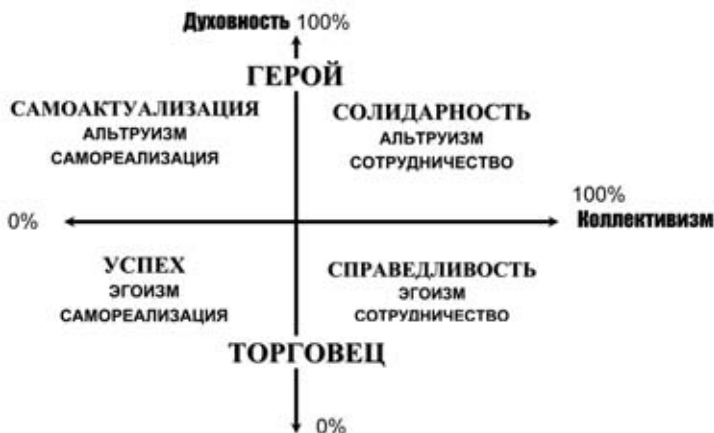
Рис 6. Базовые типы менталитета

Юнга, который отмечал, что описанные им типы характеров в чистом виде не встречаются в повседневной жизни: «Чистые» типы мировоззрения практически не встречаются, во всяком случае, они редки, и в реальной жизни образуют сложные и противоречивые сочетания» .