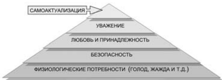
Рис.4. Схема иерархии потребностей Маслоу

Все виды потребностей являются врожденными, человек стремится удовлетворить прежде всего низшие потребности, для того чтобы перейти на следующий, более высокий уровень, где поведение человека становится мотивировано высшими потребностями.