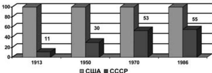
Рис. 2. Уровень производительности труда в промышленности СССР и США

Этот разрыв неуклонно сокращался, несмотря на худшие биоклиматические условия и нашествия гитлеровских полчищ (рис. 2) 2 .