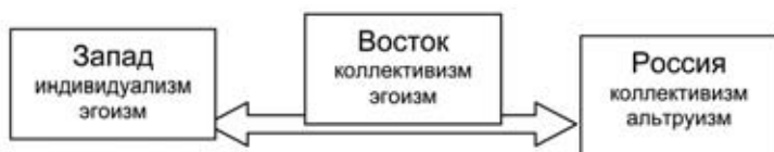
Рис. 7. Запад-Восток-Россия

Восток занимает промежуточное положение между Западом и Россией. Безусловно, Восток – коллективистская цивилизация и, в то же время, альтруизма там меньше, чем даже на Западе. Поэтому на Востоке так любят красоваться в коллективе с автоматами перед камерами, а потом при реальном сражении, когда уже необходим альтруизм, все разбегаются (рис. 7).