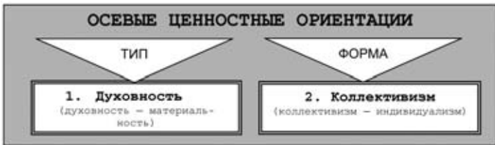
Рис 5. Осевые ценностные ориентации

Существует один осевой тип ценностных ориентаций, являющийся системообразующим для мировоззрения человека – духовность , и одна осевая форма ценностных ориентаций – коллективизм (рис. 5).