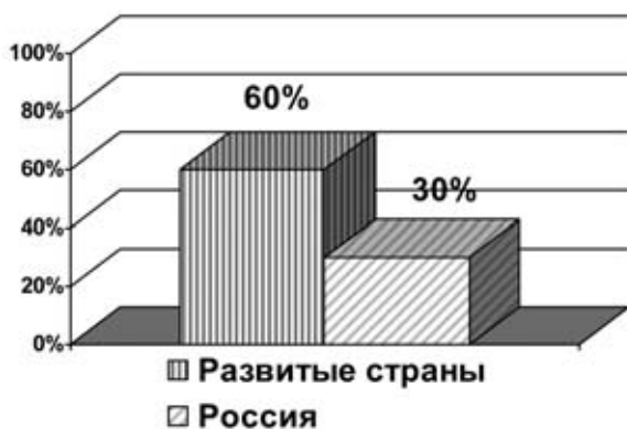
Рис. 8. Доля заработной платы и социального страхования в ВВП

В России доля заработной платы составляет всего 23% ВВП, а размеры взносов на социальное страхование (пенсионное, медицинское и социальное страхования) – всего 7,5% ВВП. В итоге совокупные расходы в России на два базовых института доходов населения (зарботная плата и социальное страхование) составляют чуть больше 30% ВВП, что в 1,8-2 раза меньше, чем в развитых странах (рис. 8).