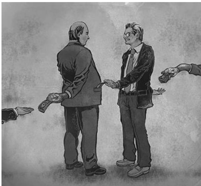
Рис. 1. В2В: некоторые предпочитают широкое определение коррупции

партий, особенно тех, которые не представлены в органах законодательной власти, занимать государственные посты, а если нет, могут ли они быть обвиненными в коррупции в узком смысле?