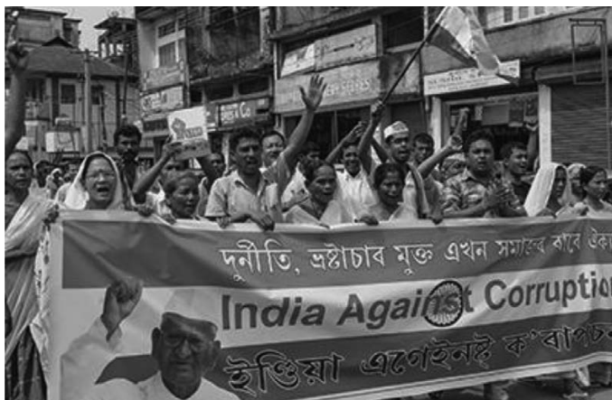
Рис. 7. Массовые протесты против коррупции заметно усилились во многих странах мира

годы, побуждая граждан в Аргентине, Бразилии, Болгарии, Индии, Таиланде, Турции, Украине, США и многих других странах принять участие в массовых протестах против коррупции (рис. 7).