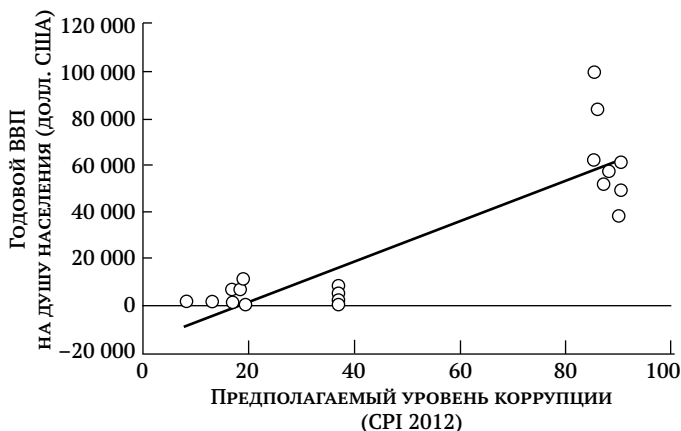
Рис. 5. График сопоставления ИВК и ВВП на душу населения

исследовании, включающем 129 стран, они показали, что более высокое неравенство в доходах обычно соответствует и более высокому уровню коррупции.