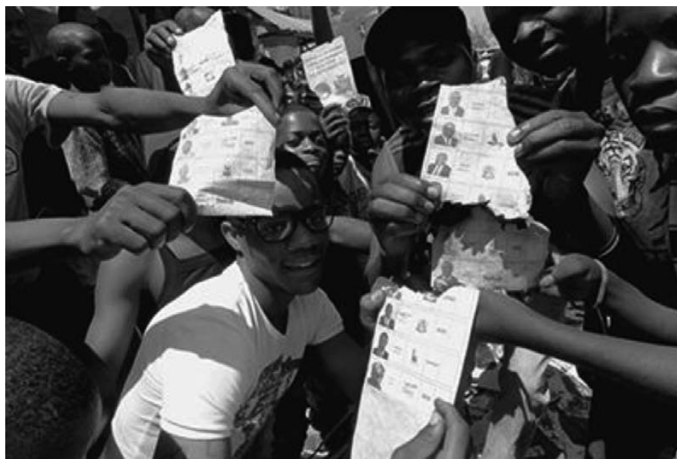
Рис. 3. Подтасовка выборов до сих пор очень распространена во многих странах

Коррупция может подорвать конкуренцию на выборах, увеличивая неравенство между политическими партиями и снижая их конкурентоспособность. Электоральные фальсификации и нарушения могут принимать разнообразные формы. Две наиболее известные — подтасовка результатов голосования и покупка голосов избирателей (см. рис. 3). Так, одним из давно известных примеров покупки голосов являются «расточительные выборы» в 1768 году в Нортхэмптоне (Великобритания). Существует бесчисленное множество предполагаемых и доказанных случаев применения обеих этих