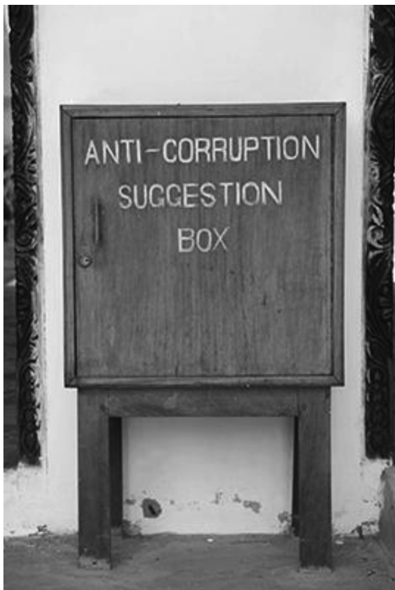
Рис. 6. Почтовый ящик для антикоррупционных предложений в Кении: борьба с коррупцией может обходиться без высоких технологий

циально очень мощным оружием против коррупции. Не вызывает сомнений, что твиттинг может быстро организовать тысячи людей для протеста против различных проявлений несправедливости, включая коррупцию. Он уже сыграл большую роль в последние