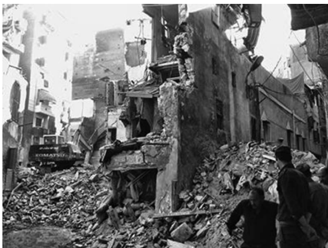
Рис. 2. Обрушение здания в Египте, 2012 год. 19 жертв, погибших предположительно в результате коррупции

Еще более страшным событием с большим количеством человеческих жертв явилось обрушение торгового центра в Сеуле (Южная Корея) в 1995 году. Тогда по-