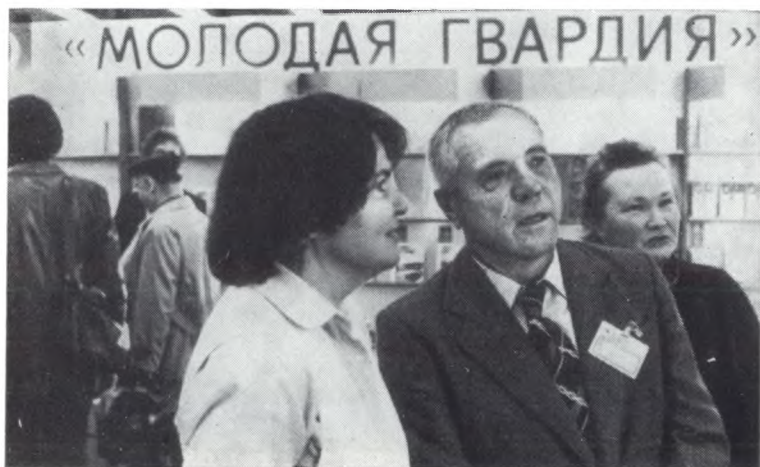
На Международной ярмарке, в павильоне «Молодой гвардии».