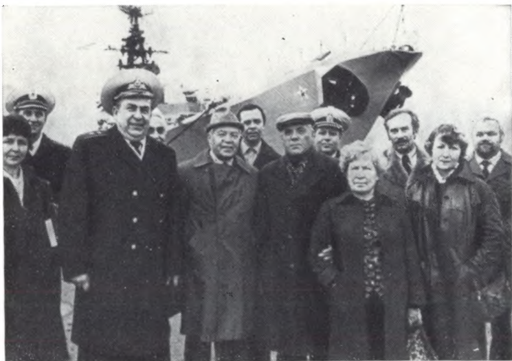
В Североморске, на рейде во время выездного секретариата в 1981 г. Возглавлял его Сергей Залыгин.