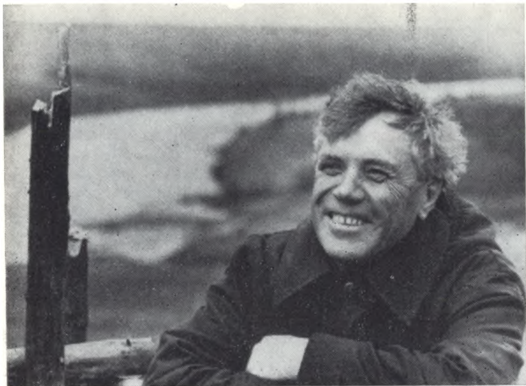
На Вологодчине в семидесятые годы.