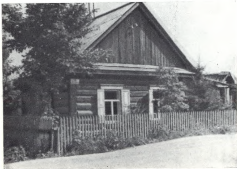
Нынешний дом в Овсянке.