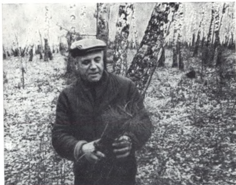
Саженец кедра, найденный возле Овсянки.