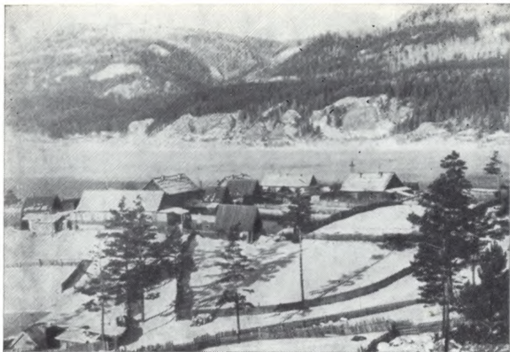
Деревня Овсянка зимой.