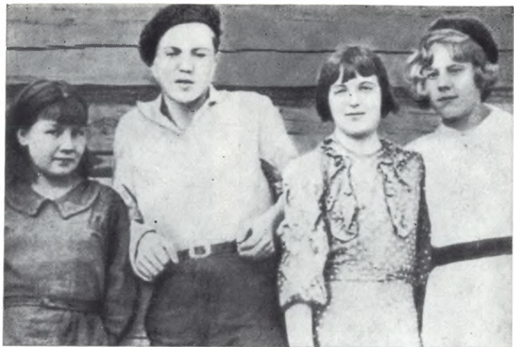
Детдом в Игарке. 1941 г.