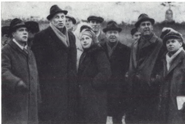
П. Нилин, С. Залыгин, Ал. Михайлов, А. Соболев, В. Дементьев и другие.