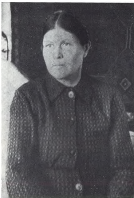
Бабушка. Примерно 1952 г.