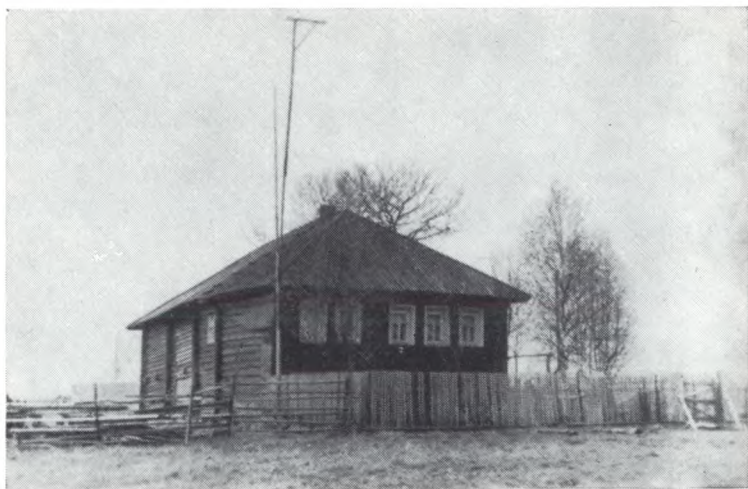
Дом в деревушке Сибла, на Вологодчине, где было пустынно, тихо и хорошо работалось, — здесь закончена «Царь-рыба», напечатана вторая книга «Последнего поклона» и много чего понаделано...