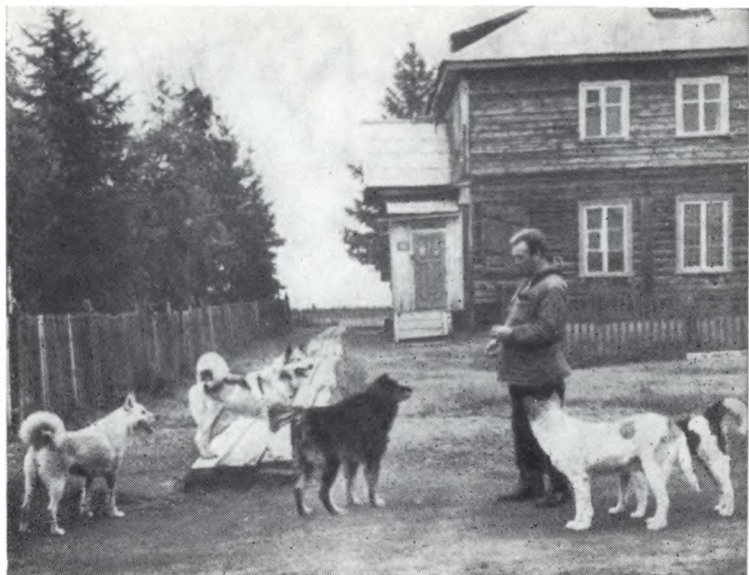
В туруханском аэропорту во время работы над «Царь-рыбой», 1971 г.