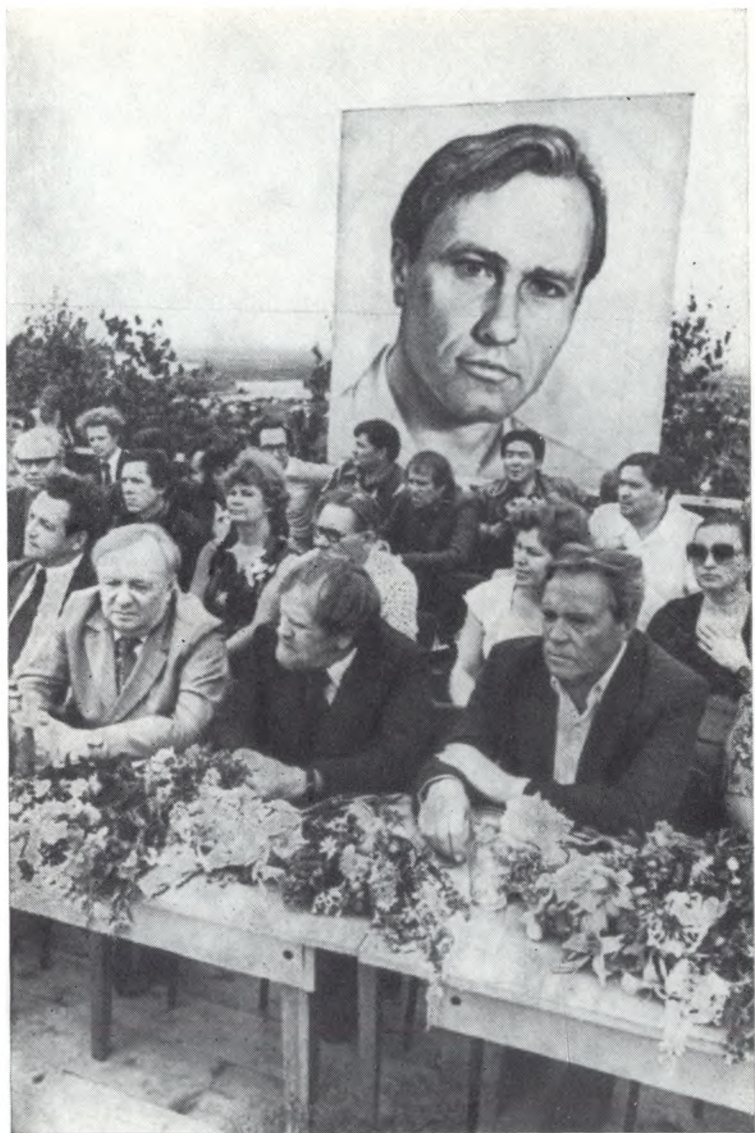
На Шукшинских чтениях в селе Сростки. Справа от В. Астафьева — Василий Белов.