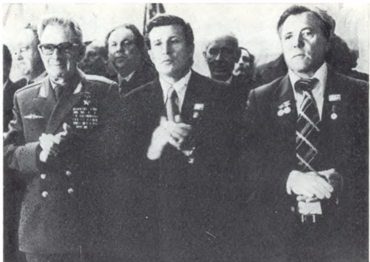
На праздновании 50-летия г. Игарки.