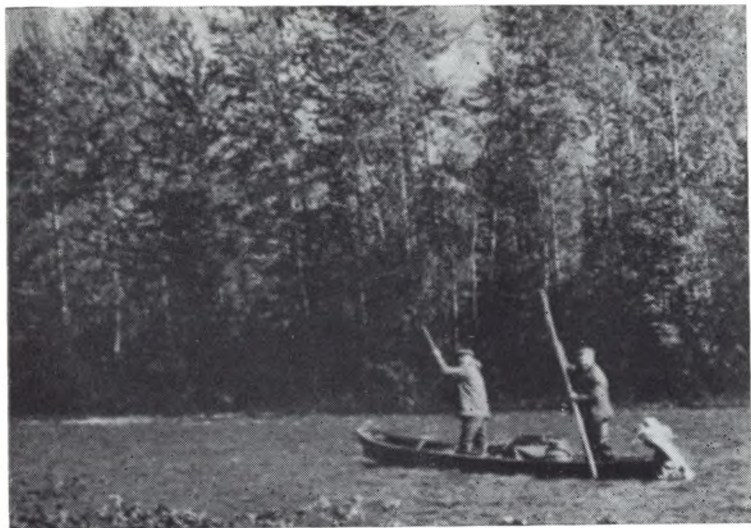
На реке Аныл, юг Красноярского края.