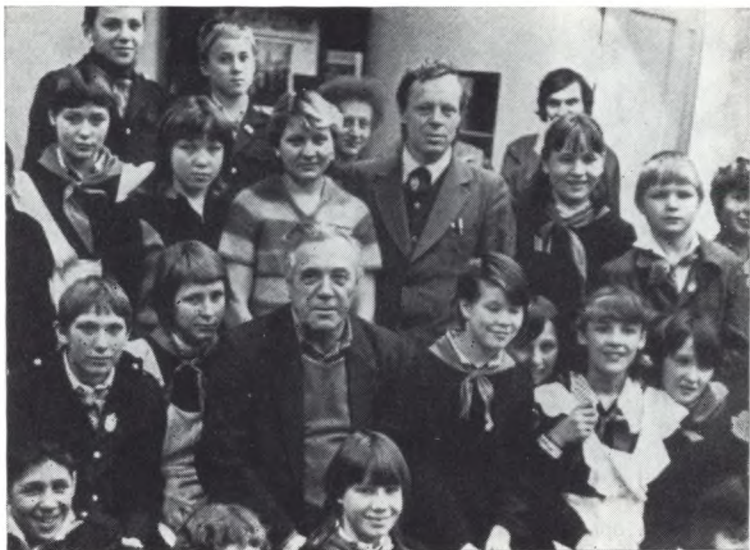
С воспитанниками подшефного детдома (школа-интернат № 3) г. Красноярск, 1983 г.