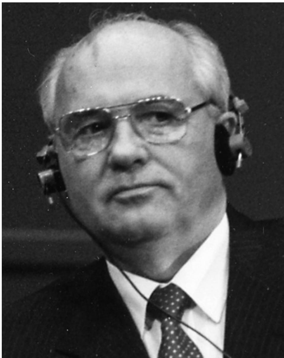
Михаил Горбачев в последний год власти.