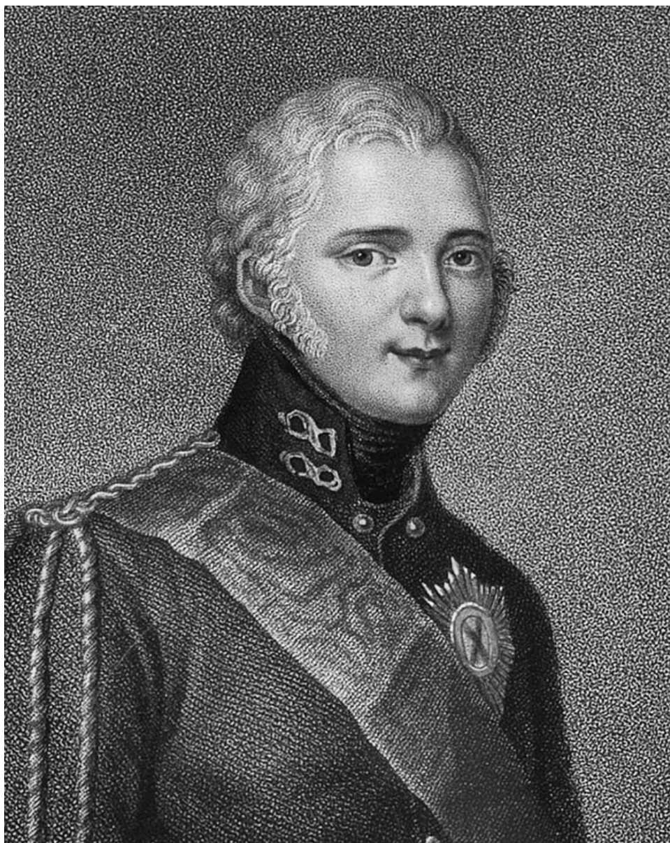
Александр в романтическом возрасте. Литография 1804 г.