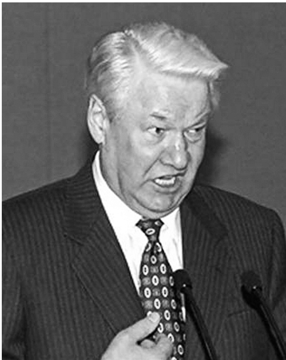
Ельцин позднего периода.