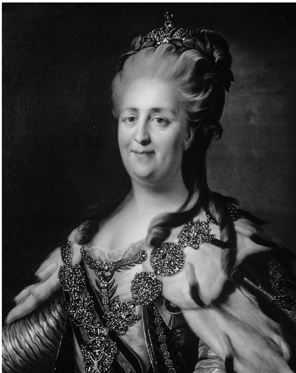
Екатерина: всегда с милостивой улыбкой Портрет И.-Б. Лампи