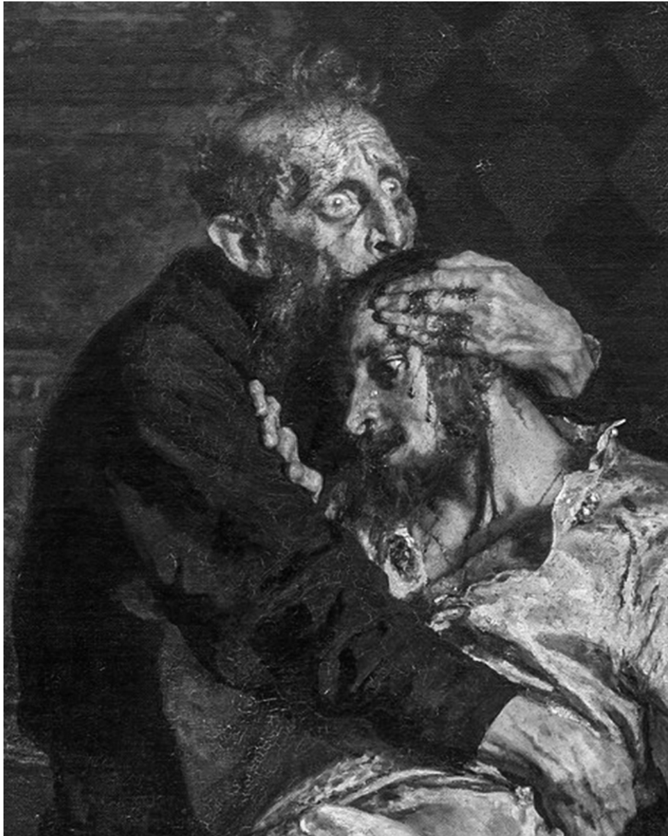
Фрагмент картины И.Репина: царь Иван убивает своего сына