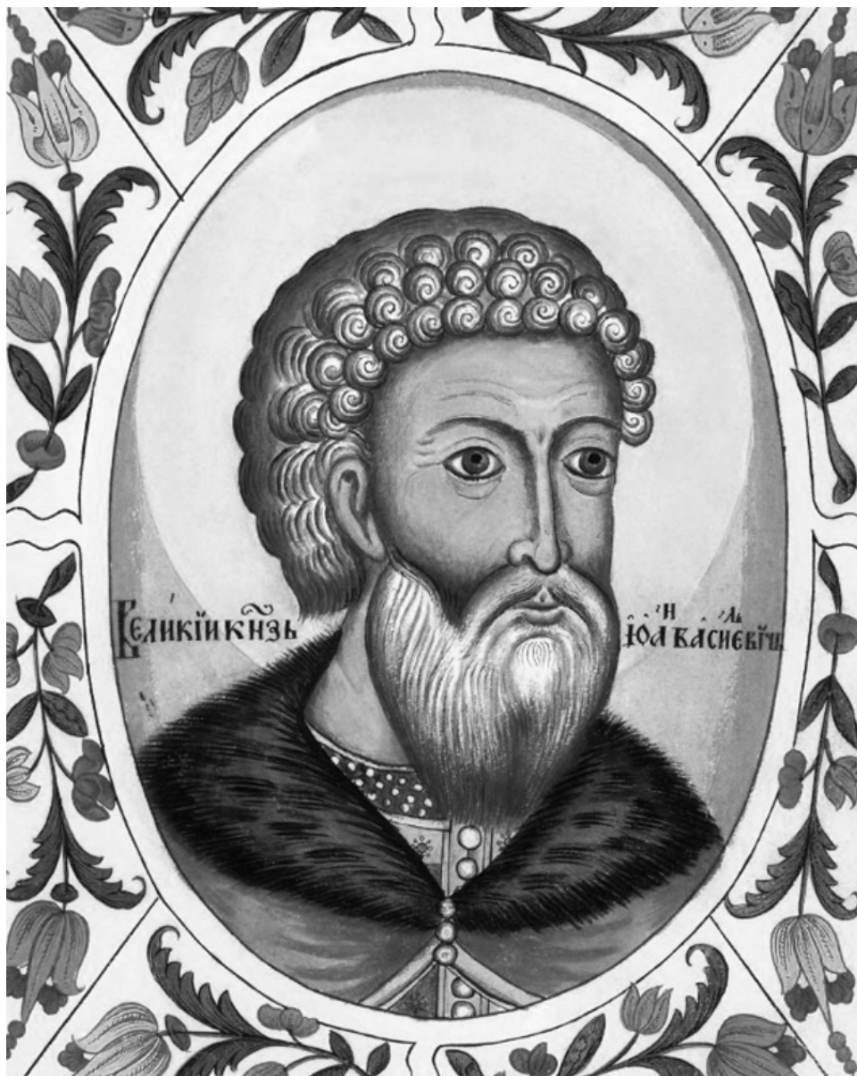
Фантазийный портрет из «Царского титулярника» (1672 г.)