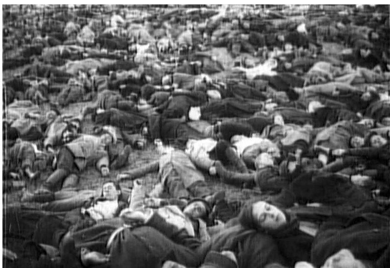
Рис. 16. Неудавшийся штурм: убитые забастовщики (кадр из к/ф «Стачка», реж. С. М. Эйзенштейн, 1924 год)