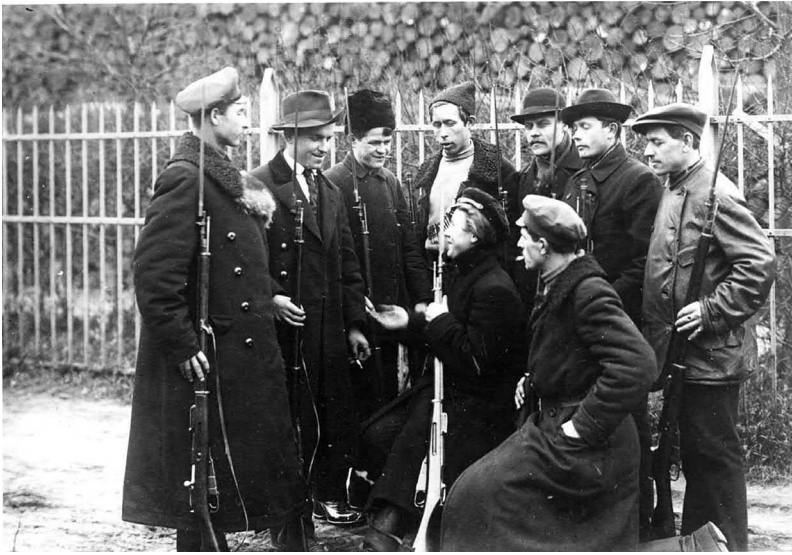
Рис. 2. Рассказчики революции: красногвардейцы в Смольном, октябрь 1917 года

Большевики последовательно отвечали своим критикам. «Где заговор?» — вопрошала «Правда» на передовице номера от 31 октября. По их мнению, утверждения о том, что большевики организовали заговор, «тайное соглашение немногих», были необоснованными. Они открыто агитировали на массовых собраниях и в прессе, что «переворот» был осуществлен «десятками, сотнями, тысячами рабочих и солдат». Восстание было успешным, заключала редакционная статья, «именно потому, что оно было не затеей заговорщиков, а народной революцией» 57 . Газета «Социал-демократ», официальный орган партии большевиков, высмеяла телеграмму начальника гарнизона города Ржев, который уведомлял о захвате власти в городе «кучкой большевиков» и добавлял, однако, что у него нет достаточных сил,