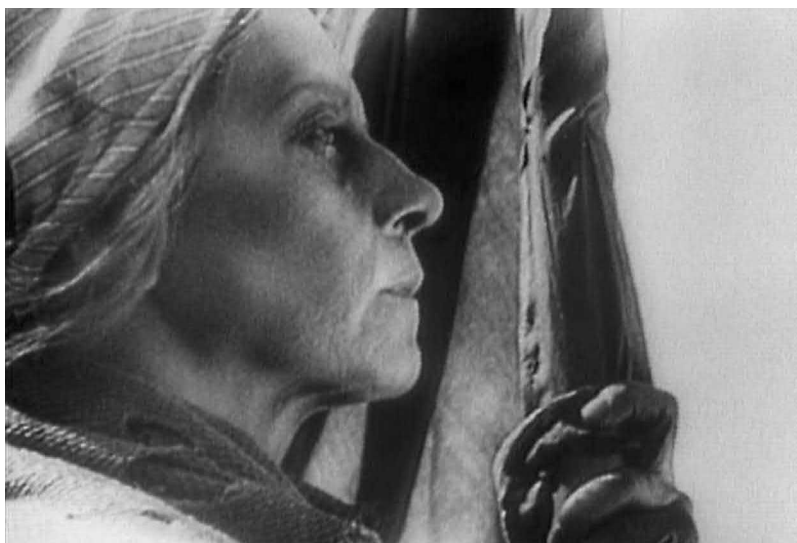
Рис. 15. Марианна борющаяся: последний бой матери (кадр из к/ф «Мать», реж. В. И. Пудовкин, 1927 год)