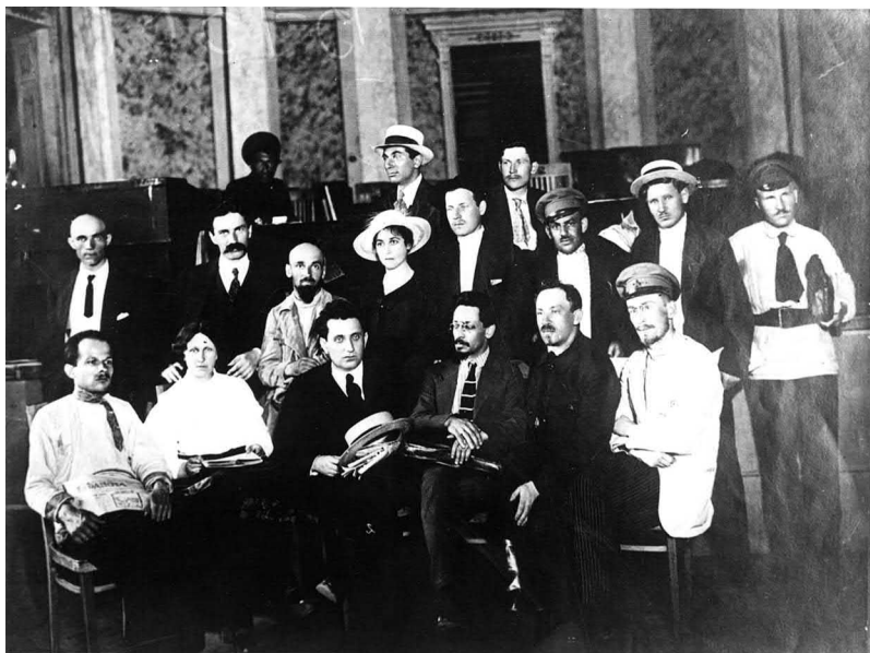
Рис. 1. Группа коммунистов на Всероссийском съезде Советов в 1918 году

Н. А. Некрасова: «Мы слышим звуки одобренья, / Не в сладком рокоте хвалы, / А в диких криках озлобленья!» 20