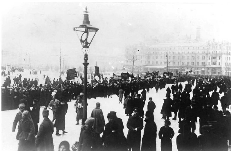
Рис. 3. «Красные похороны» в Москве, ноябрь 1917 года

ленную большевистскую идентичность, которая, вероятно, была неизвестна им при жизни [Лежава, Русаков 1924] 121 .