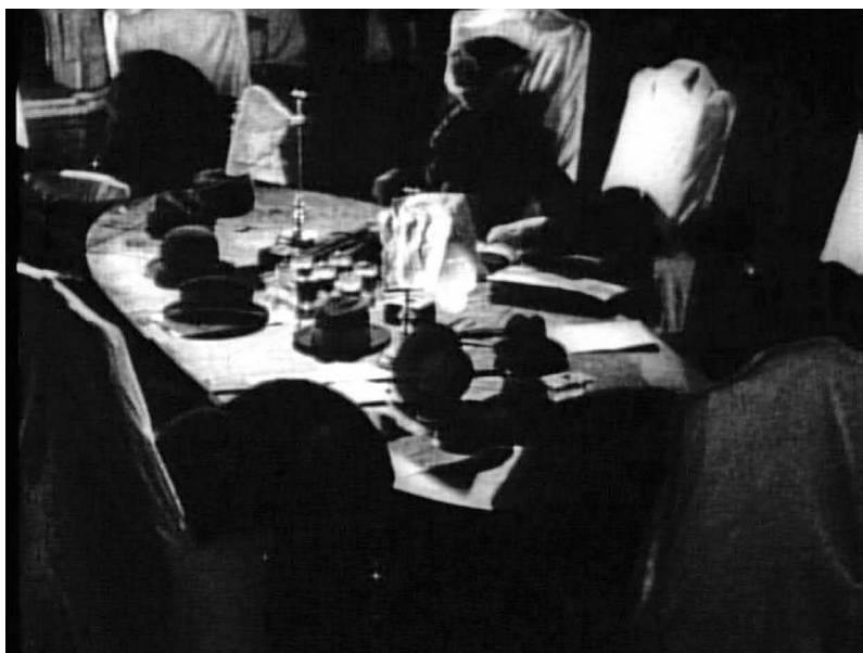
Рис. 14. Призрачная власть: пустые пиджаки министров Временного правительства (кадр из к/ф «Октябрь», реж. С. М. Эйзенштейн, 1927 год)

восстанием, символично обводя карандашом на карте Зимний дворец и Дворцовую площадь. В противовес этому идеальному образу большевика в фильме представлен портрет менее стойкого и прозорливого революционера — Троцкого как оратора, призывающего восставших к осторожности в Июльские дни («Восстание преждевременно!») и открыто колеблющегося по поводу призыва Ленина к немедленным действиям. За активными, основательными военными приготовлениями в Смольном как безмолвные зрители наблюдают из своих кабинетов «меньшевики».