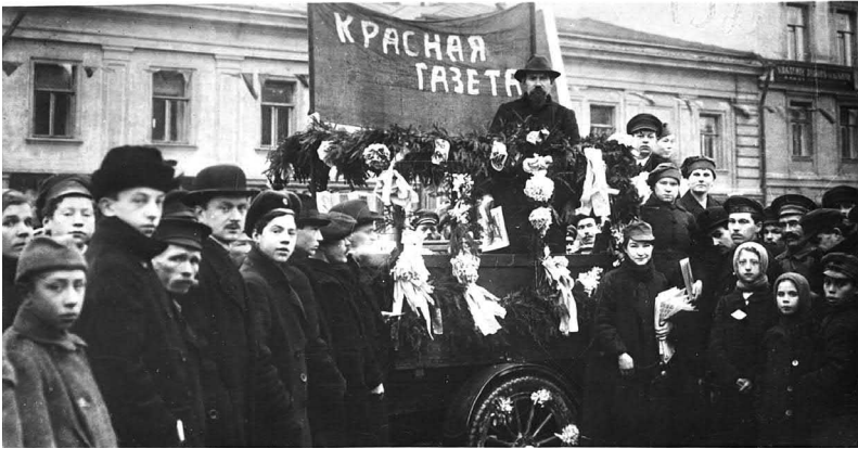
Рис. 4. Автомобиль «Красной газеты» в Петрограде на праздновании первой годовщины Октябрьской революции

иерархия должна была создать ощущение, что за массовое празднование в новом государстве отвечают сами рабочие. Во время торжеств, говорилось в одной из статей, «должен царить образцовый пролетарский порядок. Только суровая товарищеская дисциплина и выдержка самих рабочих масс создадут такой порядок» 29 .