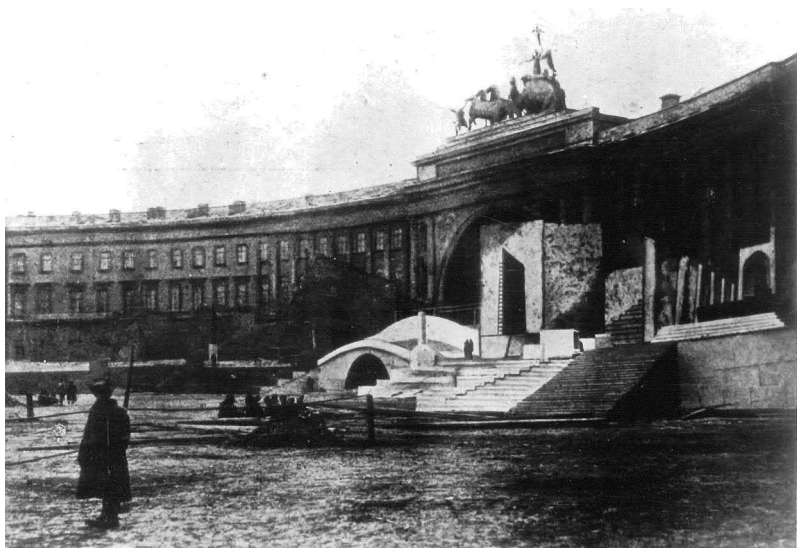
Рис. 5. Сценические декорации к «Взятию Зимнего дворца» Н. Н. Евреинова, 7 ноября 1920 года

ждался нерешительными строфами «Интернационала», гимна Парижской коммуны: «Еще несорганизовавшийся пролетариат напряженно прислушивается к стотысячному зрителю, ожидая от народа... совета или призыва к конечному действию. Но робок еще народ и не слышится из уст его нужного слова!» 30 По ходу представления «умы и сердца» масс были завоеваны коммунистическими идеями при посредничестве «агитаторов», и массы перешли на сторону рабочих 31 . С этого момента белая платформа превратилась в образец хаотичного, беспорядочного движения под нестройное исполнение «Марсельезы», в то время как красная платформа олицетворяла революционную слаженность: на ней