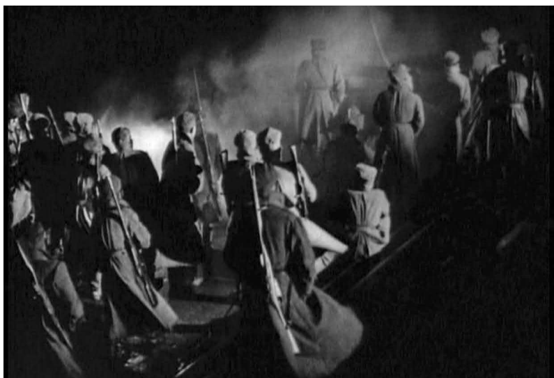
Рис. 17. Революционная сдержанность: солдаты терпеливо ждут приказа о начале штурма (кадр из фильма «Конец Санкт-Петербурга», реж. В. И. Пудовкин, 1927 год)

задерживается на изящных классических статуях, украшающих крыши Петербурга, на царских чиновниках и владельцах фабрик, сидящих перед камерой с сознательной неподвижностью 41 . Эйзенштейн останавливался на возвышающейся статуе Александра III с державой и скипетром в руке и на пустых пиджаках, оставленных на столе заседаний министрами Временного правительства незадолго до прихода большевиков.