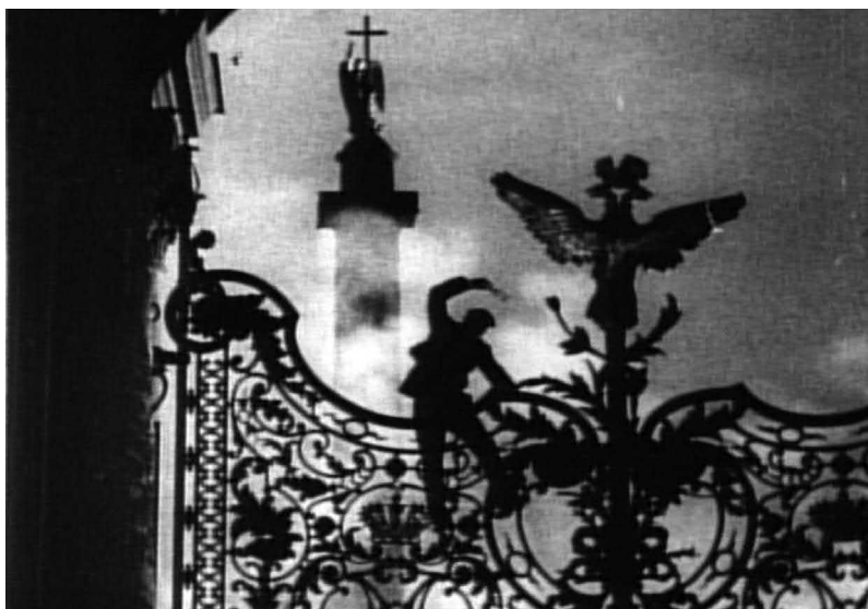
Рис. 20. Штурм Зимнего дворца (кадр из к/ф «Октябрь», реж. С. М. Эйзенштейн, 1927 год)