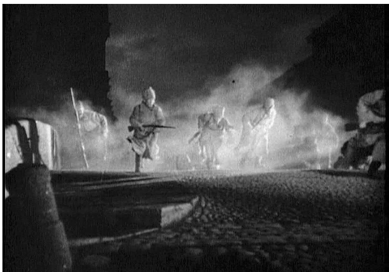
Рис. 18. Штурм Зимнего дворца (кадр из фильма «Конец Санкт-Петербурга», реж. В. И. Пудовкин, 1927 год)