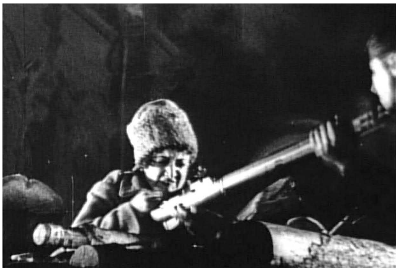
Рис. 19. Женский батальон смерти защищает Зимний дворец (кадр из к/ф «Октябрь», реж. С. М. Эйзенштейн, 1927 год)