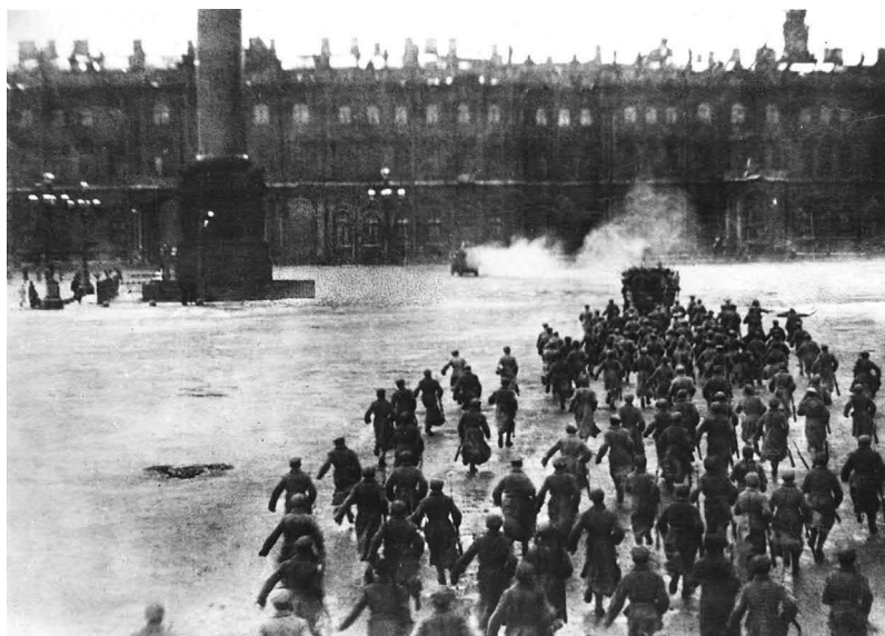
Рис. 6. Взятие Зимнего дворца, 7 ноября 1920 года

рабочие и солдаты сходились к большому красному флагу, чтобы присоединиться к хоровому исполнению «Интернационала». Описание Евреиновым драматического финального штурма оказало огромное влияние на тон последующих представлений о спектакле: