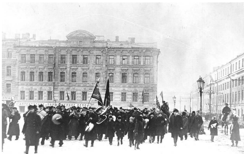
Рис. 12. Демонстрация в Петрограде, посвященная 25-й годовщине создания РКП(б), 1923 год

партии и ее расколом, кризисом Второго Интернационала и рождением Третьего 44 . Недавно созданный Институт Ленина и Институт Маркса и Энгельса активно обсуждались на XIII съезде партии в 1924 году [Тринадцатый съезд... 1924: 560–573]. Неустанное издание Институтом Ленина его работ обеспечило большевистской партии идеологическую целостность. Творчество Ленина было, по выражению Каменева, «богатством, которым располагает партия» [Ленинский сборник, 2: 3] 45 .