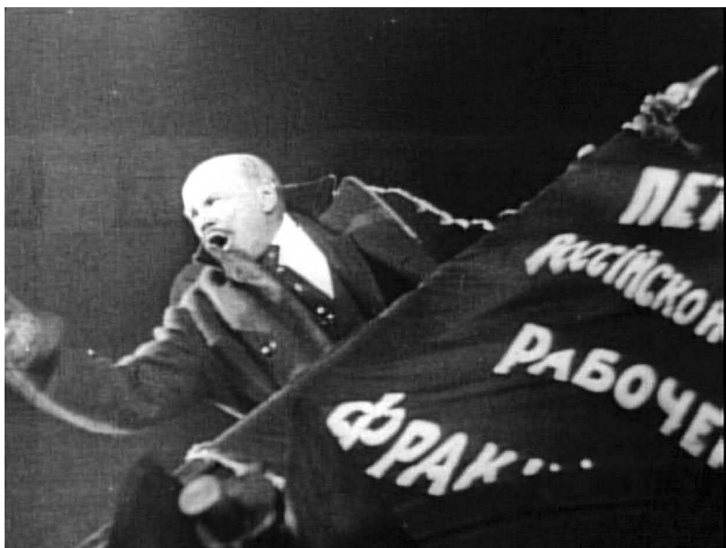
Рис. 13. Революция начинается: В. И. Ленин на Финляндском вокзале (кадр из к/ф «Октябрь», реж. С. М. Эйзенштейн, 1927 год)

Смольного, заседания ЦК большевиков 10 октября и ВРК. В то же время революционное повествование разворачивается в прямой зависимости от перемещений Ленина. В апреле он прибывает на Финляндский вокзал, встреченный бешеным восторгом ожидающих его войск и рабочих. «Ульянов» на одном интертитре уступает место «Ленину» на другом: так человек становится революционером.