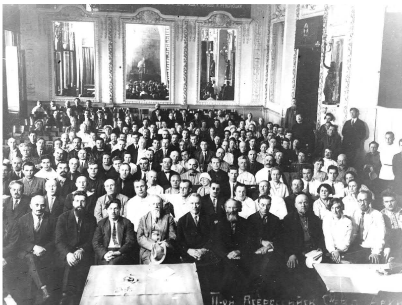
Рис. 10. Делегаты Второго Всероссийского съезда архивных работников, 1929 год

с бытовавшим в России мнением, что затяжное пребывание в эмиграции отдалило их от российских масс. В этом центральном архиве эмиграция стала физически и символически интегрирована в российское революционное движение 60 .