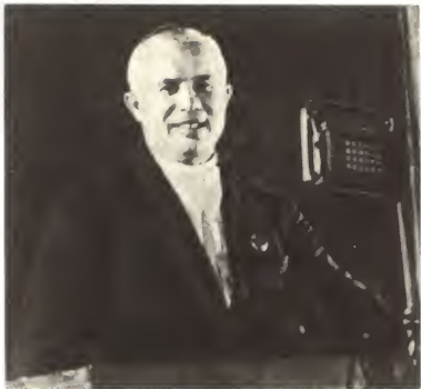
Н. С. Хрущев — первый секретарь МК и МГК ВКП(б). 1935 г.