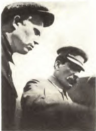
И. В. Сталин и Н. С. Хрущев. 1 мая 1932 г.