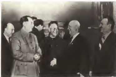
Мао Цзэдун, Н. С. Хрущев и А. И. Микоян.