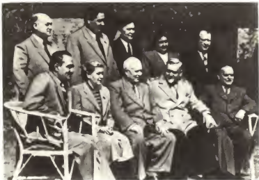
Во время первого визита в Пекин в 1954 г. Сидят (слева направо): А. И. Микоян, Е. А. Фурцева, Н. С. Хрущев, Н. А. Булганин, В. М. Молотов. Среди стоящих сзади — Я. С. Насриддинова.