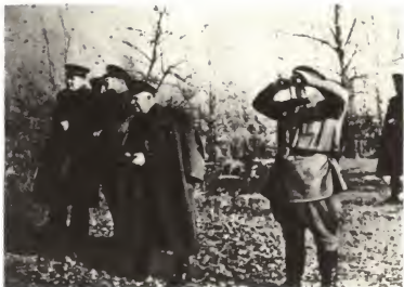
Сталинградский фронт. Октябрь 1942 г. Н. С. Хрущев с генералом А. И. Еременко и офицерами штаба.