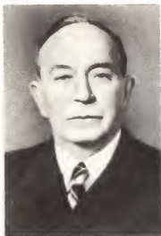
О. В. Куусинен.