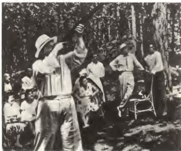
На отдыхе в Крыму. 1961 г. Слева — В. Ульбрихт и В. Гомулка, справа — М. А. Суслов и Л. И. Брежнев.