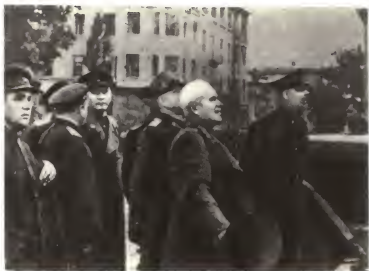
В освобожденном Кракове. Январь 1945 г.