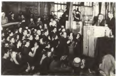
Митинг на московском заводе «Каучук», посвященный итогам работы XX съезда КПСС. На трибуне — глава делегации Компартии Великобритании на XX съезде Гарри Поллит. 1956 г.