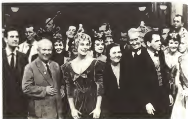
Н. С. и Н. П. Хрущевы на киностудии кинокомпании «Твентис Сенчури Фокс» в Голливуде.