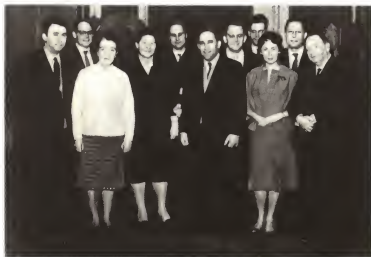
Л. Н. Толкунов (в центре) и Ф. М. Бурлацкий (слева) в Будапеште.

Митинг на электроламповом заводе. Рядом с Н. С. Хрущевым Я. Кадар. 1964 г.