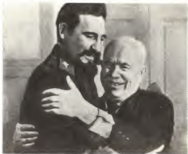
Н. С. Хрущев и премьер-министр революционного правительства Кубы Ф. Кастро.