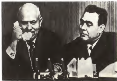
Во время разговора с космонавтом Валентиной Терешковой. Рядом сидит Л. И. Брежнев. 1963 г.