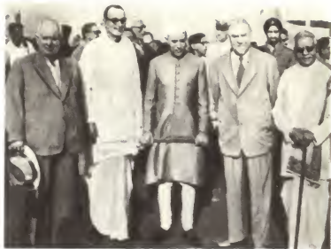
Н. С. Хрущев и Н. А. Булганин в Индии с Д. Неру и другими индийскими лидерами. 1955 г.