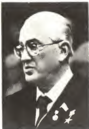
Ю. В. Андропов.