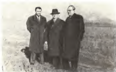
Члены советской делегации в Албании Ю. В. Андропов и П. Н. Поспелов. Слева — Ф. М. Бурлацкий. 1961 г.