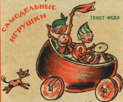
РИС. А. СОВОРОВОЙ