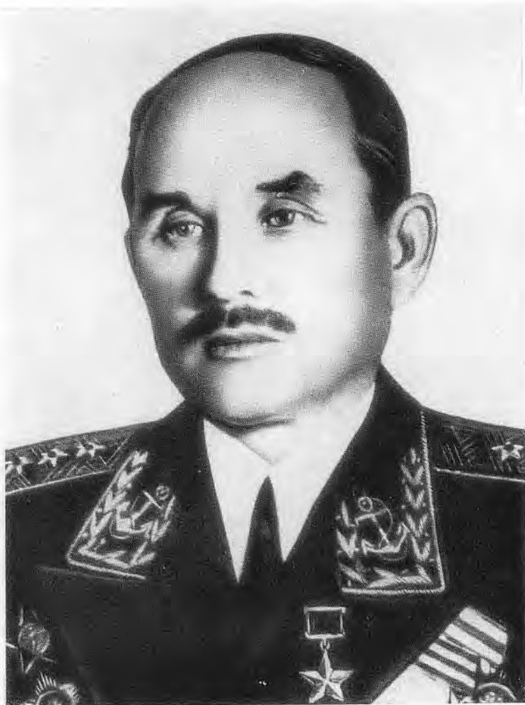
Адмирал Ф. С. Октябрьский.