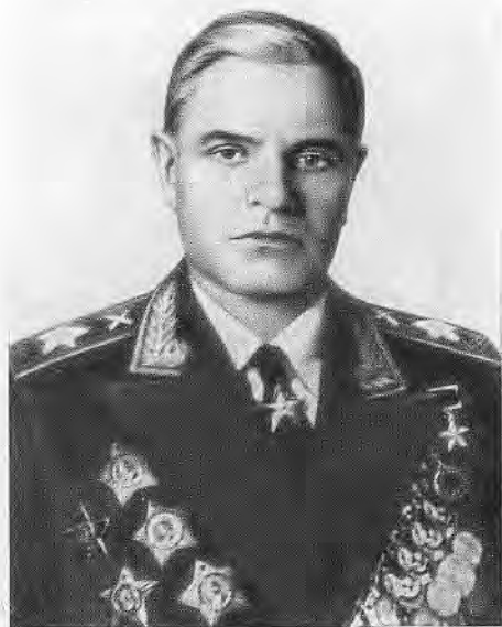
Маршал артиллерии В. И. Казаков.

ка на Кавказ и в Закавказье. Объехать эти районы вынуждала сама обстановка. Развертывая наступление на кавказском направлении, гитлеровцы стремились прежде всего овладеть кавказскими нефтяными источниками СССР, а в случае неудачи уничтожить их, чтобы сорвать снабжение Красной Армии горючим. Наступление их сухопутных войск поддерживалось значительной авиационной группировкой, которая со второй половины 1942 года все более проявляла активность. Только в пределах Закавказья с июля по декабрь было зафиксировано почти 7,5 тысячи самолетов-пролетов.