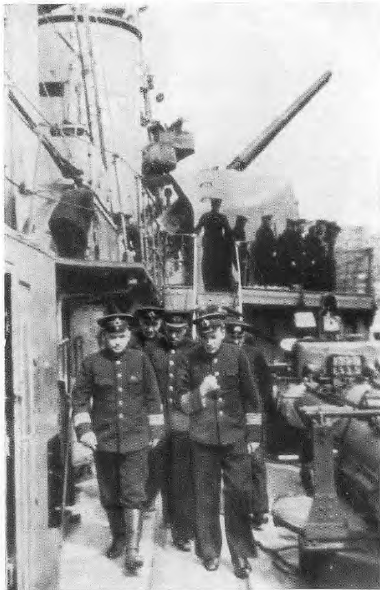
Командующий Черноморским флотом Ф. С. Октябрьский обходит крейсер в дни обороны Одессы. 1941 г.