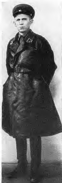
М. С. Громадин. 1939 г.