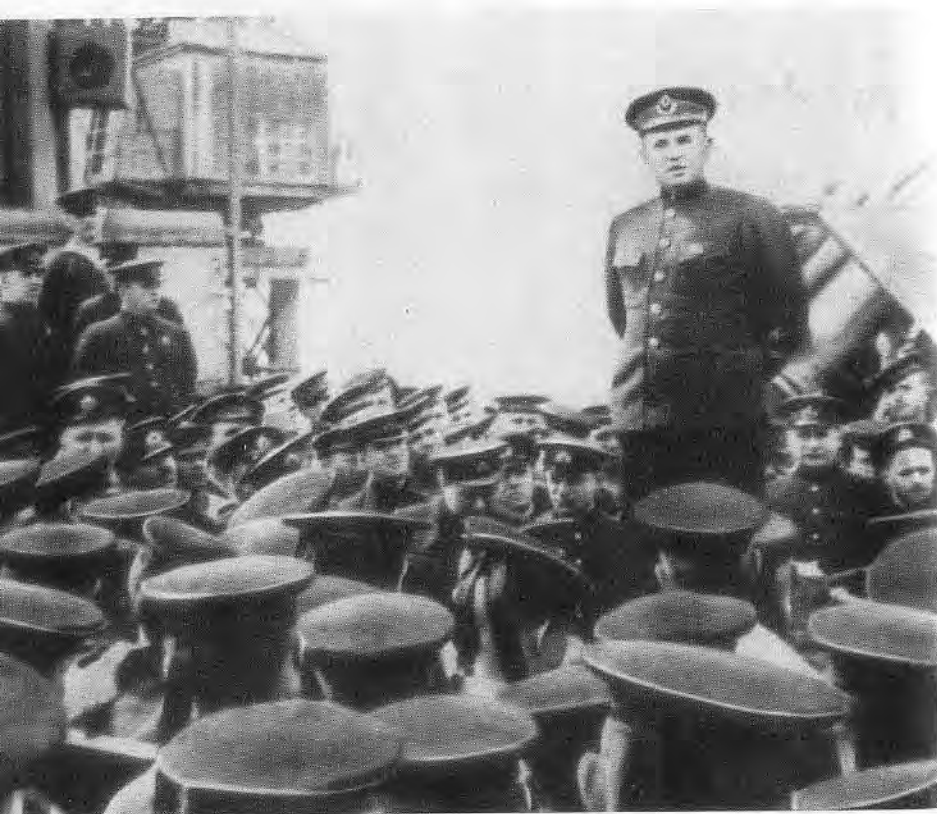
Ф. С. Октябрьский выступает перед моряками.