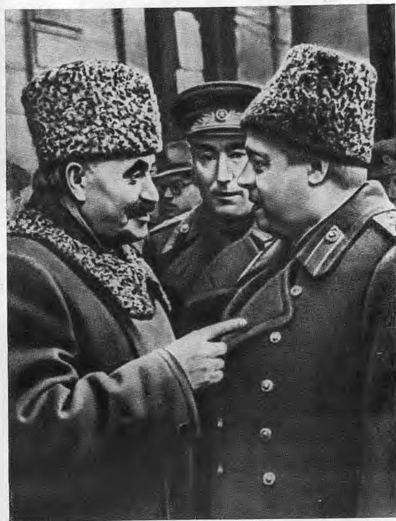
Георгий Димитров, Ф. И. Толбухин, С. С. Бирюзов.