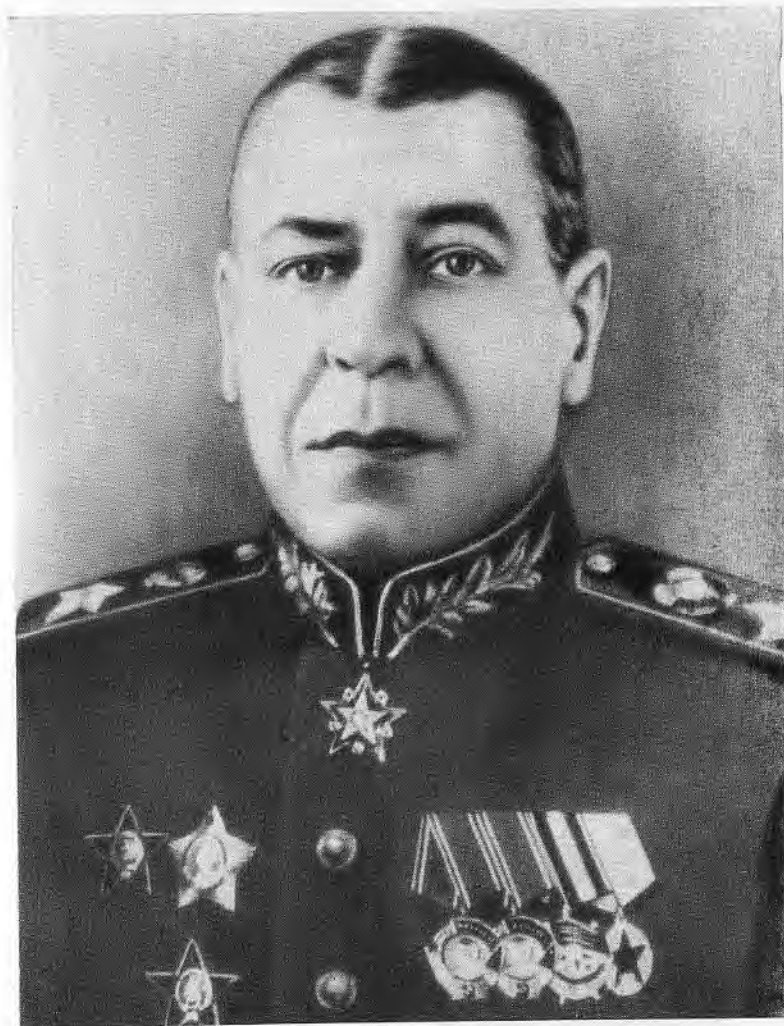
Маршал Советского Союза Б. М. Шапошников.