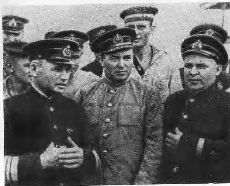
Ф. С. Октябрьский с группой моряков.