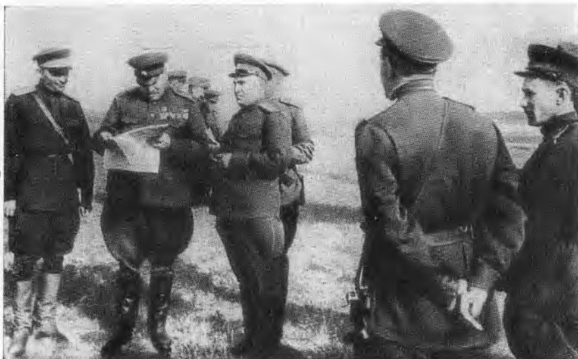
Ф. И. Толбухин и член Военного совета Четвертого Украинского фронта К. А. Гуров (в центре) на Четвертом Украинском фронте. Лето 1943 г.