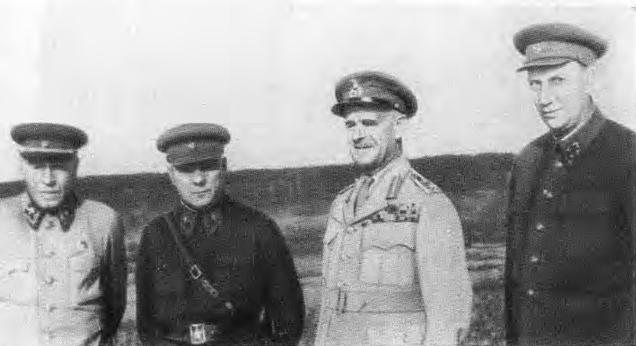
Б. М. Шапошников, К. Е. Ворошилов, Н. Н. Воронов и представи- тель английской военной миссии на смотре боевой техники Крас- ной Армии. Подмоскowie.