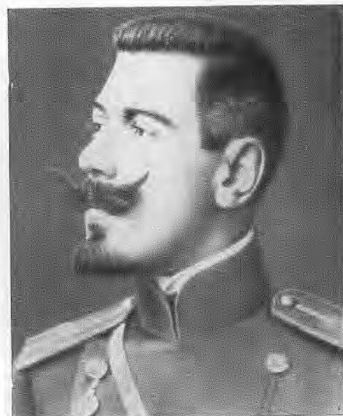
Поручик Б. М. Шапошников. 1907 г.