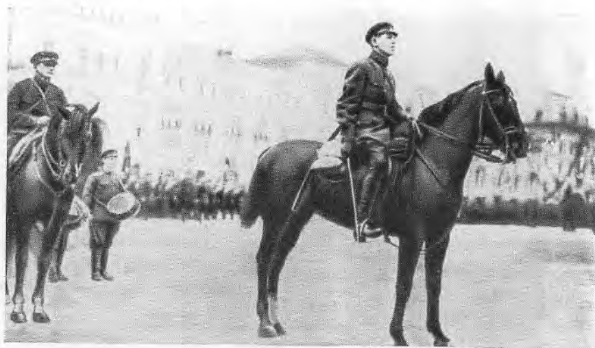
Командующий войсками Московского военного округа на военном параде. Москва, май 1928 г.