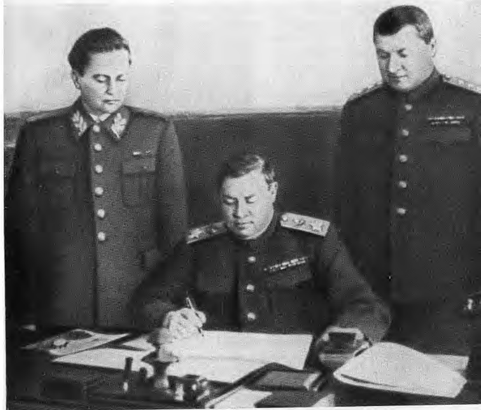
Подписание соглашения между советским командованием и командованием Югославской народно-освободительной армии. Слева направо: И. Броз-Тито, Ф. И. Толбухин, А. С. Желтов. Конец сентября 1944 г.