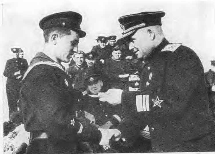
Ф. С. Октябрьский вручает ордена летчикам.