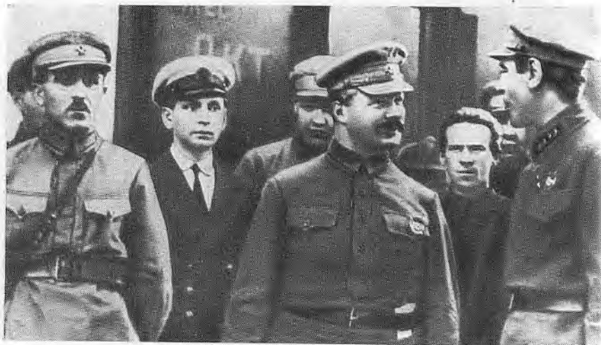
М. В. Фрунзе и Б. М. Шапошников, Ленинград, 1925 г.