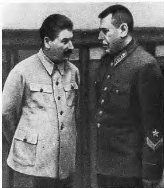
Б. М. Шапошников на докладе у И. В. Сталина. 1938 г.