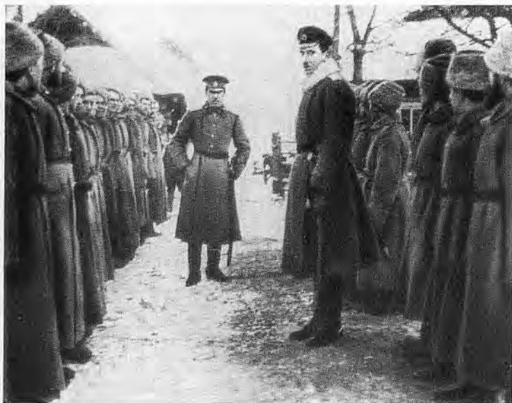
Б. М. Шапошников среди солдат. 1914 г.