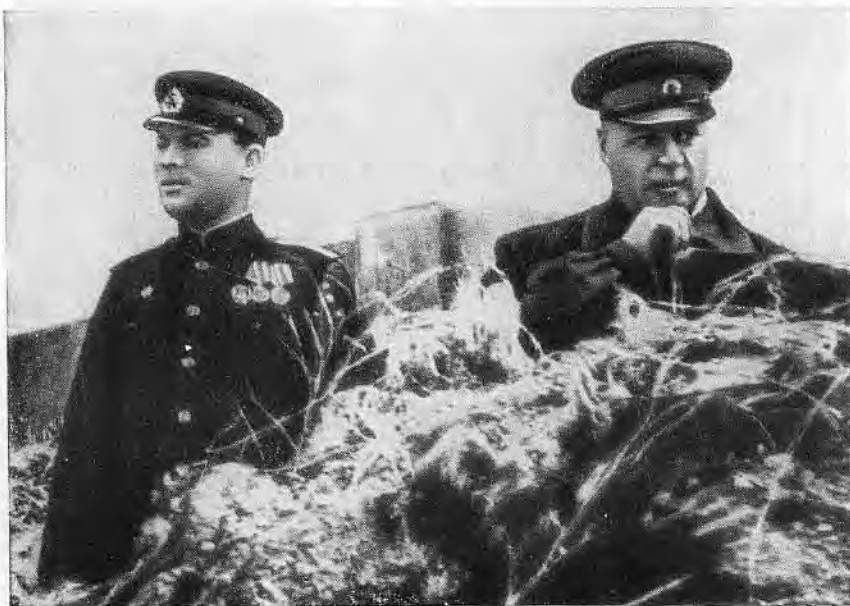
Ф. И. Толбухин на командном пункте. Севастополь, 1944 г.