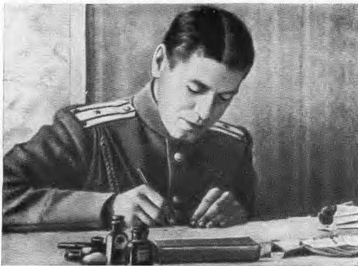
Подполковник Б. М. Шапошников в оперативном отделе Юго-Западного фронта в годы первой мировой войны.