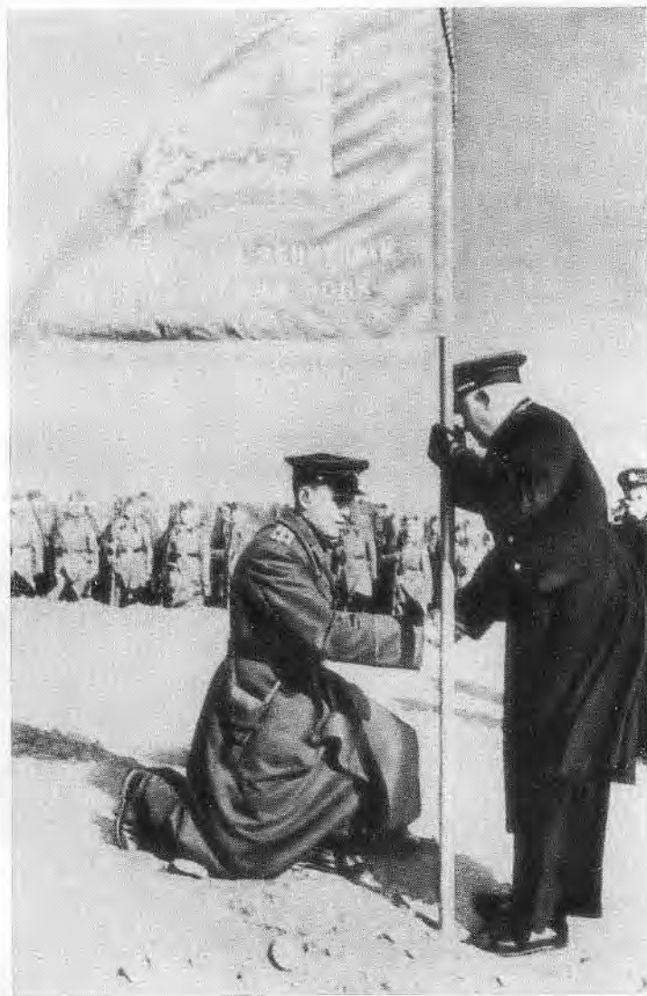
Командующий Черноморским флотом Ф. С. Октябрьский вручает гвардейское знамя командиру 1-го зенитного артиллерийского полка полковнику Семенову.