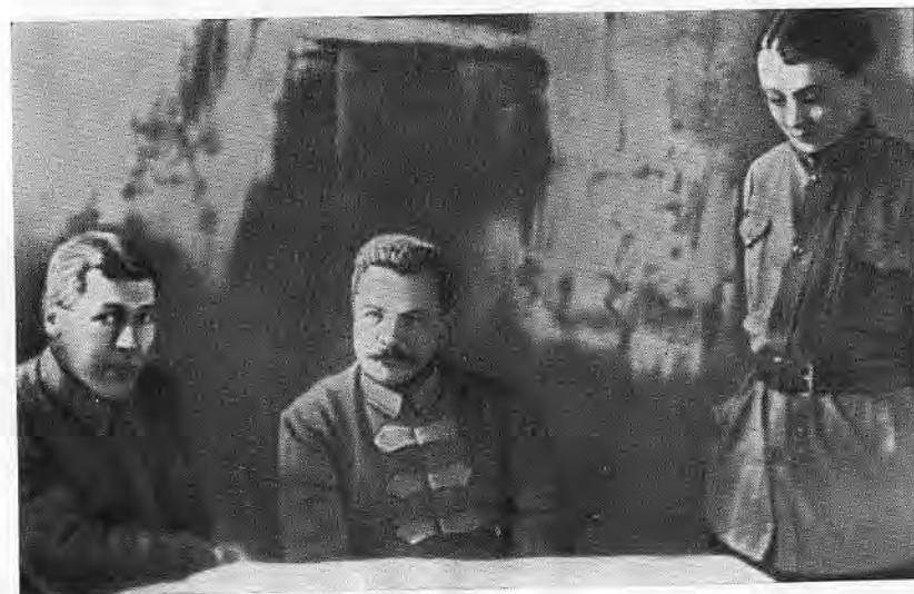
Б. М. Шапошников, М. В. Фрунзе, М. Н. Тухачевский. 1922 г.