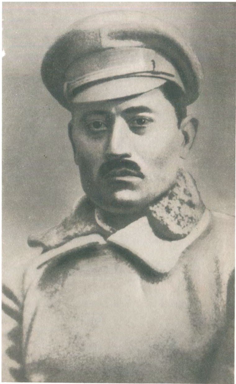
К. Атабаев в период гражданской войны