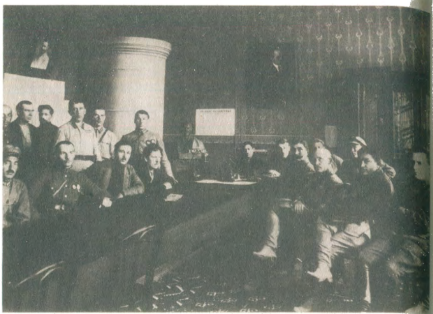
Заседание Совнаркома Туркменистана. К. Атабаев в центре, второй справа от него — С. М. Буденный