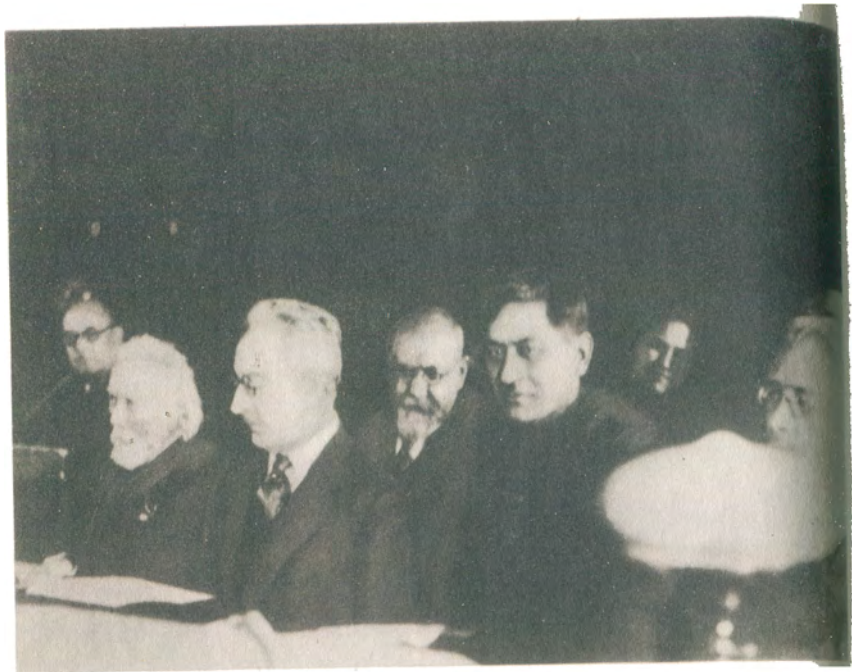
Ленинград. На совещании по научной организации труда