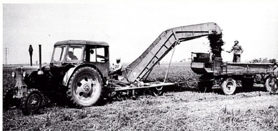
IFA RS 04/30 на уборке урожая.