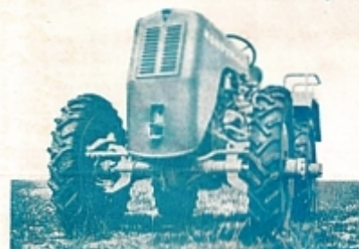
Typ St 18 und St 30 in moderner Blockrahmen-Konstruktion