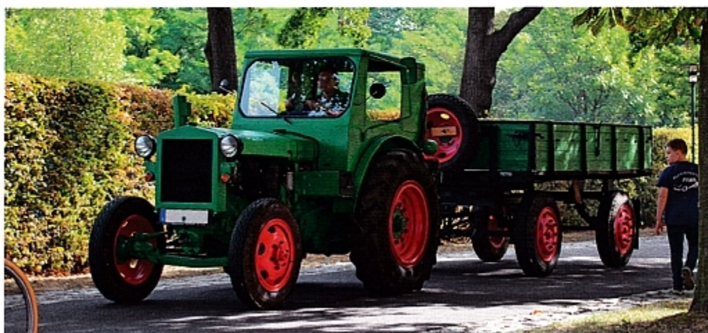
IFA RS 01/40 Pionier, первый трактор ГДР.

Присвоение типовых обозначений моделям тракторов было в ГДР унифицировано. Сокращения RS означало колесный трактор-тягач, GT – самоходное шасси, KS – гусеничный трактор, ZT – трактор-тягач и RT – колесный трактор. Последующая комбинация цифр отражала текущий номер разработки, а за косой чертой – мощность в лошадиных силах. Кстати, до сих пор остается загадкой, почему модель RS 04/30 не получила дополнительного названия, как ее предшественники Brockenhexe («Брокенская ведьма»), Pionier («Пионер») и Aktivist («Активист»).