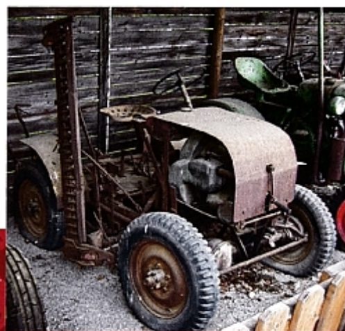
Старенький Gerwi-Diesel-Stier с боковой косилкой.

Первой моделью при новом руководстве, в 1951 году, стал 28-сильный Stier 30, с полным приводом, одинакового размера колесами, а также тормозной системой передних колес через карданный вал. Под капотом стояли охлаждаемые воздухом или водой двухтактные или четырехтактные дизели. С июня 1951 года тракторы Stier компании «Нордтрак» поставлялись с новым капотом и в серо-голубой окраске. Эти современные машины были полноценными полноприводными тракторами и больше не имели ничего общего