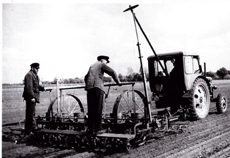
Трактор RS 04/30 на посеве кукурузы.

Вскоре, в том же в 1949 году, центральное правление автомобилестроительного концерна в Берлине дало задание на разработку многоцелевого трактора. Заказ выполнило конструкторское бюро Тракторного завода