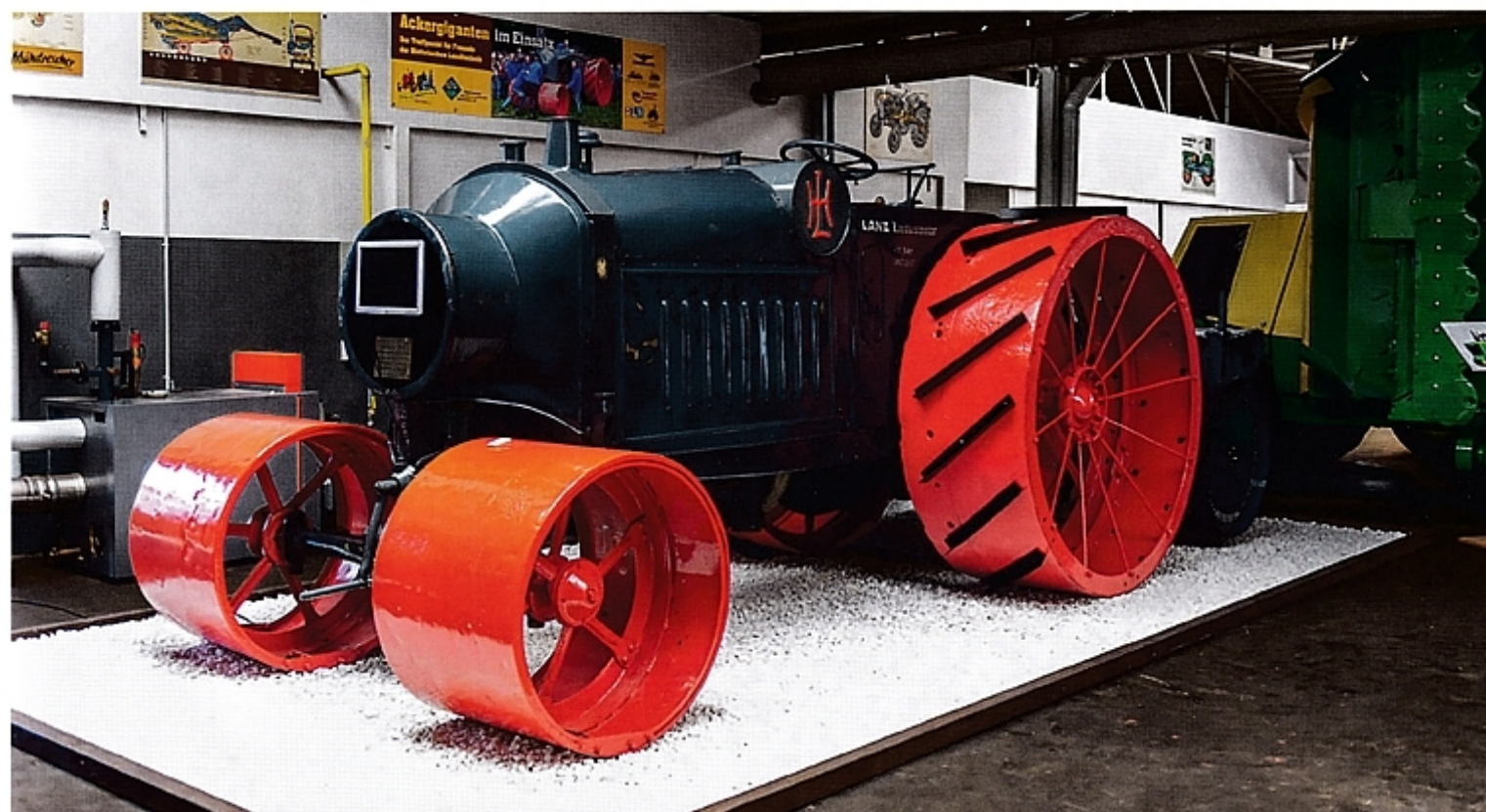
Трактор Lanz-Landbaumoto 1917 года в музее «Кроне».