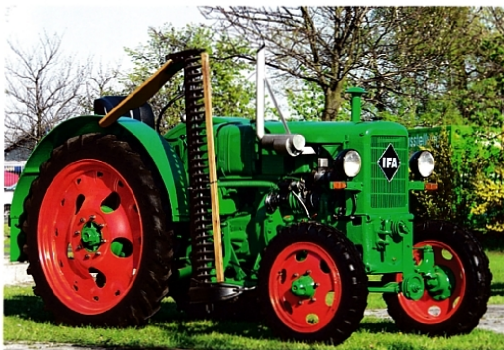
Режущий брус косилки изготавливали на предприятии Fortschritt («Прогресс») в Нойштадт-ан-дер-Зале.

Первые три трактора не удовлетворили крестьян. Производство Brockenhehe («Брокенхексе») прекратили в 1952 году, построив 1935 экземпляров. В том же году, после выпуска как минимум 3761 штук, сняли с производства Aktivist («Активист»). Хорошо зарекомендовал себя только Pionier («Пионер»): до 1956 года из ворот завода в трех модификациях вышли 24 903 трактора этой серии.