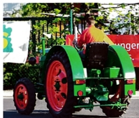
Вид сзади IFA RS 04/30, с валом отбора мощности, прицепной скобой и буксирными приспособлениями.

Трактор изготавливали в блочной безрамной конструкции.