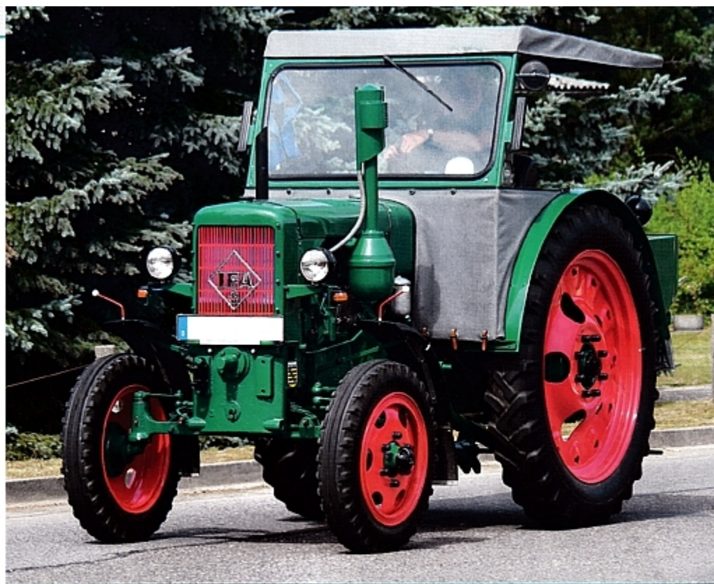
Вариант со складной крышей для защиты от непогоды.

Уже в 1956 году на смену RS 04/30 пришел RS 14/30 Famulus, изначально с двигателем EM 2-15. Быстрое развитие сельскохозяйственной техники, а главное, возникшие в результате принудительной коллективизации большие площади социалистического сельского хозяйства, сделали модернизацию неизбежной. За четыре года из ворот завода в Нордхаузене вышли в общей сложности 7574 трактора RS 04/30. Модель стала символом начального периода в истории ГДР.