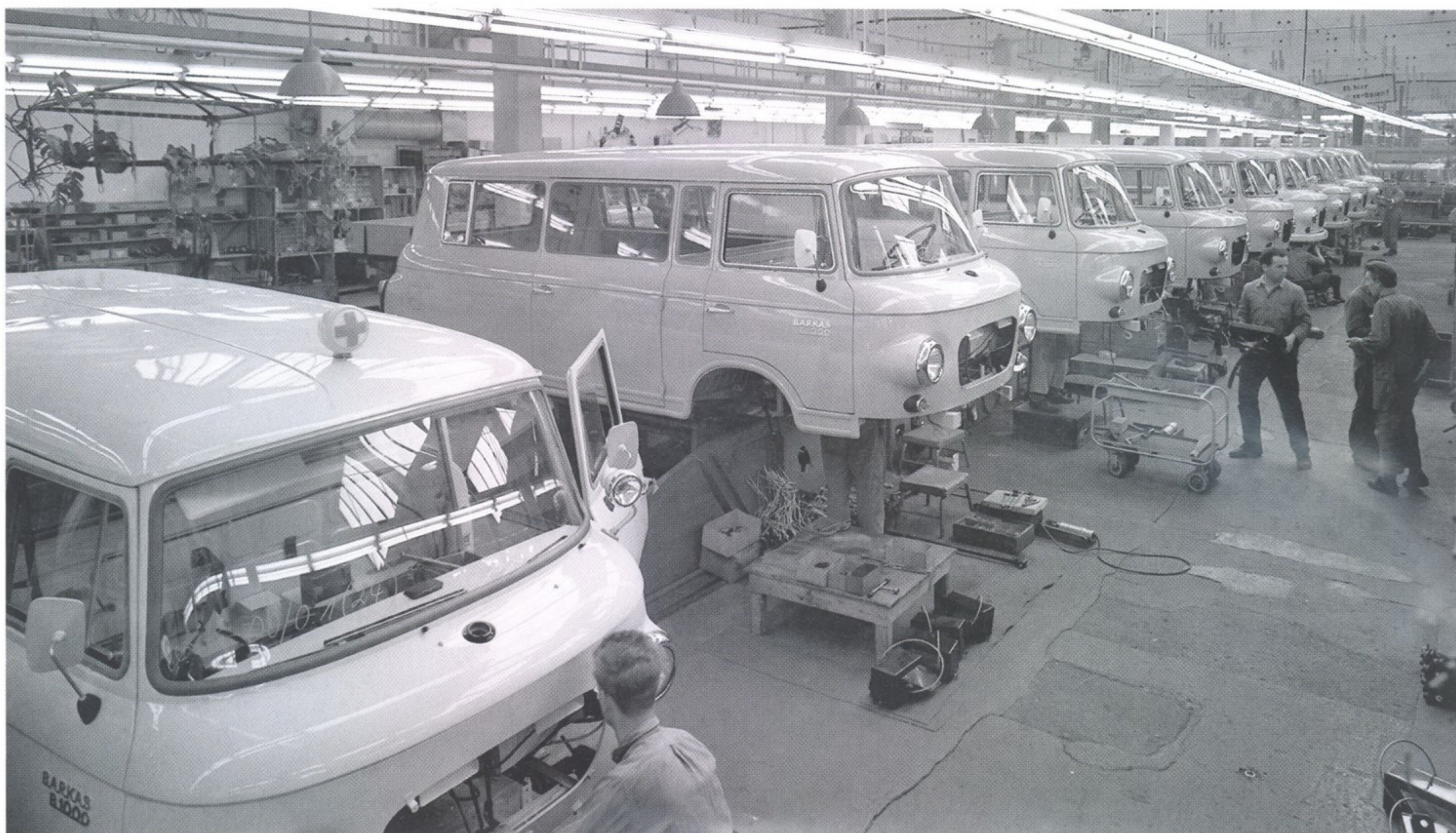
ТАК ВЫГЛЯДЕЛ ЦЕХ ПО СБОРКЕ АВТОМОБИЛЕЙ BARKAS НА ЗАВОДЕ В ГОРОДЕ КАРЛ-МАРКС-ШТАДТ В 1969 ГОДУ

и стало называться VEB Barkas-Werke. В городе Карл-Маркс-Штадт открылся завод, на котором 14 июля 1961 года стартовал выпуск нового семейства автомобилей B1000. В него входили грузовик с бортовой платформой, фургон с объемом кузова 6,4 м³ и 8-местный микроавтобус. Кроме того, выпускалось 13 модификаций шасси, на которые устанавливали кузова специального назначения.