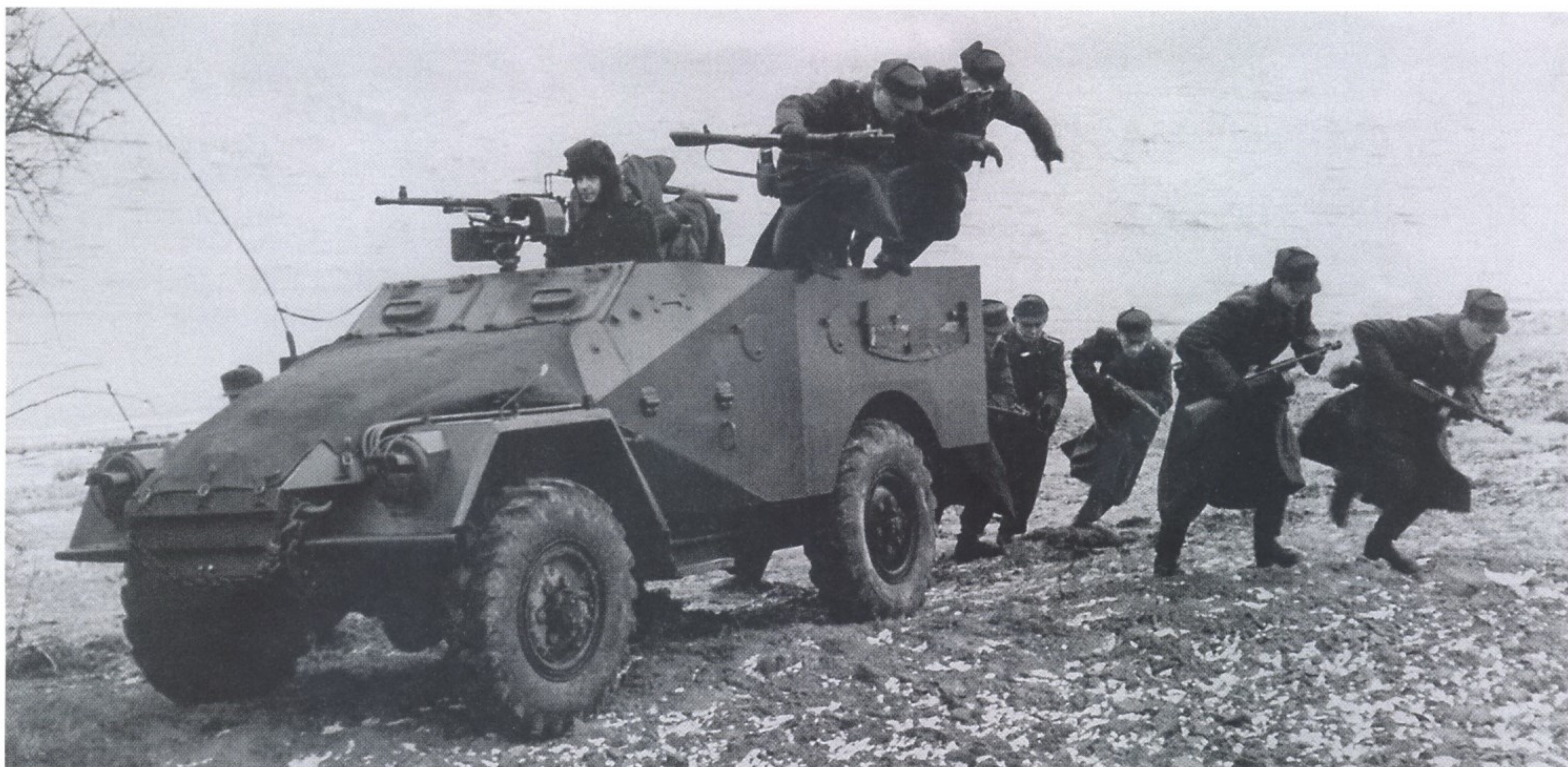
СЛУЖАЩИЕ ПОГРАНИЧНОЙ ПОЛИЦИИ ГДР НА ТАКТИЧЕСКИХ ЗАНЯТИЯХ ПО ОТРАБОТКЕ ДЕЙСТВИЙ, ПРЕДОТВРАЩАЮЩИХ ВОЗМОЖНЫЙ ПРОРЫВ ГОСУДАРСТВЕННОЙ ГРАНИЦЫ

В истории германского государства было немало событий, в результате которых система правоохранительных органов в целом и полиции в частности кардинально менялась. После окончания Второй мировой войны и победы над фашизмом Германия была разделена на четыре оккупационные зоны — по числу стран-победительниц. Первое подразделение полиции для охраны общественного порядка было создано в Берлине спустя всего несколько дней после взятия его Красной армией. Оно работало под контролем советской военной администрации.