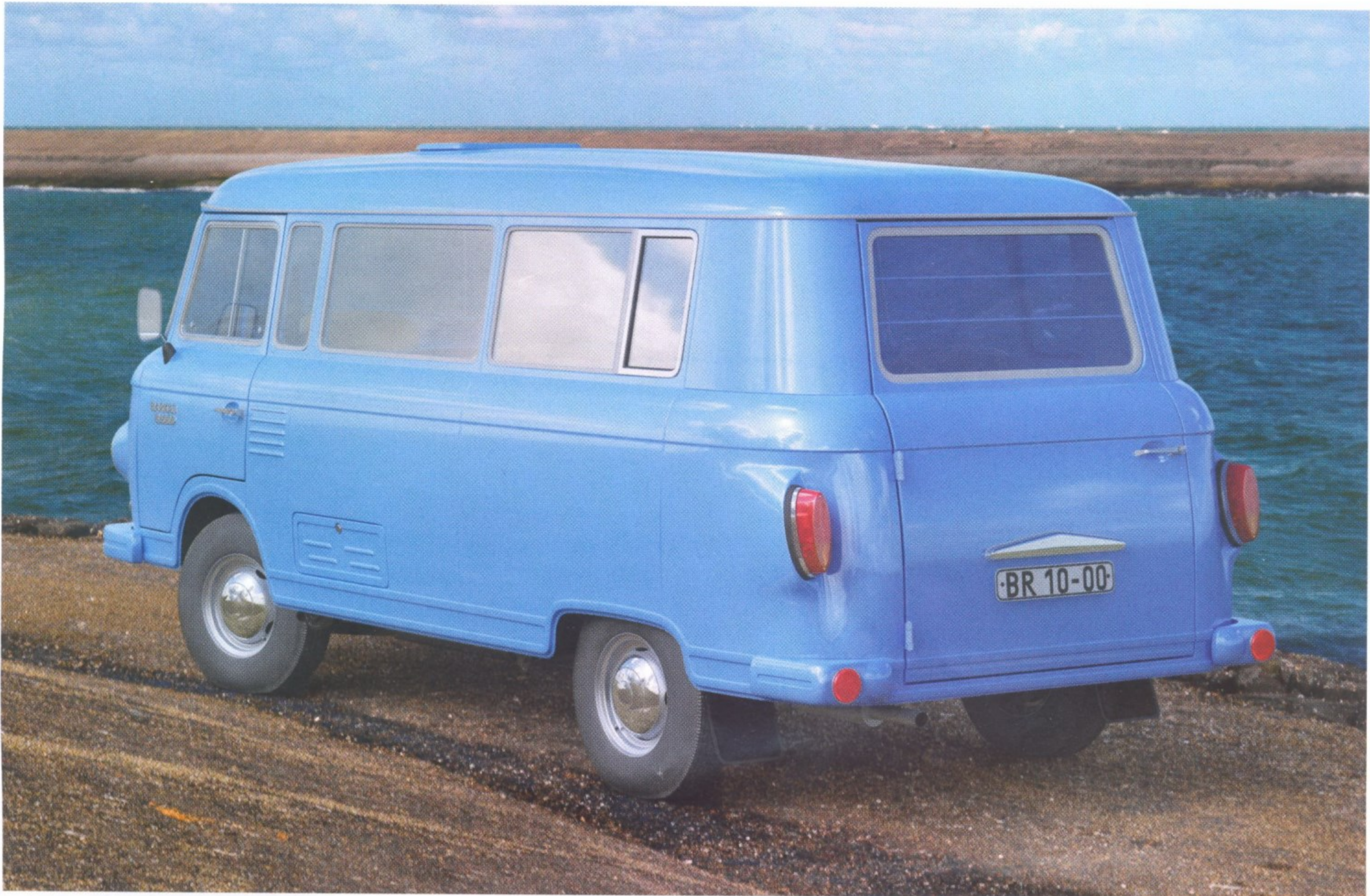
ХОТЯ МИКРОАВТОБУСОВ В1000 СОХРАНИЛОСЬ ДОВОЛЬНО МНОГО, ТАКАЯ МАШИНА — МЕЧТА ЛЮБОГО КОЛЛЕКЦИОНЕРА

В1000 выпускался на протяжении почти 30 лет с незначительными изменениями, в числе которых внедрение двухконтурной тормозной системы, диафрагменного сцепления и нового рулевого механизма. В конце 80-х годов на автомобиль начали устанавливать 4-цилиндровый 4-тактный 58-сильный двигатель, выпускавшийся по лицензии компании Volkswagen. Такие машины обозначались индексом В1000/1. В октябре 1991 года Германская Демократическая Республика воссоединилась с Федеративной Республикой Германия, и выпуск морально устаревших В1000 стал убыточным: они не выдерживали конкуренции с более современными коммерческими автомобилями. В итоге 10 апреля 1991 года производство Barkas В1000 было остановлено, а VEB Barkas-Werke прекратило свое существование. Всего за годы производства было выпущено 175 740 микроавтобусов модели В1000 и 1961 экземпляр В1000/1s.