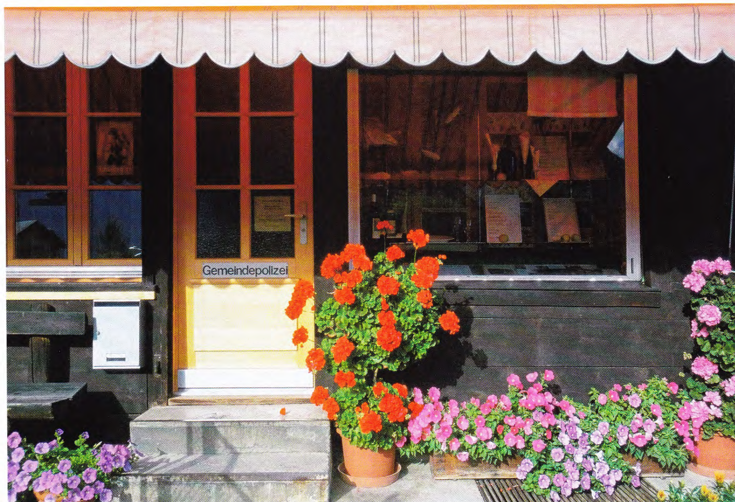
ПОЖАЛУЙ, НИ В ОДНОЙ ДРУГОЙ СТРАНЕ ВХОД В ПОЛИЦЕЙСКИЙ УЧАСТОК НЕ ВЫГЛЯДИТ ТАКИМ ДОМАШНИМ, КАК В ШВЕЙЦАРИИ (ДЕРЕВНЯ ВЕНГЕН, КАНТОН БЕРН)

предъявлено соответствующее обвинение. Обычные в таких ситуациях отговорки — «Я хотел отнести кошелек в полицию или вернуть хозяину» — здесь не проходят. Нарушил — отвечай по закону!