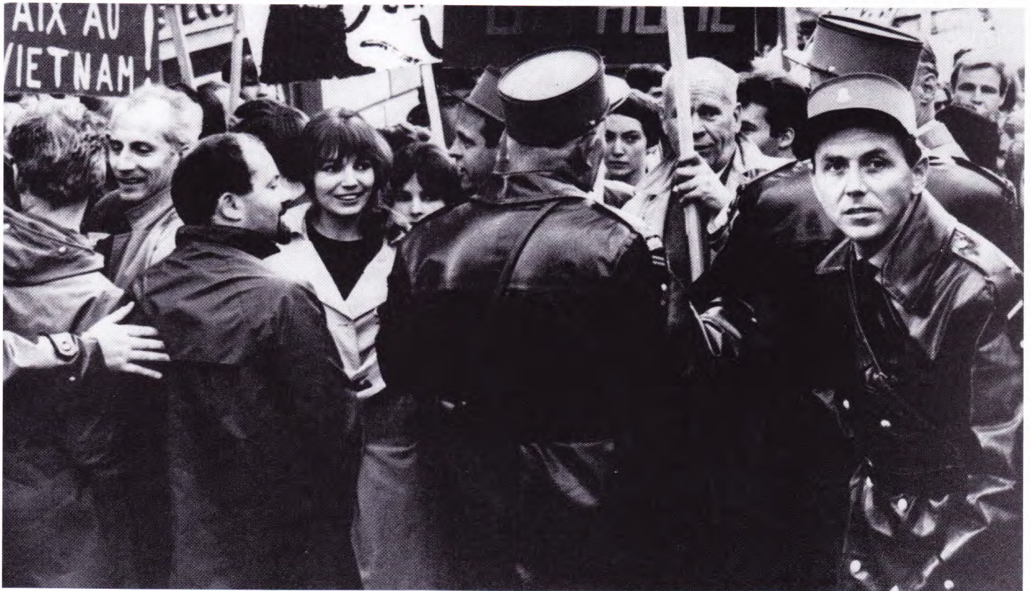
ПОЛИЦИЯ ЛЮЦЕРНА СДЕРЖИВАЕТ НАТИСК ДЕМОНСТРАНТОВ, ПРОТЕСТУЮЩИХ ПРОТИВ ВОЙНЫ США ВО ВЬЕТНАМЕ (4 АПРЕЛЯ 1965 ГОДА)

Люцерн — один из старейших кантонов, вошедший в состав Швейцарской Конфедерации еще в XIV веке. Официальным языком кантона является немецкий. Столица — город Люцерн, расположенный на берегах озера Фирвальдштеттерзее и реки Ройс. Территория кантона делится на пять округов, в которых проживает более 380 тысяч человек. Большая часть земель — это почти не тронутые цивилизацией природные ландшафты изумительной красоты, что привлекает сюда туристов со всего мира.