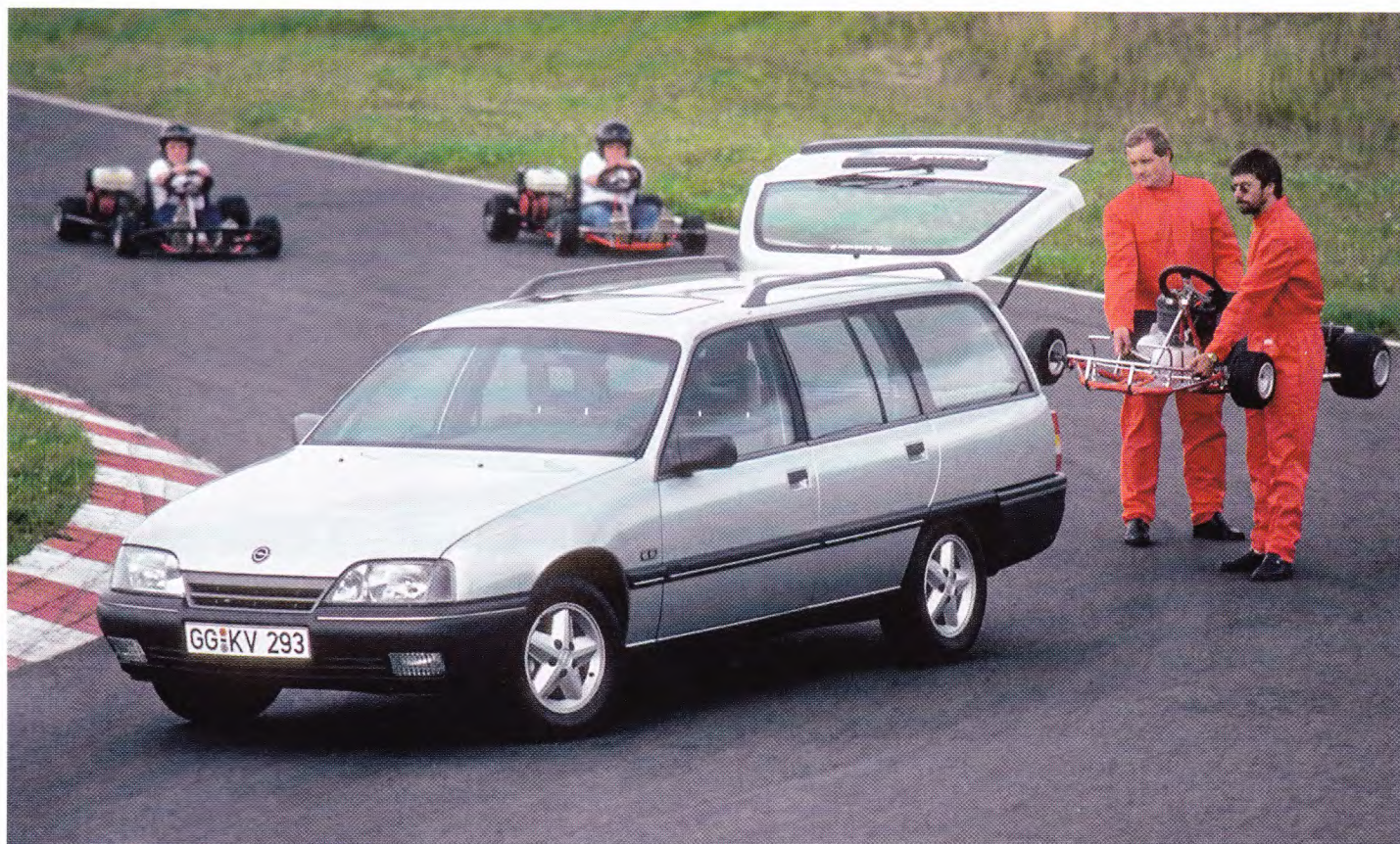
УНИВЕРСАЛ OPEL OMEGA A CARAVAN, ВЫПУСКАВШИЙСЯ С 1986 ПО 1994 ГОД, БЫЛ ОЧЕНЬ ПОПУЛЯРЕН В ЕВРОПЕ

того же объема и более мощные 2,5- и 3-литровые двигатели (170 и 211 л. с. соответственно). Дополнением был 2,5-литровый турбодизель (130 л. с.), презентованный еще в 1993 году. Трансмиссию можно было заказать как 5-ступенчатую механическую, так и 4-ступенчатый «автомат». Как и положено топ-модели, Omega оснащалась всеми необходимыми системами активной и пассивной безопасности. С самым маленьким по объему мотором и механической КПП автомобиль мог развивать максимальную скорость 195 км/ч, тогда как самый мощный в линейке 3-литровый V-образный двигатель разгонял его до 240 км/ч. Чтобы ускориться от 0 до 100 км/ч, самой мощной версии требовалось всего 8,8 сек. Caravan, как это обычно бывает с универсалами, получился менее динамичным за счет того, что был на 30 кг тяжелее седана и к тому же обладал худшим аэродинамическим коэффициентом. Не такой быстрой была и версия с коробкой-автоматом. Цены на Omega B в зависимости от комплектации колебались от 35 500 до 41 000 немецких марок.