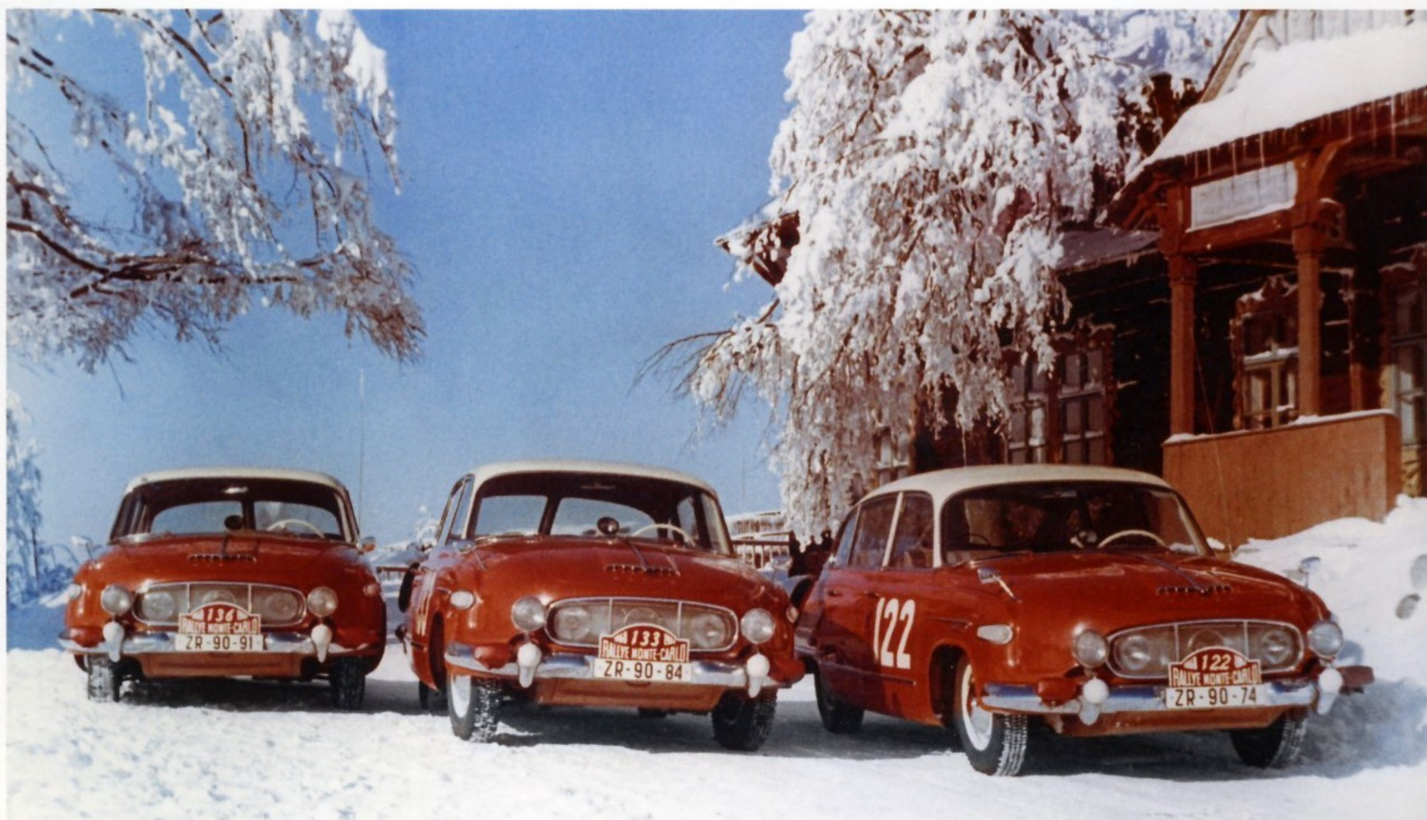
ТРИ СПОРТИВНЫХ АВТОМОБИЛЯ TATRA 603S ГОТОВЫ ОТПРАВИТЬСЯ НА RALLY MONTE CARLO (1960 ГОД)

Настоящим автомобильным шедевром Ледвинки была Tatra 77, имевшая трубчатую раму и расположенный сзади трехлитровый двигатель V8 с двумя верхними распределительными валами и воздушным охлаждением. С этого времени моторы с воздушным охлаждением стали своеобразной визитной карточкой марки. Помимо легковых автомобилей, компания выпускала и грузовики.