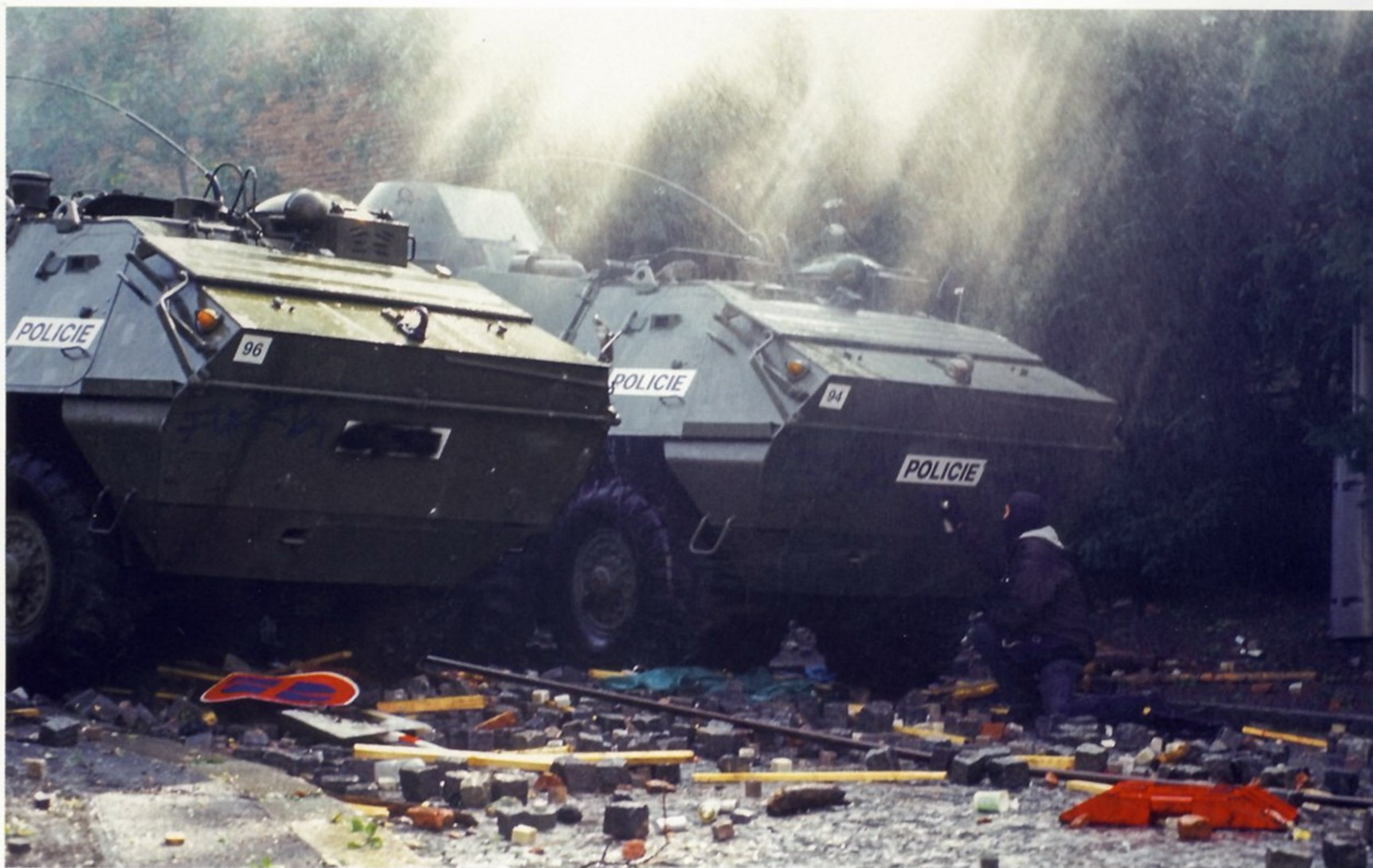
ПРОТИВОСТОЯНИЕ ПОЛИЦИИ И АНТИГЛОБАЛИСТОВ НА УЛИЦАХ ПРАГИ. СИЛЫ ПРАВОПОРЯДКА ИСПОЛЬЗУЮТ БРОНЕАВТОМОБИЛИ

и его заместителя) — юристы, техники, водители, администраторы, специалисты по логистике и т. д.