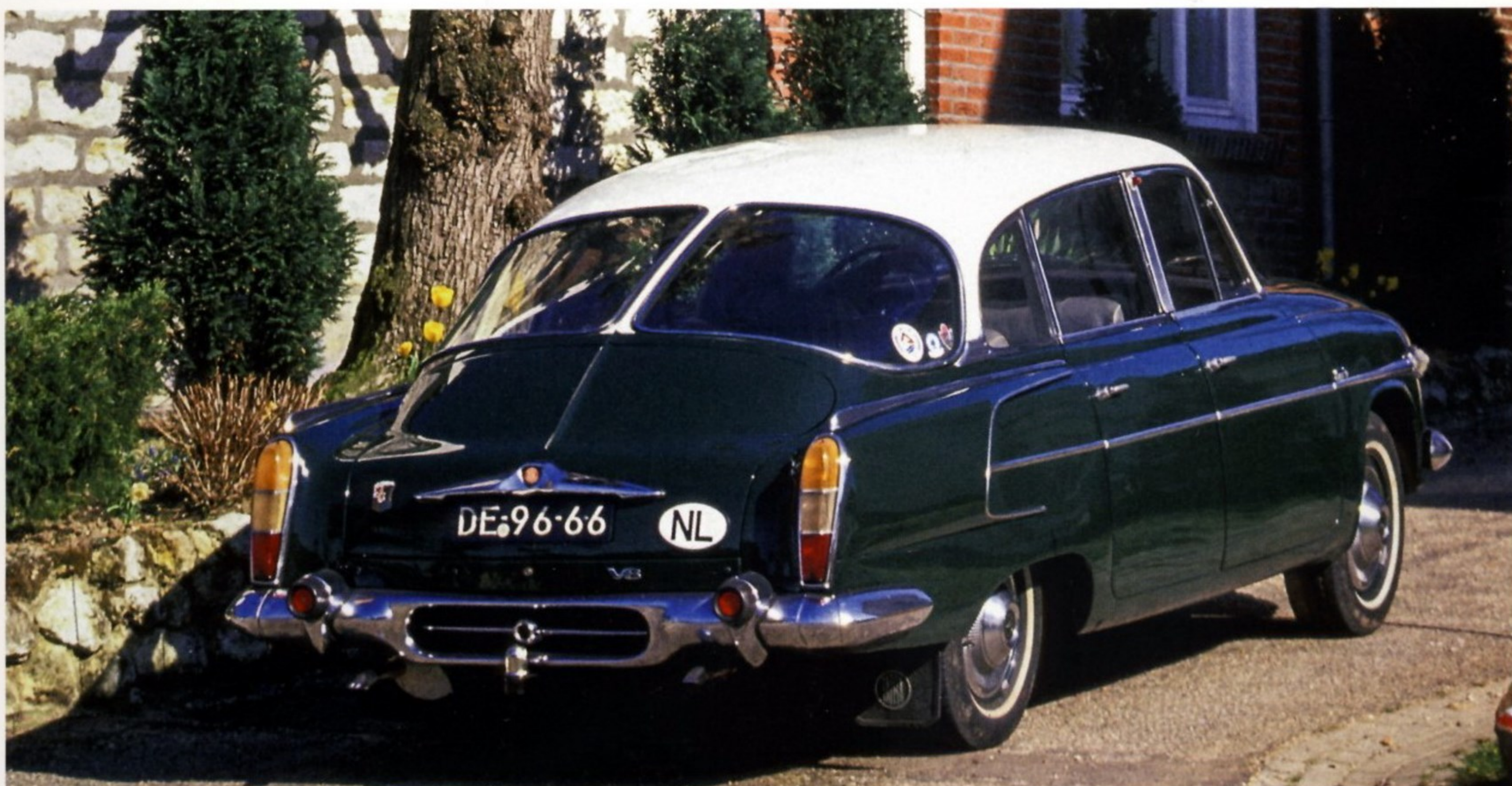
ТАК ВЫГЛЯДЕЛА TATRA 603 1964 МОДЕЛЬНОГО ГОДА

Изначально машина создавалась в качестве служебного автомобиля для высших партийных и политических руководителей самой Чехословакии и государств социалистического содружества.