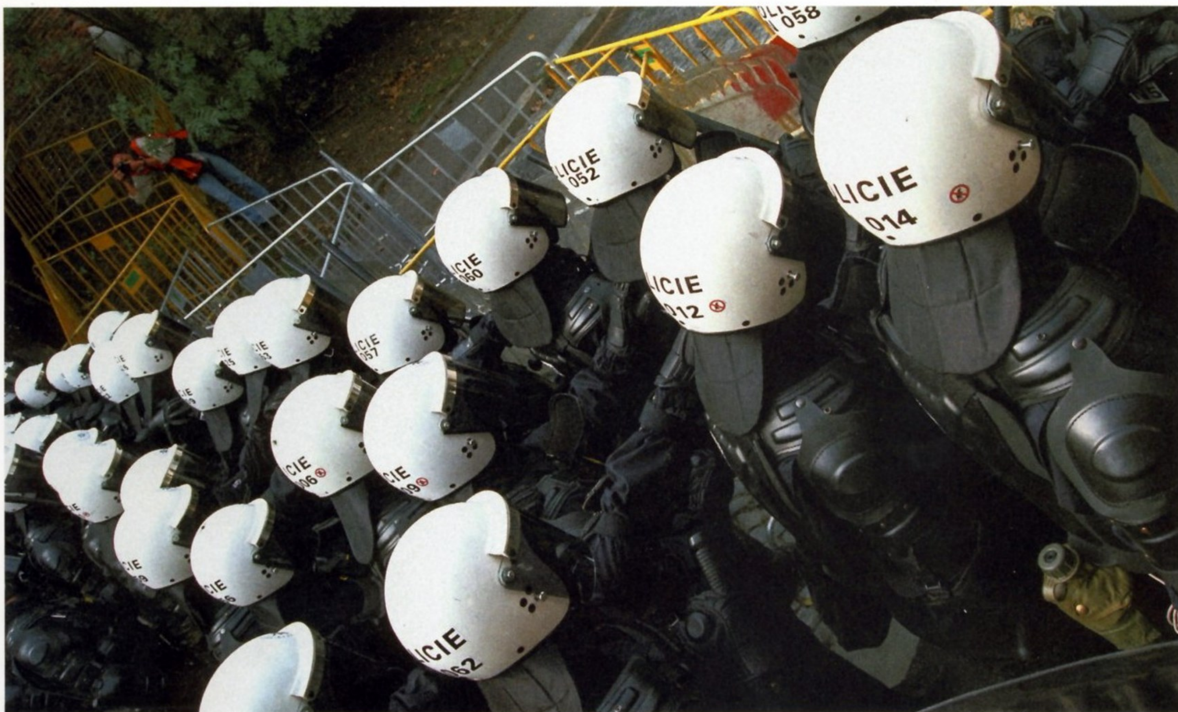
ЧЕШСКАЯ ПОЛИЦИЯ ГОТОВИТСЯ ОТРАЗИТЬ НАТИСК ДЕМОНСТРАНТОВ, ВЫСТУПАЮЩИХ ПРОТИВ ФИНАНСОВОЙ ПОЛИТИКИ ВЛАСТЕЙ (ПРАГА, СЕНТЯБРЬ 2000 ГОДА)

После разделения Чехословакии на два национальных государства в Чешской Республике заметно выросла преступность. В начале 90-х годов на территории страны активизировались не только местные организованные преступные группировки, но и преступные кланы из других стран — Турции, Албании, Болгарии, Польши, Греции, Косова и т. д. Именно поэтому руководство страны было вынуждено создавать специальные подразделения, способные противостоять любым проидам преступников. Одним из таких подразделений стала команда Útvar rychlého nasazení — URNA. Сегодня чешский полицейский спецназ считается одним из лучших в мире. Комплектовалась URNA из наиболее подготовленных сотрудников полиции и представителей армейского спецназа, хотя костяк команды составляли служащие полицейского спецподразделения, основанного еще в ЧССР в середине 80-х годов. Знаком отличия бойцов URNA традиционно являются красные береты.