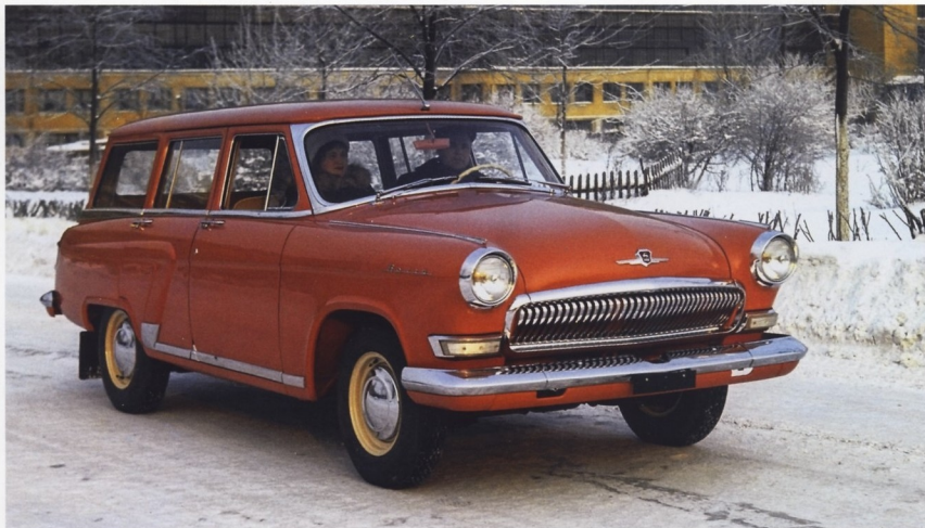
СОВЕТСКИЙ АВТОМОБИЛЬ ГАЗ-22 «ВОЛГА» ПО ДОСТОИНСТВУ ОЦЕНИЛИ НЕ ТОЛЬКО В СССР, НО И ЗА ЕГО ПРЕДЕЛАМИ

тест-драйв, было всего две: первая — отсутствие усилителей руля и тормозов, вторая — «несколько архаичный дизайн».