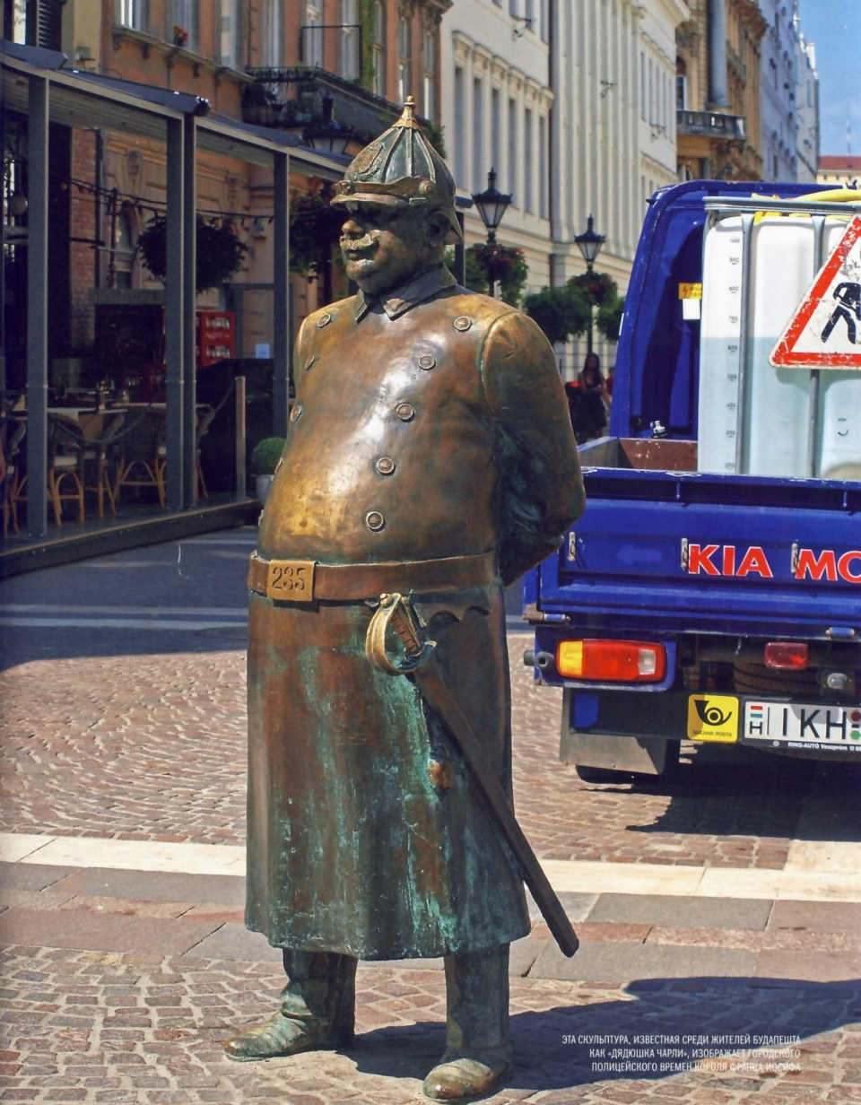
ЭТА СКУЛЬПТУРА, ИЗВЕСТНАЯ СРЕДИ ЖИТЕЛЕЙ БУДАПЕШТА КАК «ДЯДОШКА ЧАРЛИ», ИЗОБРАЖАЕТ ГОРОДСКОГО ПОЛИЦЕЙСКОГО ВРЕМЕН КОРОЛЯ ФРАНКА ИЗОШКА