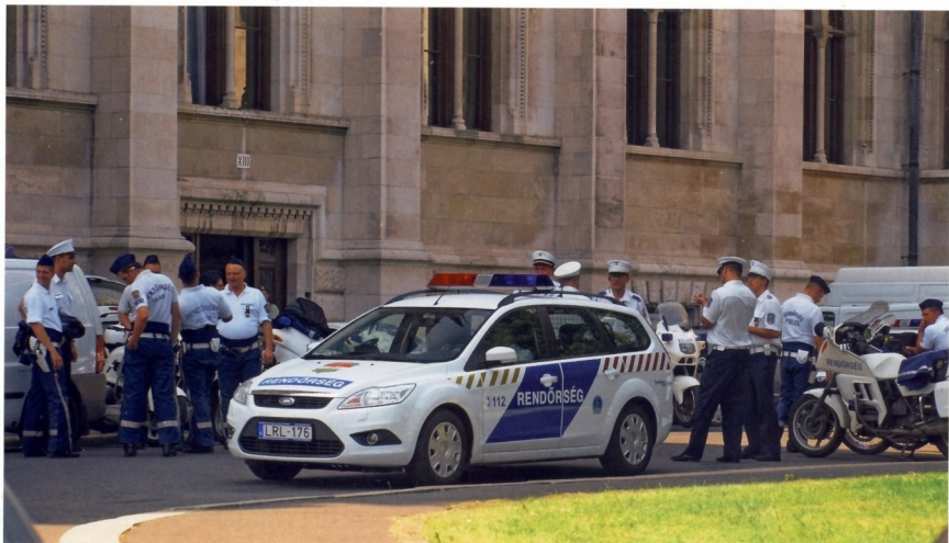
ВЕНГЕРСКИЕ ПОЛИЦЕЙСКИЕ НА ДЕЖУРСТВЕ У СТЕН ПАРЛАМЕНТА

Главные принципы и основные направления работы национальной полиции определены в статье 45 Конституции Венгрии. Согласно этому документу, «основной обязанностью полиции должно быть предотвращение и расследование преступлений, охрана общественной безопасности и сохранение общественного порядка, а также защита государственных границ». Работа органов правопорядка проходит под контролем правительства страны. Главное командование полиции является самостоятельным государственным органом и функционирует в рамках Министерства внутренних дел. Чтобы оградить полицейских от излишней политизации, в венгерской конституции прописано положение о том, что профессиональные сотрудники полиции не могут состоять членами каких-либо политических партий и организаций. Им законодательно запрещено принимать участие в любой политической деятельности. Эти запреты распространяются не только на полицию, но и на другие структуры, обеспечивающие национальную безопасность республики. А вот создавать собственные