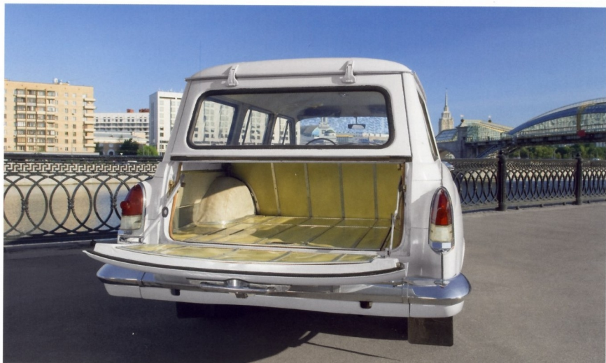
ОТКИНУТАЯ ВНИЗ НИЖНЯЯ СТВОРКА ЗАДНЕЙ ДВЕРИ МОГЛА СЛУЖИТЬ ПЛОЩАДКОЙ ДЛЯ ПЕРЕВОЗКИ ДЛИННОМЕРОВ ИЛИ ПОХОДНЫМ СТОЛИКОМ НА ПРИВАЛЕ

Почти все выпускавшиеся автомобили ГАЗ-22 поставлялись в советские государственные учреждения и службы — в такси, скорую помощь, на автобазы, специализировавшиеся на доставке небольших партий товаров в магазины. Частным лицам такие машины практически не продавались, зато они шли на экспорт — как в социалистические, так и в капиталистические страны.