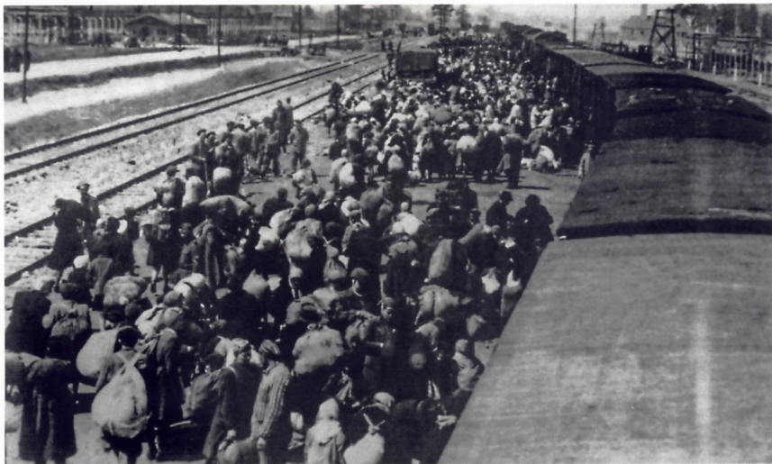
ОТПРАВКА ВЕНГЕРСКИХ ГРАЖДАН ЕВРЕЙСКОГО ПРОИСХОЖДЕНИЯ В КОНЦЕНТРАЦИОННЫЙ ЛАГЕРЬ «АУШВИЦ» В 1944 ГОДУ — ОДНО ИЗ ПРЕСТУПЛЕНИЙ НАЦИСТОВ

После войны стало известно, что из 12 тысяч евреев, отправленных из Кассы в Освенцим под личным контролем Чатари, до конца войны дожили всего 450 человек.