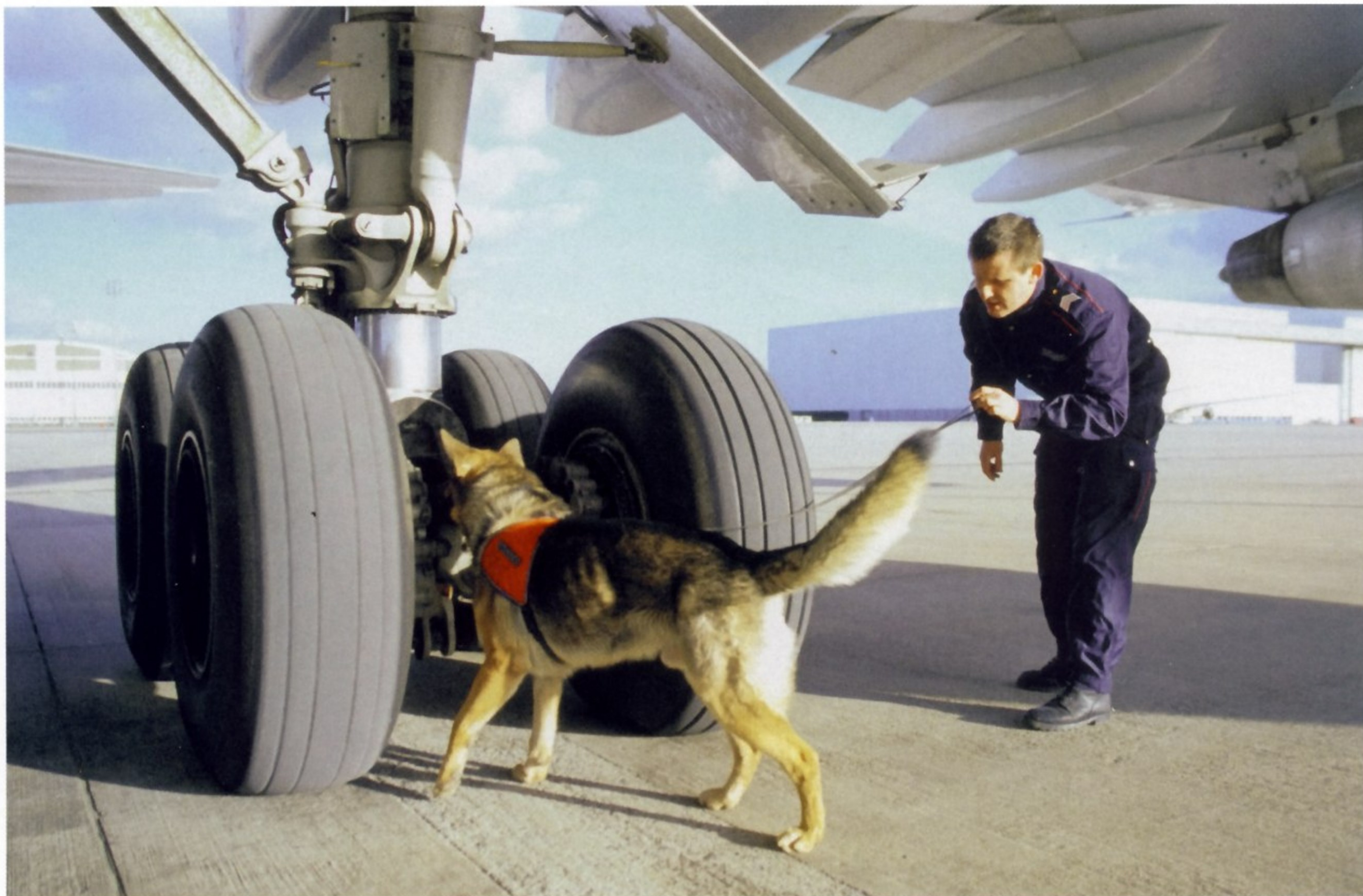
СОБАКИ ПОМОГАЮТ ОБЕСПЕЧИВАТЬ БЕЗОПАСНОСТЬ ПОЛЕТОВ В ПАРИЖСКОМ АЭРОПОРТУ «ШАРЛЬ ДЕ ГОЛЛЬ»

Одним из самых известных специальных подразделений французской полиции является RAID. Аббревиатура RAID состоит из первых букв французских слов recherche, assistance, intervention, dissuasion , что в переводе на русский означает «поиск, содействие, вмешательство, разубеждение». RAID было создано в 1985 году указом министра внутренних дел Франции Пьера Жозе для борьбы с терроризмом. Однако