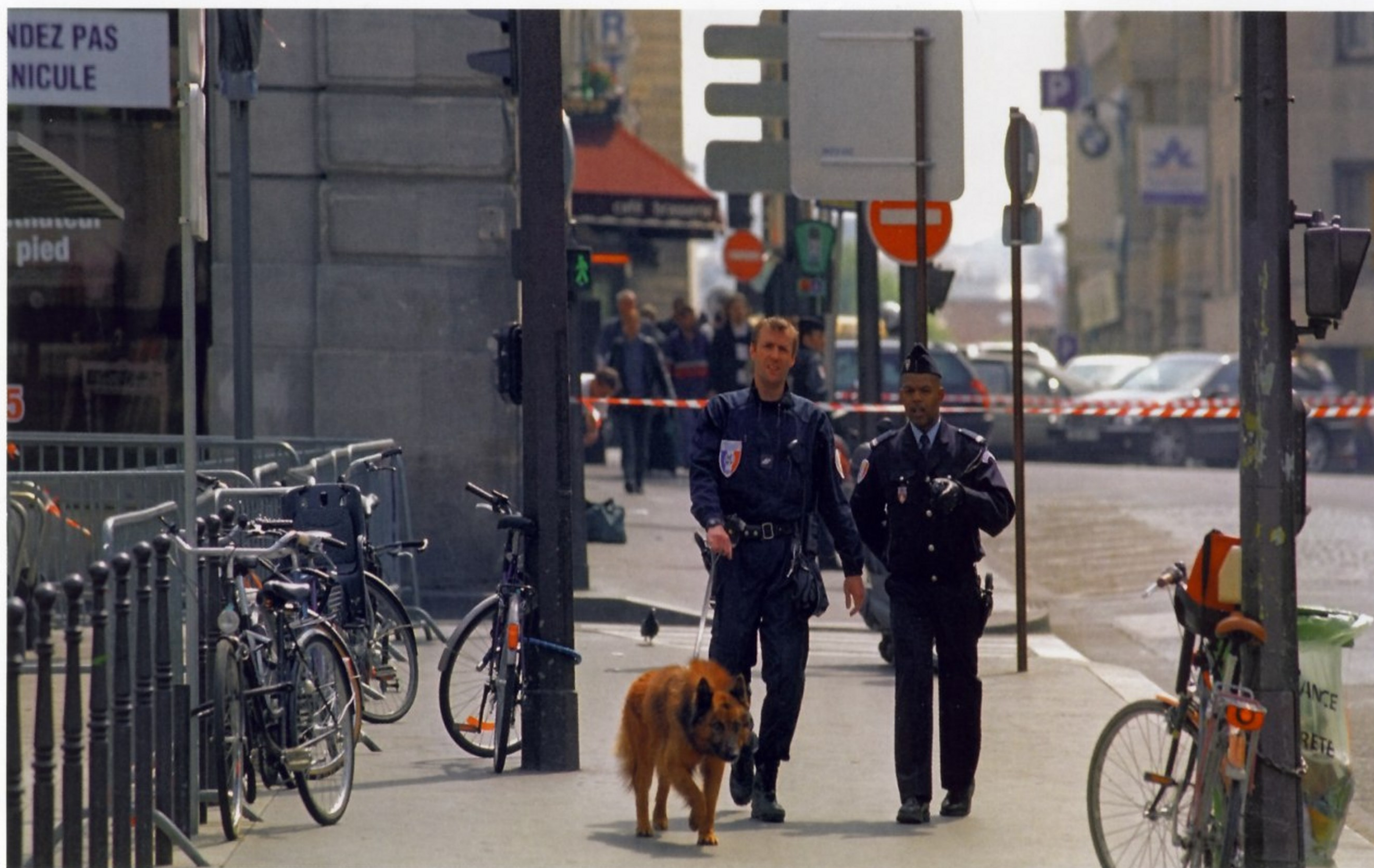
ПАРИЖСКИЕ ПОЛИЦЕЙСКИЕ С СОБАКОЙ ПАТРУЛИРУЮТ УЛИЦЫ В РАЙОНЕ СЕВЕРНОГО ВОКЗАЛА

а потом туда подкладывают мину. Собака должна найти ее при повторном обследовании. Собака-сапер способна различать несколько десятков типов взрывчатки. На тренировках используют как настоящие взрывчатые вещества, так и специально синтезированные для этих целей имитаторы запаха. Четвероногие полицейские должны уметь спокойно работать и при большом скоплении народа, и в боевых условиях. Поэтому в ходе тренировок им приходится ездить на поездах, автомобилях и даже летать на вертолетах и прыгать с парашютом вместе со своими проводниками. Все собаки, работающие в RAID, приучены получать указания не только при непосредственном контакте с проводником, но и на большом расстоянии. К примеру, кинолог может использовать лазерный целеуказатель, чтобы показать, какой именно автомобиль необходимо обследовать в поисках взрывчатки.