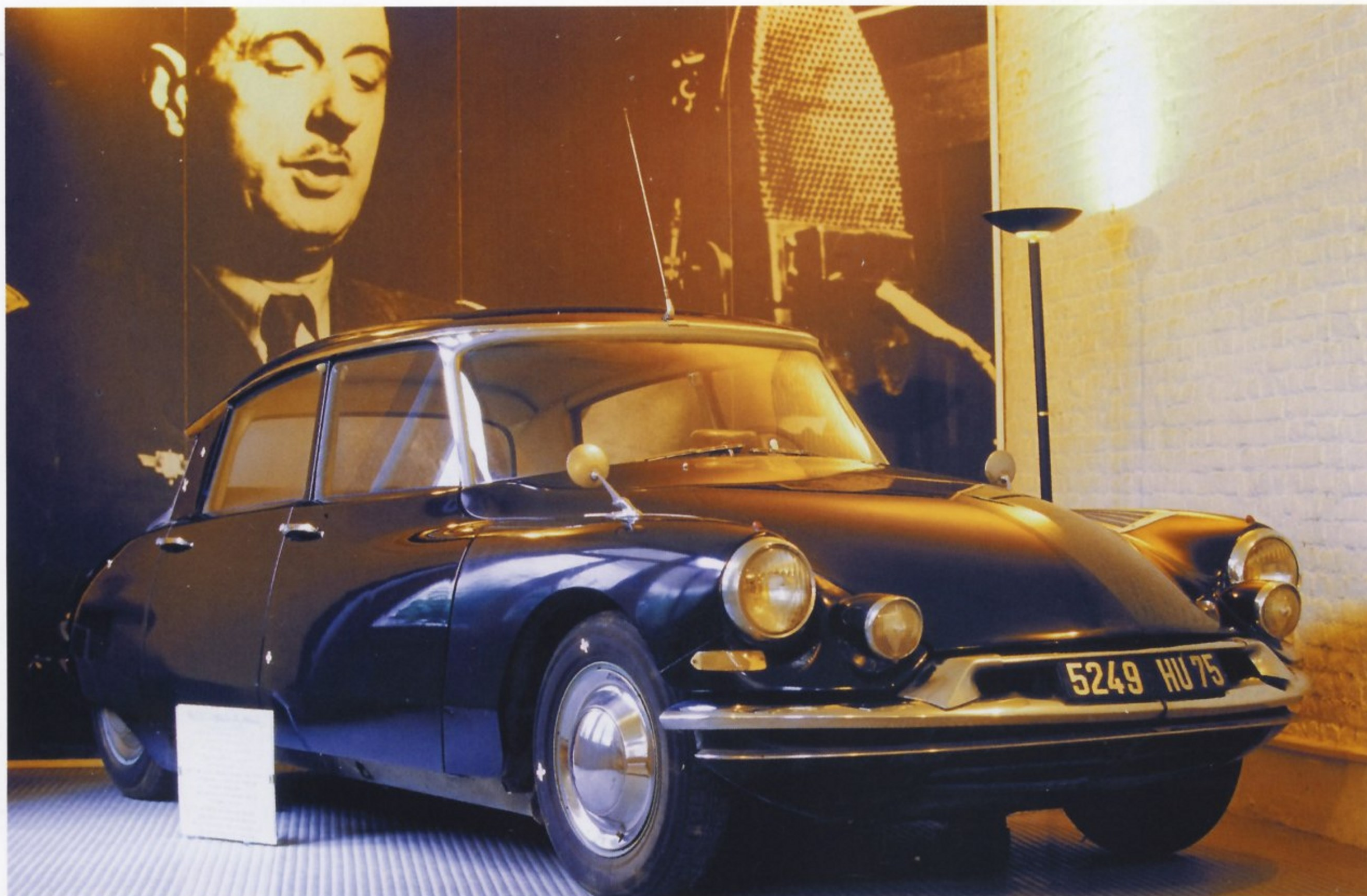
Автомобиль генерала де Голля в экспозиции его дома-музея в Лилле

Модель DS долгое время была официальным автомобилем французского правительства и крупных чиновников. Большим ее поклонником был и президент Франции генерал Шарль де Голль. Благодаря техническому совершенству DS и мастерству водителя, генерал избежал гибели во время одного из покушений: в 1962 году его машина была обстреляна неподалеку от местечка Petit Clamart. В заднее колесо попало несколько пуль, но водитель поднял его, на трех колесах сумел вывести президентский автомобиль из-под обстрела и благополучно доставил де Голля в местный аэропорт, куда тот и направлялся.