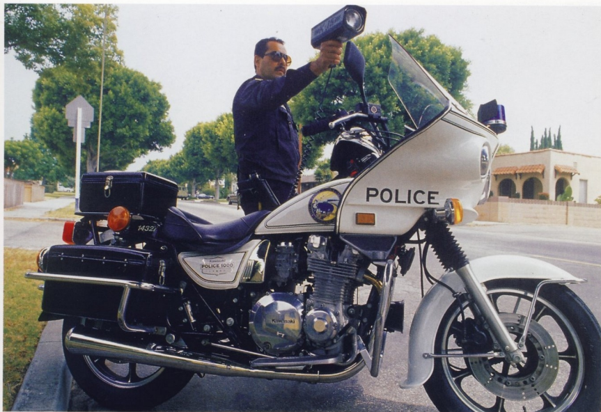
ПОЛИЦЕЙСКИЙ МОТОЦИКЛИСТ ЗАМЕРЯЕТ СКОРОСТЬ АВТОМОБИЛЯ ПРИ ПОМОЩИ РАДАРА (САНТА-МОНИКА, ШТАТ КАЛИФОРНИЯ)

Дорожная полиция Соединенных Штатов Америки имеет свою историю. Было время, когда в целом ряде штатов дорожные патрули подчинялись только местным властям и занимались исключительно обеспечением безопасности на дорогах. Сегодня в обязанности дорожной полиции входит розыск и задержание преступников, оказание помощи в уголовных расследованиях, обеспечение порядка на улицах и т.д. Считается, что американские дорожные полицейские — одни из самых строгих в мире. Полиция имеет право остановить и осмотреть любой подозрительный или нарушивший правила движения автомобиль. Американские патрульные не пользуются жезлами, как их российские коллеги, они применяют громкоговорители, которыми оборудованы полицейские машины.