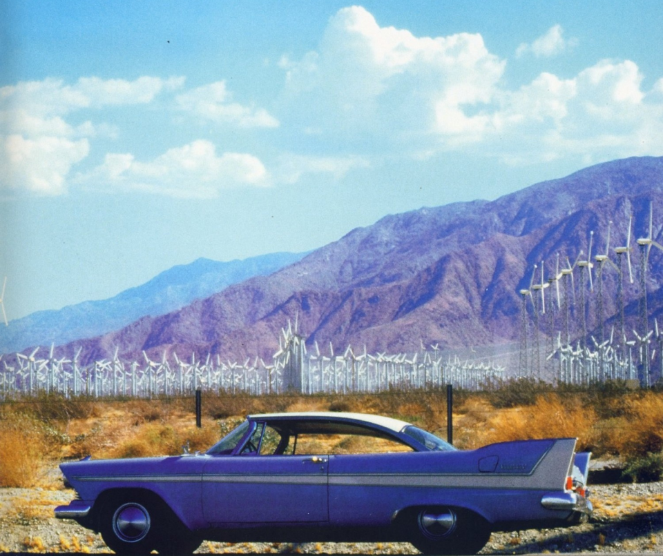
PLYMOUTH BELVEDERE НА ШОССЕ В ПУСТЫНЕ НА ФОНЕ ВЕТРОВОЙ ЭЛЕКТРОСТАНЦИИ (1966 ГОД)