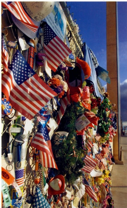
МЕМОРИАЛ В ПАМЯТЬ О ЖЕРТВАХ ТЕРАКТА 19 АПРЕЛЯ 1995 ГОДА У ФЕДЕРАЛЬНОГО ЗДАНИЯ ИМЕНИ АЛЬФРЕДА МАРРА (ОКЛАХОМА-СИТИ)

Сначала взрыв намечали на 11 часов утра, но в итоге решили привести бомбу в действие на два часа раньше. Без пяти девять грузовик подъехал к зданию имени Альфреда Марра. Маквей поджог запал, который по расчетам террориста должен был гореть в течение пяти минут. Этого времени было достаточно, чтобы скрыться с места преступления. Взрыв прогремел в 9.02. Он был такой силы, что уничтожил третью часть здания и оставил после себя воронку шириной 9 м и глубиной 2,5 м. Звук от взрыва был слышен на расстоянии 55 миль от города — сейсмические приборы при этом зафиксировали колебания грунта силой 3,5 балла по шкале Рихтера. Прибывшая к месту происшествия полиция тщательно осмотрела оставшиеся улики. На одной из найденных деталей