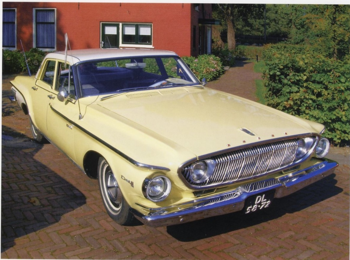
DODGE DART ПЕРВОГО ПОКОЛЕНИЯ. 1962 ГОД

Не забыли и покупателей, мечтающих прокатиться по «хайвею» с ветерком. Специально для них подготовили версии с более мощными двигателями: первый — тоже «шестерка» объемом 3682 \text{ см}^3 (159 л.с.), второй — V-образная 182-сильная «восьмерка». Обе эти модификации могли комплектоваться как механическими, так и автоматическими трансмиссиями. Эти машины были более динамичными: максимальная скорость «шестерки» составляла 151 км/ч, «восьмерки» — 179 км/ч. Для сравнения: максимальная скорость базовой модели была 147 км/ч. Но самой быстрой в линейке была версия 273 V8 BBL с мотором 4483 \text{ см}^3 и мощностью 235 л.с. Согласно паспортным данным, она могла развивать скорость 194 км/ч, а на разгон от 0 до 100 км/ч ей требовалось всего 7,9 сек. Покупатели могли выбирать между автоматической и механической коробкой передач, но в отличие от предыдущих моделей, в качестве опции предлагалась не трех-, а четырехступенчатая коробка-автомат.