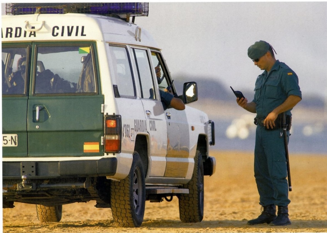
ПАТРУЛЬНЫЙ АВТОМОБИЛЬ ГРАЖДАНСКОЙ ГВАРДИИ

курс подготовки в академии и еще год практикуются в несении службы. Только после этого им присваивают звание «гражданский гвардеец». Гвардейцы традиционно обеспечивают порядок и безопасность на междугородних автомобильных магистралях и оказывают содействие в организации помощи и защиты гражданского населения в случае возникновения каких-либо чрезвычайных ситуаций или катастроф. По сравнению со своими коллегами из Франции, Германии или Италии, испанские силы правопорядка сегодня оснащены заметно скромнее. В гаражах силовых структур не увидишь суперкаров, да и с обычными патрульными машинами бывают проблемы, особенно в последнее время. Дает о себе знать европейский долговой кризис: бюджет полиции постоянно урезается, и в результате в ряде ре-