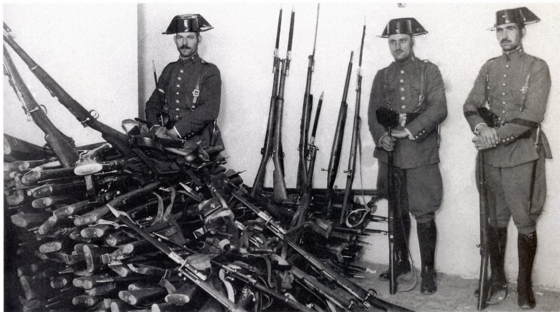
ГВАРДЕЙЦЫ С КОНФИСКОВАННЫМ У ПОВСТАНЦЕВ ОРУЖИЕМ (ИСПАНИЯ, 1930 ГОД)