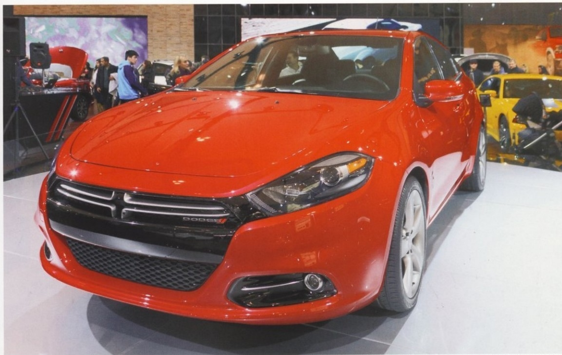
DODGE DART 2013 ГОДА. НАЗВАНИЕ ЗНАМЕНИТОЙ МОДЕЛИ ПРИСВАИВАЮТ ВНОВЬ ВЫПУСКАЕМЫМ АВТОМОБИЛЯМ

Огромная популярность Dodge Dart в Северной Америке была обусловлена еще и тем, что специально подготовленные образцы этого автомобиля не раз успешно выступали в гонках, организованных Национальной гоночной ассоциацией NASCAR (National Association of Stock Car Auto Racing). Кроме того, они часто переделывались и использовались любителями дрег-рейсинга (drag racing), также весьма популярного в США. Все это впоследствии дало основание коллекционерам автомобилей причислить «заряженные» версии Dodge Dart к категории Muscle Car (мускулистых автомобилей).