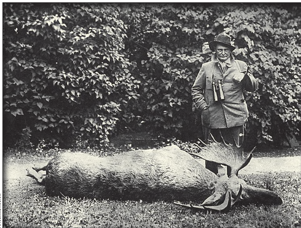
Рейхсмаршал Герман Геринг, завзятый охотник, главный имперский лесник и егерь, над тушей только что заваленного лося

Шум в обоих германских государствах поднялся невероятный. Два дня руководство ГДР раздумывало, как поступить, а 15 января посол Вольфганг Майер, в обязанности которого входил надзор за иностранными корреспондентами, объявил Дитеру Бубу, что ему надлежит в течение сорока восьми часов покинуть территорию ГДР.