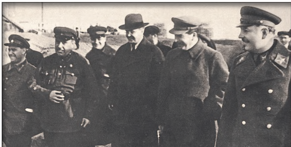
Иосиф Сталин со своими соратниками на строительстве Канала имени Москвы, фото 1937 года

– Река Сестра проходит в трубе под каналом и впадает в Волгу ниже Ивановской плотины, – вновь вступают в разговор Фрадкин и Жданов. – В канале есть донные отверстия, предусмотренные для осушения канала между заградворотами, в ремонтных целях. Если запереть трубу и открыть донные отверстия, вода поднимется, дойдет до Рогачёва и затопит все пространство от Ивановского водохранилища до Яхромы. Но затворы есть только в западной части трубы.