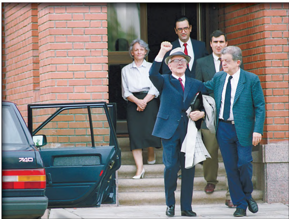
1992 год. Эрих Хонеккер покидает чилийское посольство в Москве, чтобы предстать перед судом в Берлине

Прокуратура Бранденбурга назначила повторное рассмотрение дела. Два бывших охранника Хонеккера Берндт Брюкнер и Адельхард Винклер заявили, что покушение все же имело место. Третий – Ральф Эресманн – считает, что это был несчастный случай.