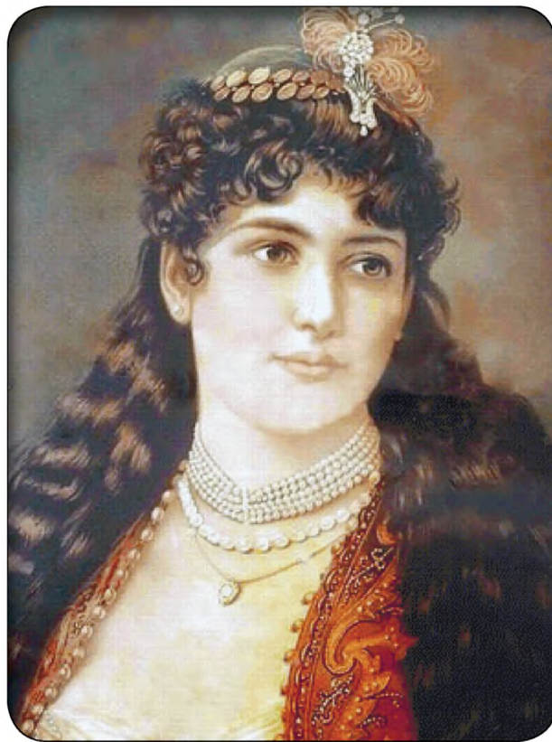
Матрёна Кочубей – крестница и поздняя любовь Ивана Мазепы

А затем и породнились: племянник гетмана, Обидовский, женился на старшей дочери Кочубея, Анне, а младшей Кочубеевне, Матроне, Мазепа был крестным отцом. На Украине, надо заметить, кумовство почитается как духовное родство, крестные родители опекают крестников, пока они не встанут на ноги, а потом кре-