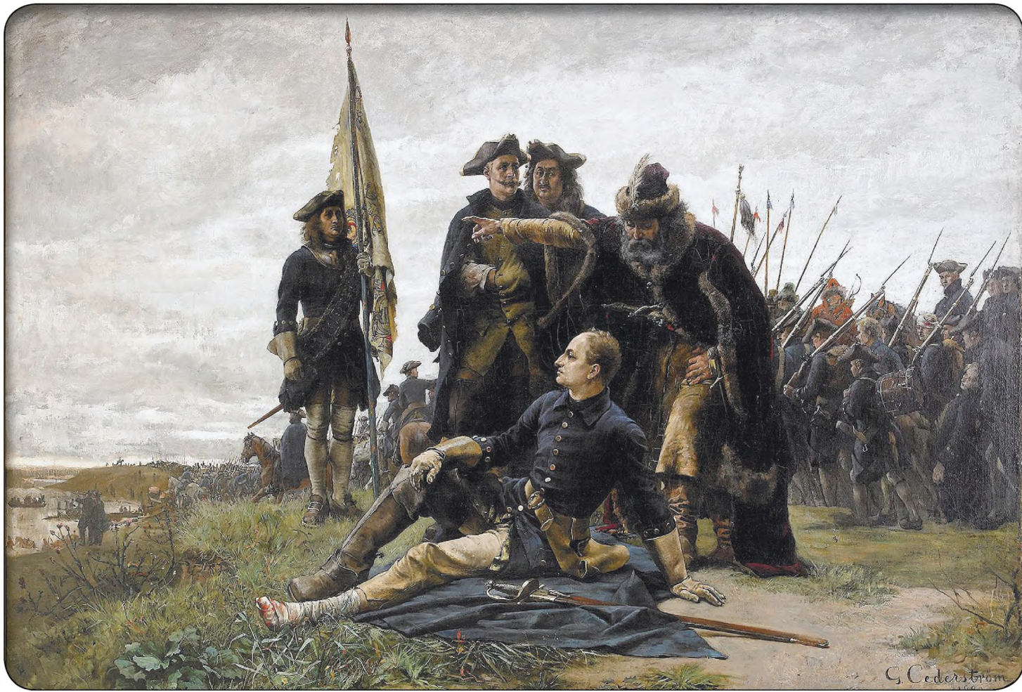
Мазепа и Карл XII перед Днепром. Картина шведского художника Седерштрома

В это время русские войска в битве при деревне Лесная разгромили шведский корпус генерала Левенгаупта. Это была первая и очень важная победа русского оружия в Северной войне. Карл XII отказался от похода прямо на Москву и повернул на Украину, рассчитывая в том числе на помощь Мазепы. Теперь гетман уже не мог только выжидать, надо было выступить на той или другой стороне. Однако непосредственно подтолкнули Мазепу к действиям обстоятельства, можно сказать, эмоционального порядка.