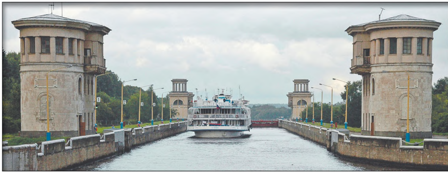
Современный вид Канала имени Москвы. Туристический теплоход проходит шлюз

Редакция благодарит за помощь в подготовке материала ФГУП «Канал им. Москвы»