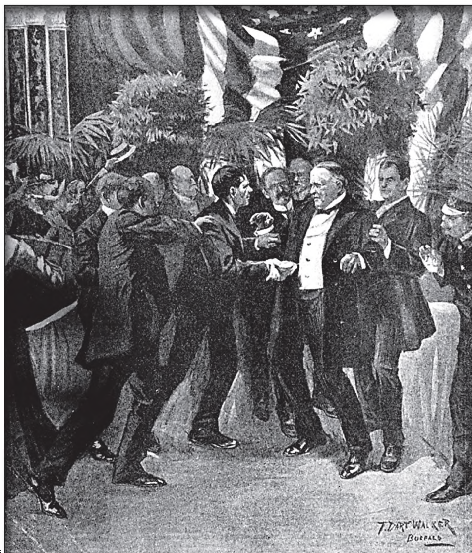
Президент Уильям Маккинли был ранен анархистом Леоном Чолгошем (слева) на Панамериканской выставке (вверху) и умер от заражения крови. Слева вверху: Маккинли (слева) с Теодором Рузвельтом