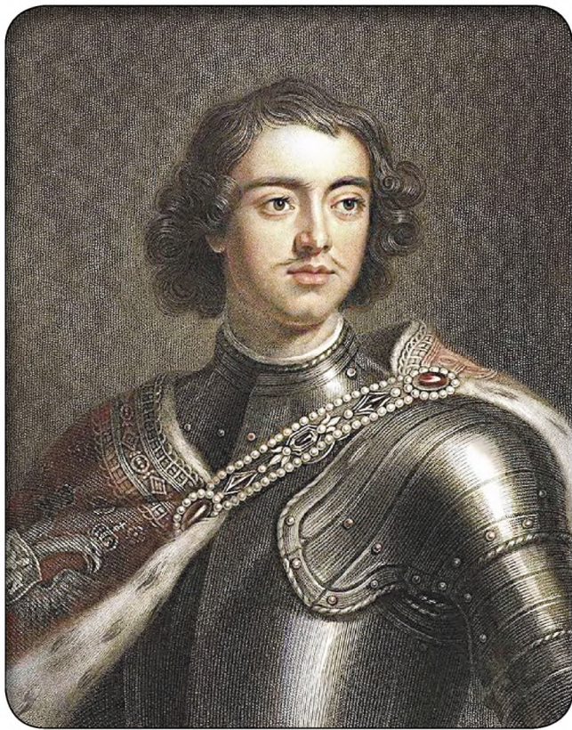
Мазепа впервые встретился с Петром в 1689 году и с самого начала был обласкан молодым русским царем

Власть атаманов сменилась властью гетманов. Немецкое слово Hauptmann – начальник – превратилось в польское hetman – в значении «командующий войском», а на Украине гетман стал верховным правителем всех украинцев, военных и гражданских. Во второй половине XVII века всю Левобережную Украину начали неофициально именовать Гетманщиной. В мягком южном произношении – Гетьманщина. И в этом «геть», что значит «долей», таилась одна из главных опасностей для власти: старшина, полковники и значные козаки (то есть назначенные или выбранные на командные должности) всегда могли сместить гетмана. Так действовал и Мазепа со старшиною, погубив Самойловича.