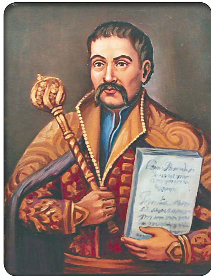
Иван Мазепа и Филипп Орлик – «гетман в изгнании», признавший вечный протекторат Швеции над Украиной

25 октября Мазепа переправился через Десну, с ним было не больше пяти тысяч козаков. Только здесь они узнали, что гетман ведет их не против шведов, а против русских. Мазепа обратился к своему отряду с речью. Козаки выслушали речь гетмана молча. В тот же день Мазепа был уже в расположении шведских войск. Измена свершилась. Через три дня Мазепа привел свой отряд к присяге. По разным сведениям, под его началом оказалось от нескольких сот до полутора тысяч козаков.