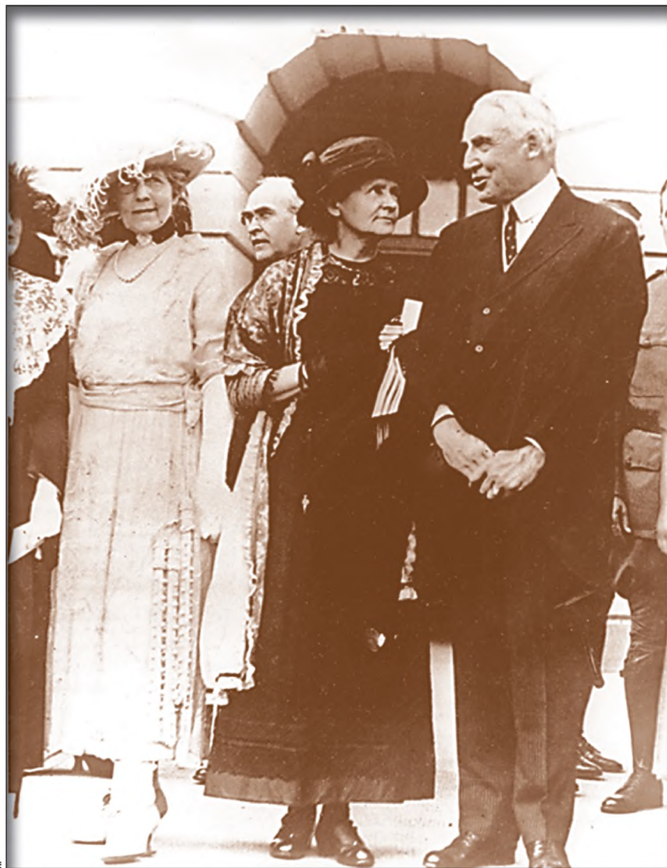
Уоррен Гардинг (на снимке: рядом с Мари Кюри) скоропостижно скончался в 1923 году при невыясненных обстоятельствах