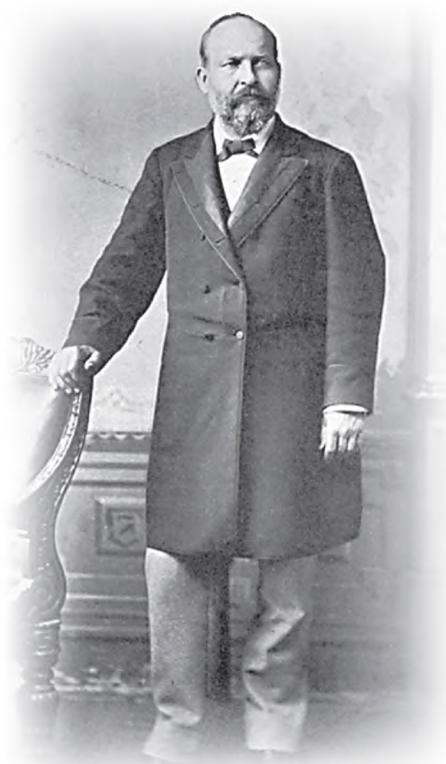
Джеймс Гарфилд, избранный в 1880 году, четыре месяца спустя получил пулевое ранение в спину и после мучений скончался

9 апреля 1865 года война закончилась капитуляцией армии конфедератов. Президенту суждено было прожить после победы считанные дни. Однажды он лег спать очень поздно. В Белом доме царила мертвая тишина, однако спустя некоторое время президенту послышался неясный шум, похожий на приглушенные рыдания множества людей. Линкольн встал с постели и спустился по лестнице на первый этаж. Он обходил комнату за комнатой, но нигде не было ни единой живой души. Наконец, он вошел в Восточную гостиную, посреди которой стоял катафалк, а на нем гроб. Вокруг катафалка несли караул солдаты, а помещение было заполнено скорбящими людьми. Лицо покойника было покрыто траурным крепом. «Кто умер в Белом доме?» – спросил Линкольн у солдата. «Президент, – ответил тот. – Он убит при покушении». Линкольн проснулся и больше в ту ночь уже не смог уснуть.