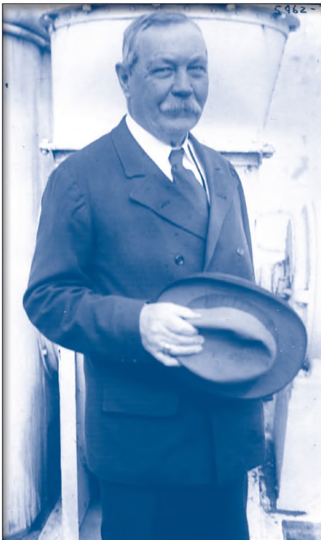
Создатель незабвенного сыщика Шерлока Холмса писатель Артур Конан Дойл

Да, опасения Льюиса Стивенсона («Странная история доктора Джекила и мистера Хайда»), Герберта Уэллса («Остров доктора Моро»), Артура Конан Дойла и Михаила Булгакова начинают