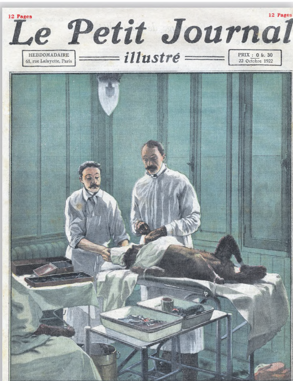
L'Homme qui rend la Jeunesse

Cette photographie unique a été prise dans un laboratoire dépendant du Collège de France. Elle montre le docteur Voronof et son assistant expérimentant sur un chien âgé la méthode de rajeunissement qui fit la célébrité du savant praticien.