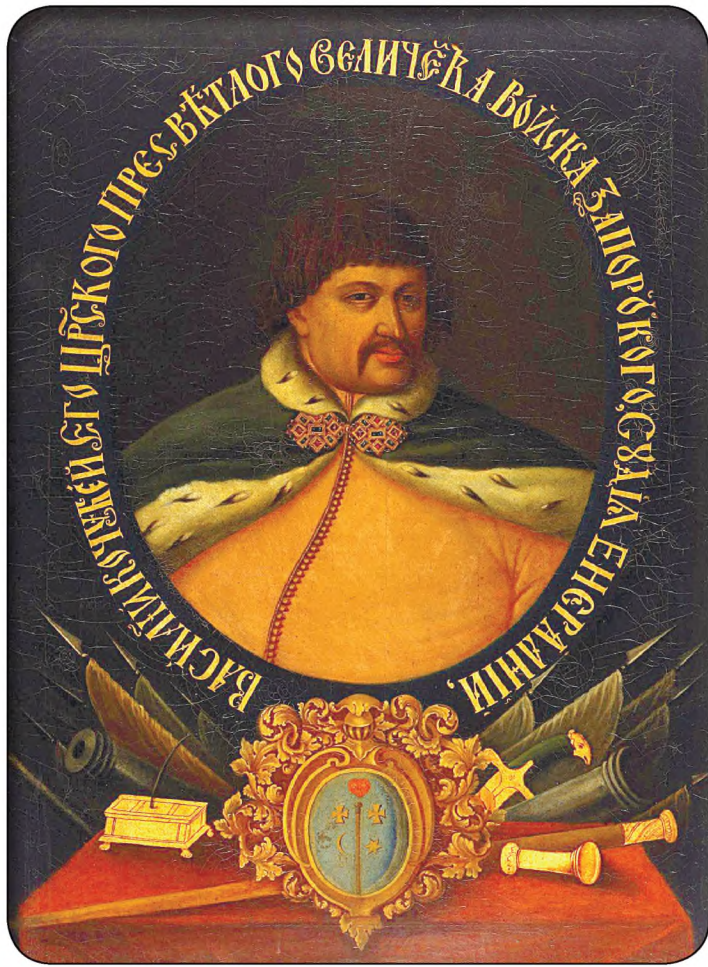
Василий Кочубей, поплатившийся жизнью за то, что хотел предупредить измену Мазепы

Дознание вели канцлер Головкин и вице-канцлер Шафиров. Они не были «заплетных дел мастерами». Сначала сняли показания с Кочубея. Генеральный судья Украины выдвинул против Мазепы обвинения по 33 пунктам. Все они были правдой, а если в чем-то и не соответствовали действительности,