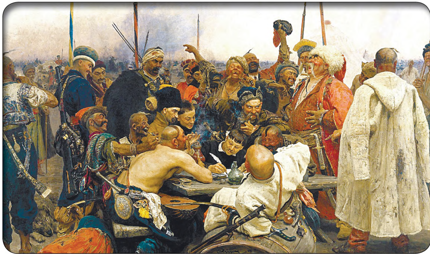
Запорожские козаки с картины Ильи Репина

На этот раз Мазепа дал маху – начал расхваливать подвиги Голицына: «Никогда еще не бывало бусурманам такого страха, как от князя Василия Васильевича, ближнего боярина!» Гостей с Украины тоже наградили, поселили в Посольском дворе – и забыли на месяц. Только тут гости узнали о грандиозных событиях. Правительница Софья Алексеевна по требованию Петра выдала ему стрельцов-заговорщиков, а ее фаворит Голицын приехал к Петру сам, но не был допущен к царю, а сразу отправлен в ссылку. Мазепа ждал беды и на свою голову, старшины за его спиной уже сговаривались, кого избрать новым гетманом... Наконец, Петр позвал посольство в Лавру, и 10 сентября 1689 года Мазепа предстал перед молодым Петром.