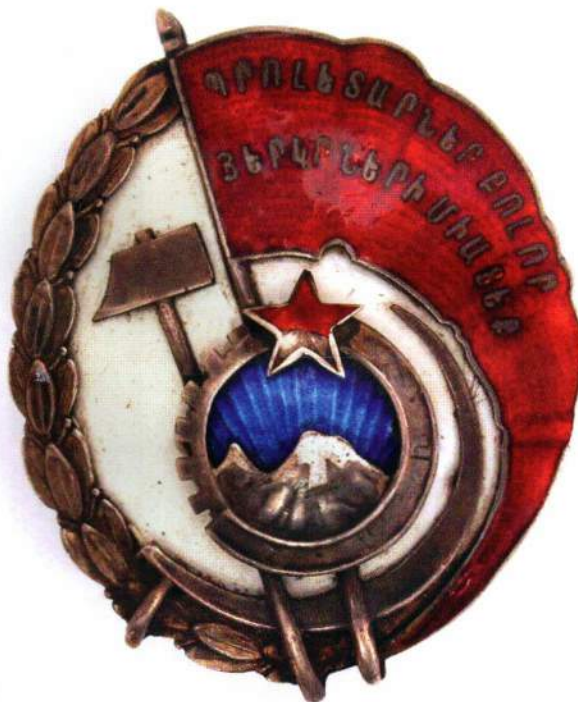
▲ Утвержденный эскиз ордена в настоящее время хранится в Государственном Историческом музее

Как видно из этой цитаты, Президиум ЦИК ограничился лишь учреждением награды, не уделяв сколько-нибудь внимания технической стороне вопроса – собственно изготовлению ордена.