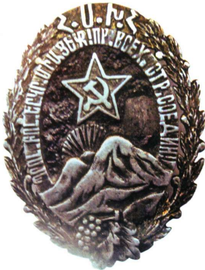
▲ Единственный сохранившийся до нашего времени «пробный» вариант ордена Трудового Красного Знамени Армении