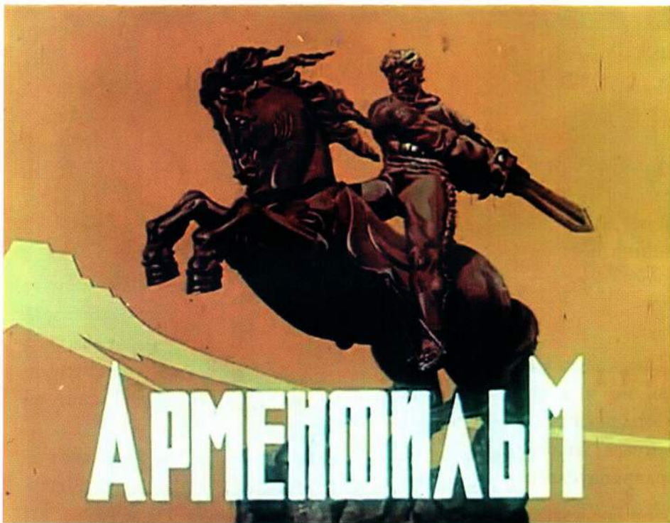
◀ Будущий «Арменфильм», а тогда еще кинофабрика «Арменкино» получил свой орден Трудового Красного Знамени в 1931 году

Несмотря на довольно большое количество врученных орденов, до наших дней дошли всего несколько экземпляров, что, как и в случае с многими другими республиканскими наградами, делает их фалеристической редкостью.