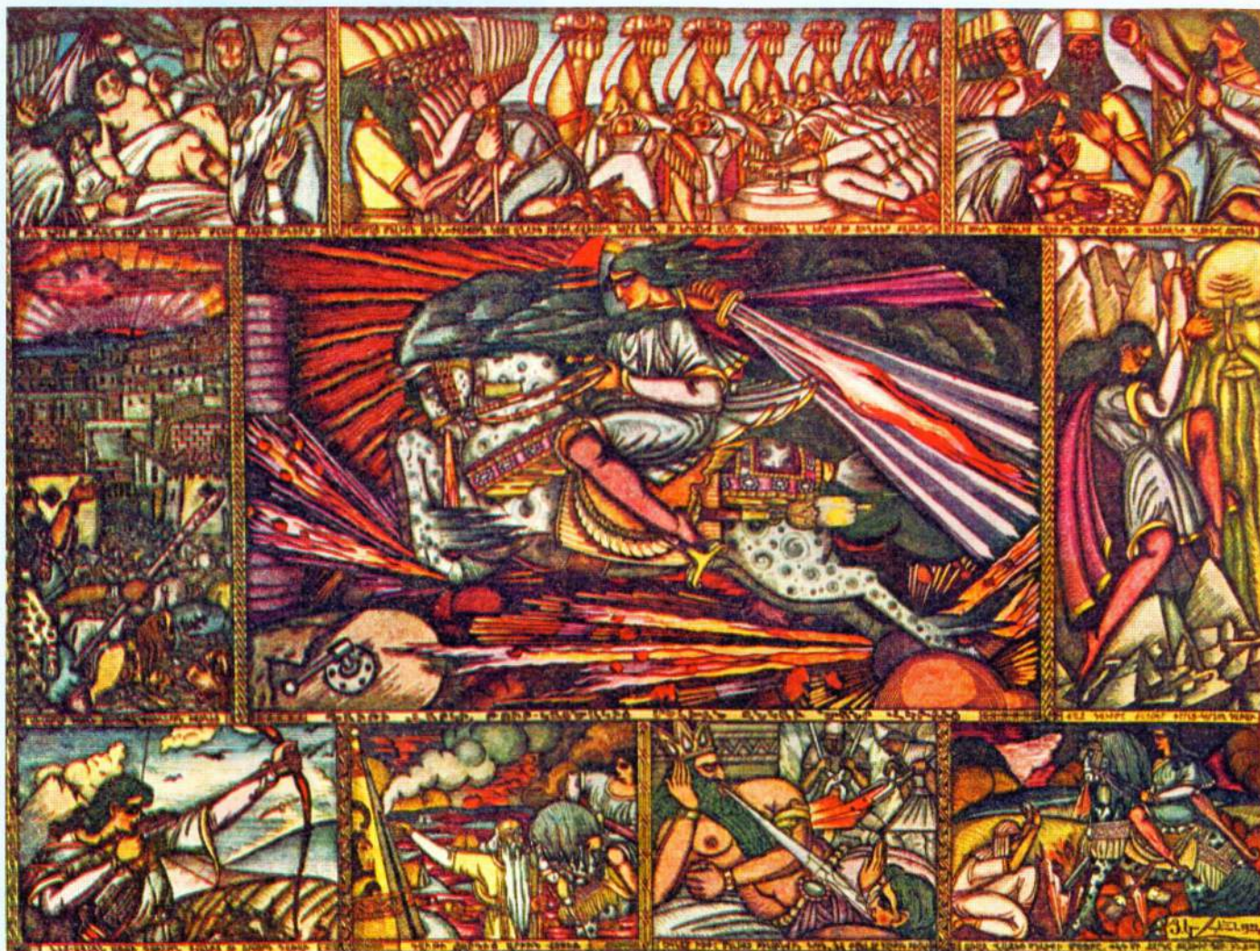
▲ Одна из последних работ мастера - полотно «Давид Сасунский», - была создана им в 1958 году, за год до смерти

В 1973 году в Ереване был открыт Дом-музей Коджояна, где экспонируются живописные и графические произведения художника. Здесь представлена одна из последних работ мастера - полотно «Давид Сасунский», созданное в 1958 году.