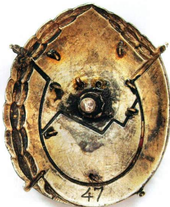
▲ Второй вариант ордена Трудового Красного Знамени Армении (лицевая и обратная стороны)