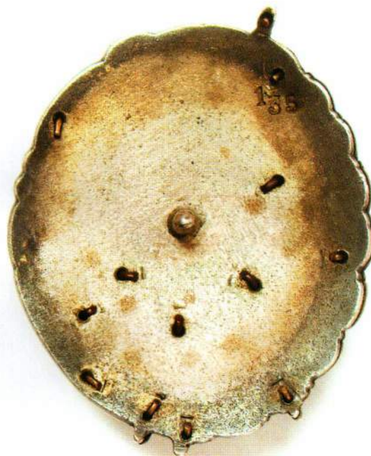
▲ Орден Мариэтты Шагинян (лицевая и оборотная стороны) – из коллекции ГИМ