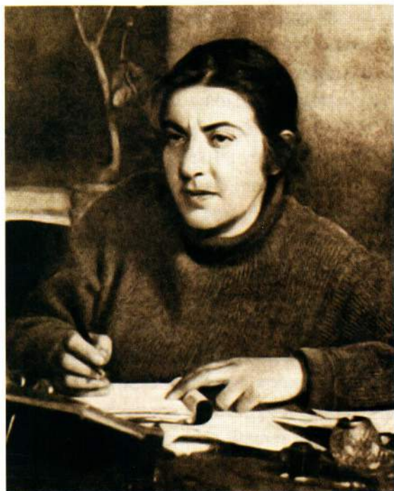
▲ Знаменитая армянская советская писательница Мариэтта Сергеевна Шагинян

Следующие награждения произошли только в 1928 г., а вот после 1931 г. они стали происходить значительно чаще. До 1933 г. были награждены более ста человек.