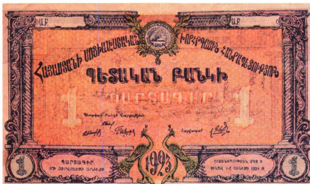
▲ Денежный знак Армении образца 1923 года. Автор эскиза С.А. Оганесян

Вместе с орденом Трудового Красного Знамени ССРА образца 1935 г. вручалась орденская