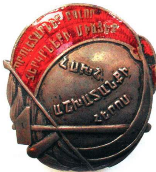
▲ Знак «Герой труда Армении»

В связи с учреждением в 1939 г. звания Героя Социалистического Труда СССР, потребность в собственных знаках героя у республики Армения отпала, и награждения были прекращены.