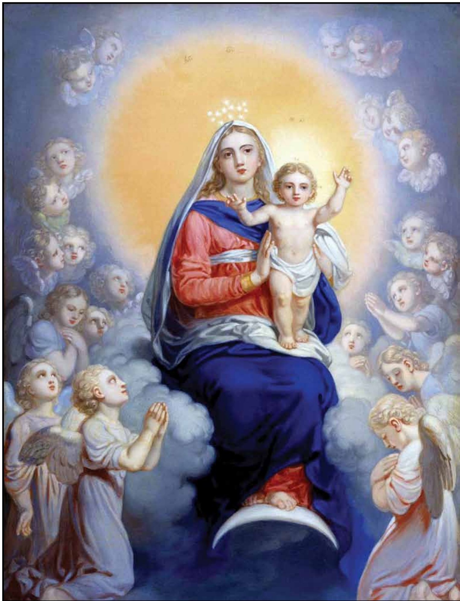
Богоматерь с младенцем в сонме ангелов. 1823