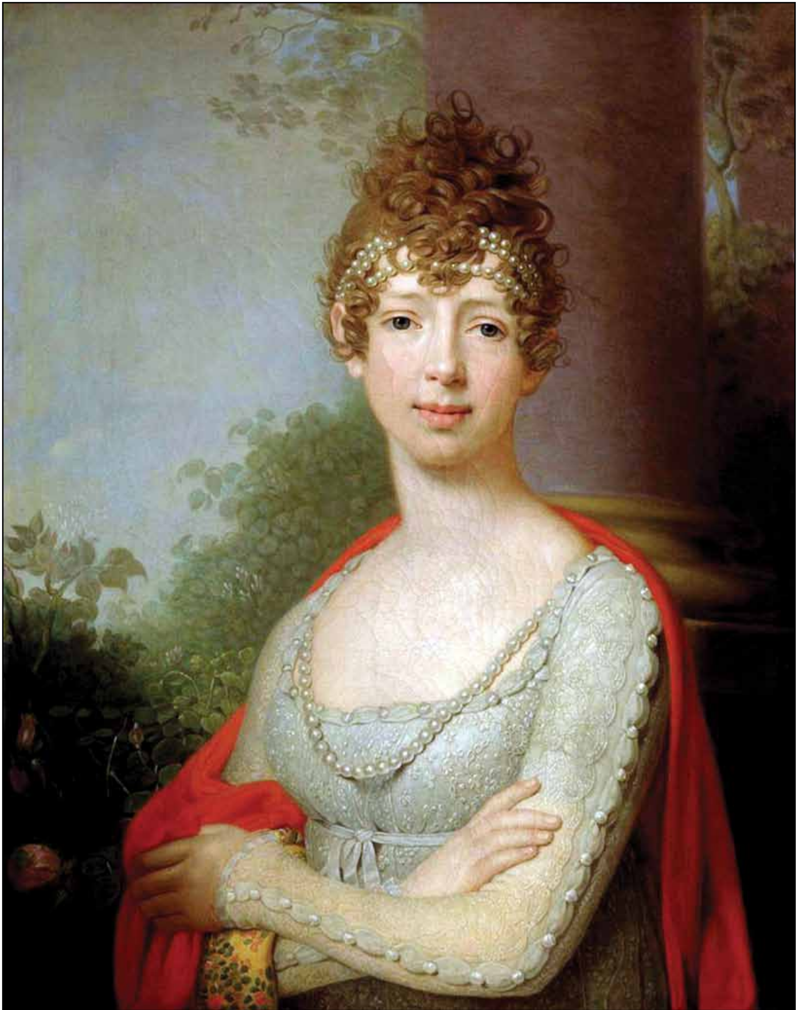
Портрет великой княжны Марии Павловны. 1804