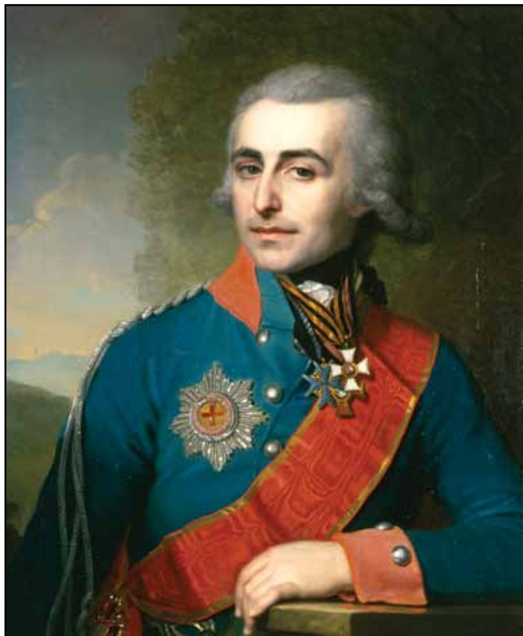
Портрет генерал-адъютанта графа П. А. Толстого. 1799

Лицо императора в произведении Боровиковского имеет поразительное сходство с портретом Щукина, созданным ранее, но в ознаменование того же события. В наше время для изображения особ, не имеющих возможности долго позировать художнику, используются фотографии; канонический портрет Щукина выполнял функции такой «фотографии». Встречается утверждение, что Боровиковский просто списал лицо Павла с полотна коллеги. Между тем при безусловном сходстве изображений императора на обеих картинах именно в чертах лица проявляется почерк Владимира Лукича, его острый взгляд психолога (о других деталях портрета как раз можно говорить, что они скопированы с портрета Щукина): здесь гораздо ярче подчеркнут властно-надменный, пренебрежительный характер Павла, что проявляется и во взгляде, и в поджатых губах. (Черты лица на холсте Щукина создают гораздо более «позитивный»