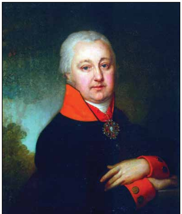
Портрет Н. М. Яковлева. 1802

Князь изображен во всем парадном блеске: в мантии кавалера ордена св. Андрея Первозванного, надетой поверх далматика ордена св. Иоанна Иерусалимского, с орденами св. Андрея Первозванного (цепь на груди и звезда на мантии) и св. Иоанна Иерусалимского (крест). Известный искусствовед А. В. Вдовин пишет о гравюрном портрете А. Б. Куракина, исполненном Ф. Вендрамини по картине Боровиковского: «Пространство портрета с простодушной для нас хитростью демонстрирует реализованные внутренние интенции модели, где пейзажный фон явлен и как мечтание, и как воспоминание, и как деяние; так или иначе, нам представляют идеальную сущность, так как «внутренне себе являемся». Это кульминация риторики в портретописии, рожденная уверенностью в том, что выразить словом, перевести в речь можно все, что угодно, равно как и обратно» 14 .