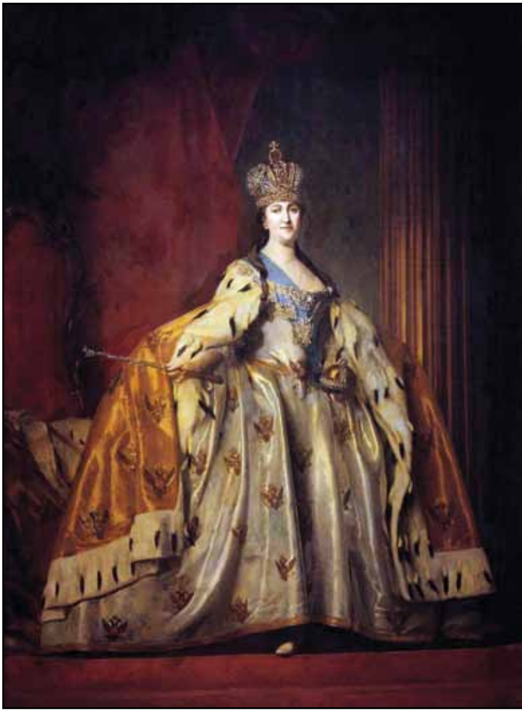
Портрет Екатерины II, русской императрицы. 1779

Три замечательных мастера второй половины XVIII века – Федор Степанович Рокотов, Дмитрий Григорьевич Левицкий и Владимир Лукич Боровиковский – представляют вершину русского портретного искусства той эпохи.