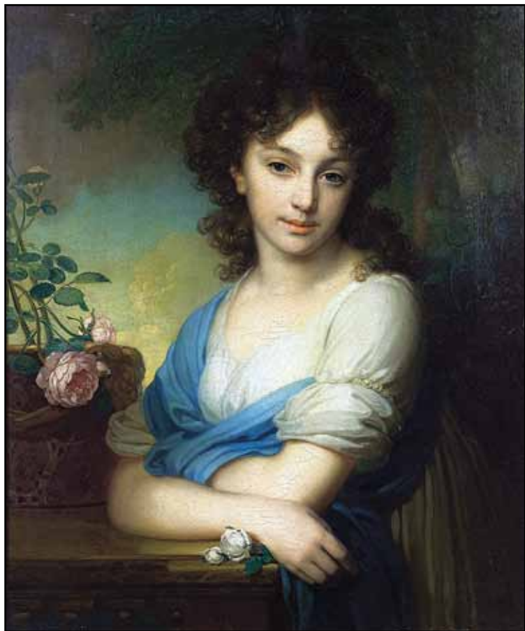
Портрет княжны Е. А. Нарышкиной. 1799

черты. Они порой однотипно построены композиционно: как правило, близки по размеру; фигуры представлены по пояс 11 , у них схожий изгиб тела, часто похожие позы; непременно присутствует некий – всегда условный – пейзаж. Это говорит об определенном выработанном художником шаблоне. Одна из причин его появления, вероятно, в том, что у мастера не всегда было достаточно сеансов с моделью. Но, с другой стороны, полотна Боровиковского не вызывают ощущения его упорной борьбы с таким положением дел, кажется, живописца вполне устраивают те рамки – в прямом и переносном смысле, – в которых он творит. При этом в лучших своих произведениях ему удается ярко и самобытно передать внутренний мир модели, характер персонажа.