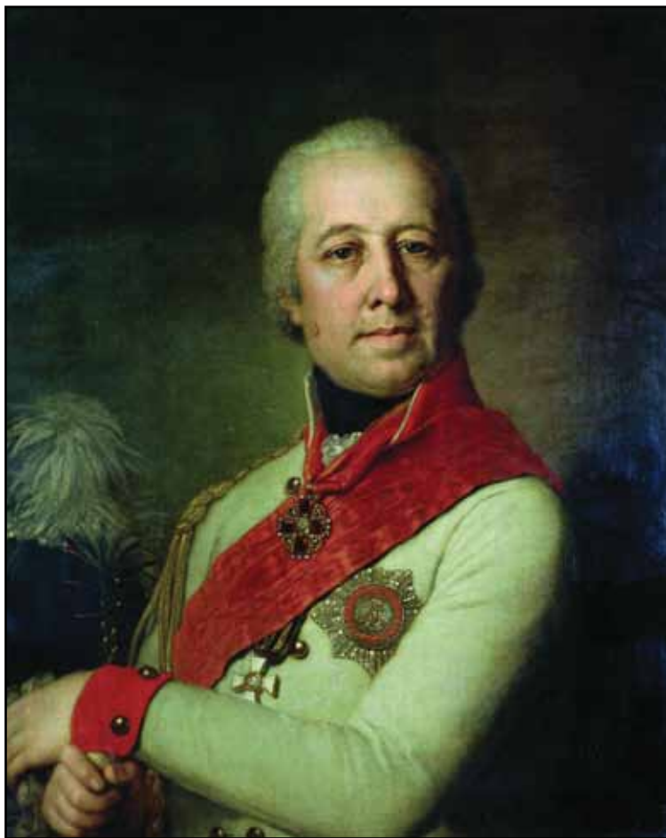
Портрет И. П. Дунина. 1801