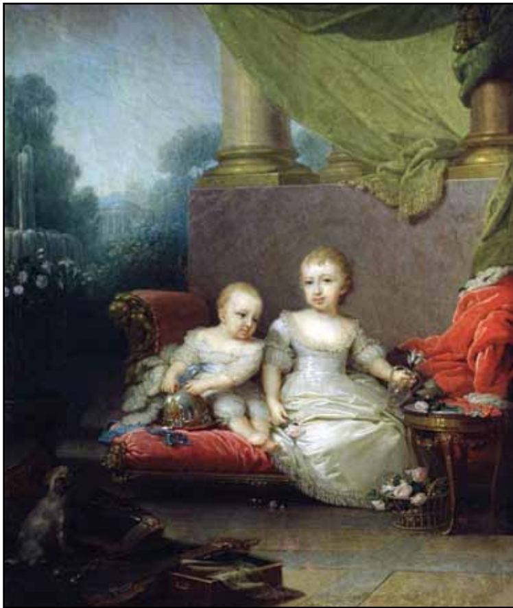
Портрет великой княжны Анны Павловны и великого князя Николая Павловича, детей императора Павла I. 1797

задумчивости и размышлениях: просто ли это красивая зарисовка природы или здесь заключен некий смысл?