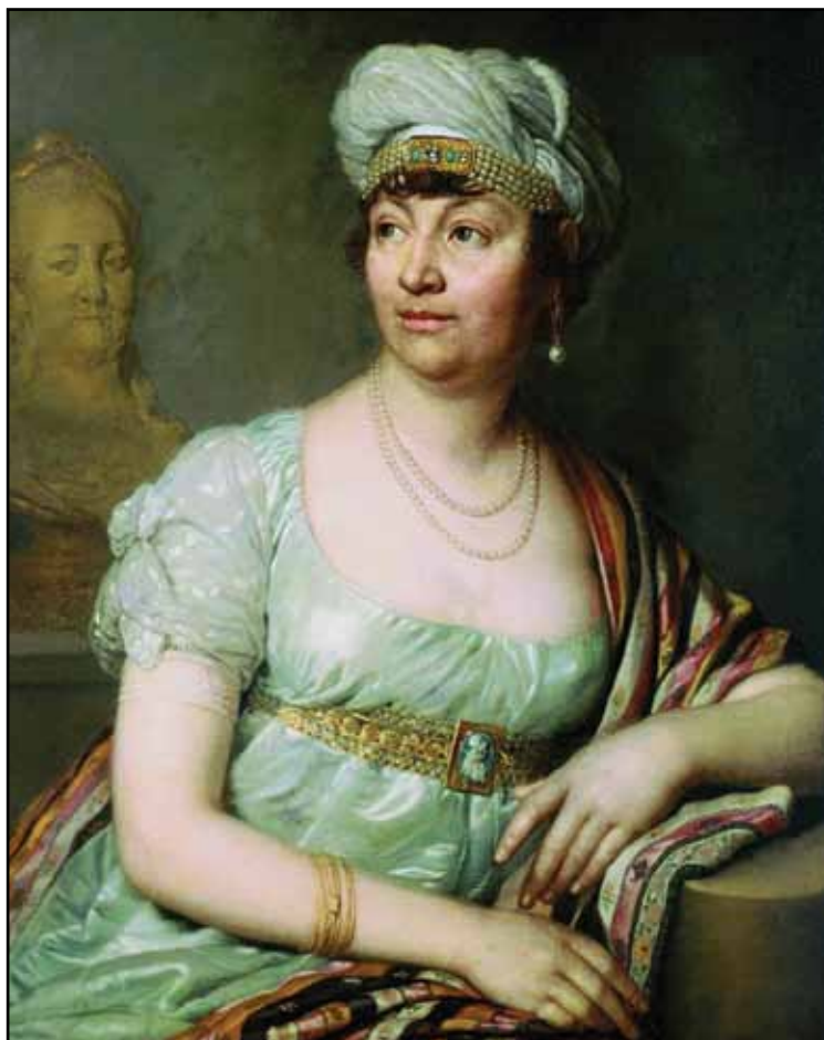
Портрет французской писательницы Жермены де Сталь (?). 1812

Композиционно картина написана просто: в качестве фона выступает гладкая стена; на заднем плане, за плечом модели, виднеется бюст Екатерины II. Одновременно в портрете использованы тонкие цветовые соотношения: сочетание редкостных зеленовато-голубых тонов платья и тюрбана с золотисто-коричневым оттенком пояса и шали.