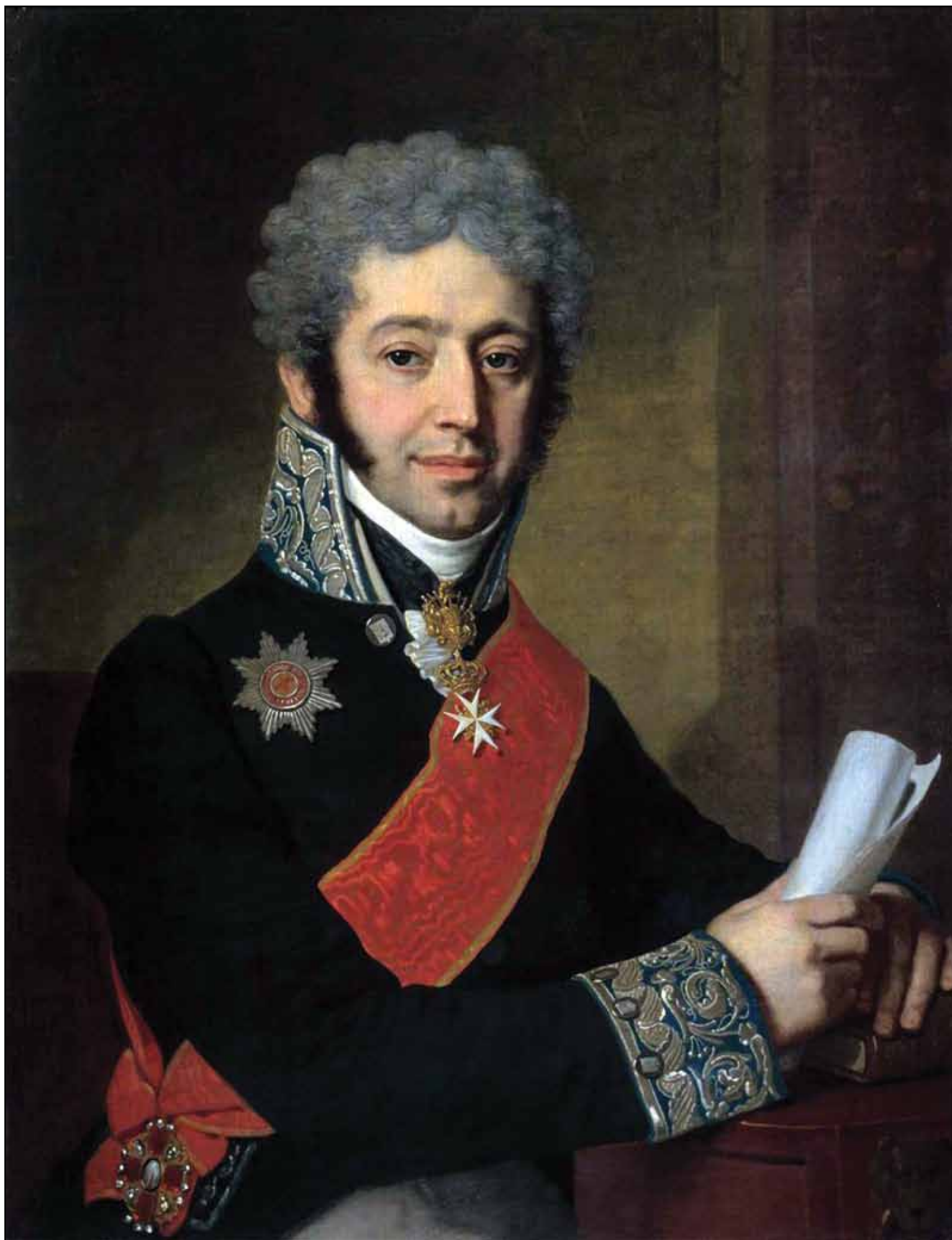
Портрет князя А. А. Долгорукого. 1811