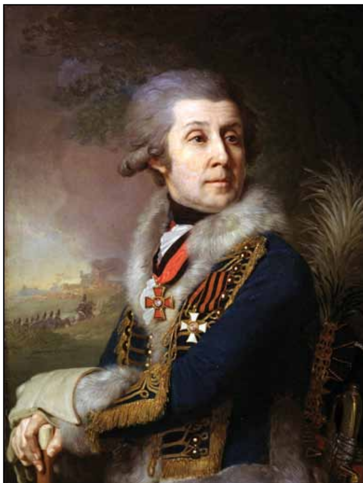
Портрет генерал-майора Ф. А. Боровского. 1799