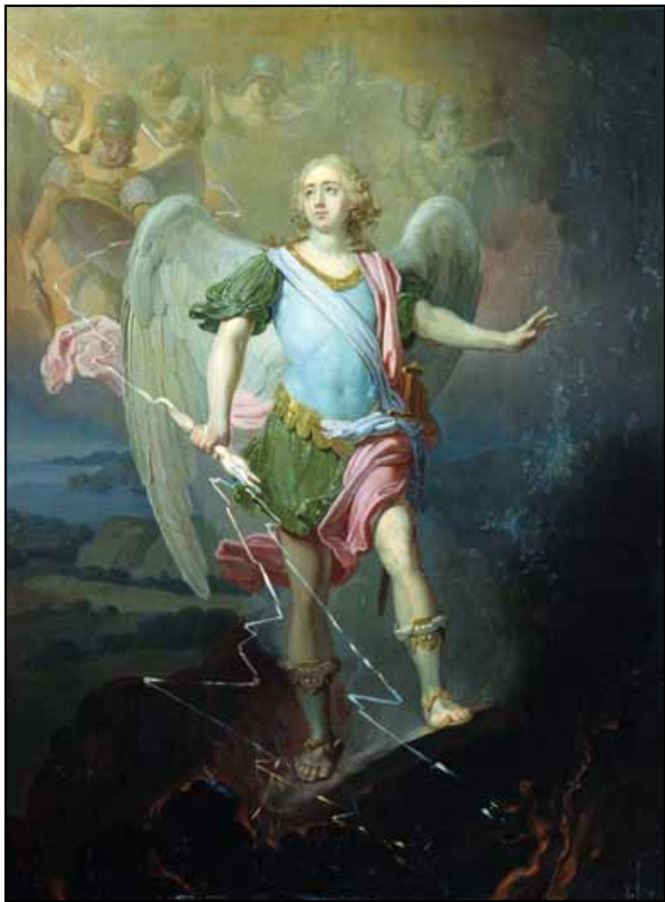
Архангел Михаил. 1810–1820

Интересно суждение А. Н. Бенуа о полотне (он видел его задолго до появления версии А. В. Бакушинского и, следовательно, не знал, что это может быть мадам де Сталь): «Лишь изредка Боровиковский отказывался от шаблонов, им самим выработанных, и более внимательно вглядывался в натуру. Тогда ему удавалось создавать вещи, которые положительно должны быть отнесены к лучшим вообще в истории искусства портретам. Таков изумительный портрет неизвестной придворной дамы в собрании Цветкова, довольно перзрелой особы в прическе à l'antique, в платье александровского времени, из серебряного глазета, с чрезвычайно оголенным великолепием груди и красивых еще рук; восточное смуглое лицо ее дышит страстью, и она с каким-то важным и смелым вызовом, полуулыбаясь, устремила свой взор в сторону» 19 .