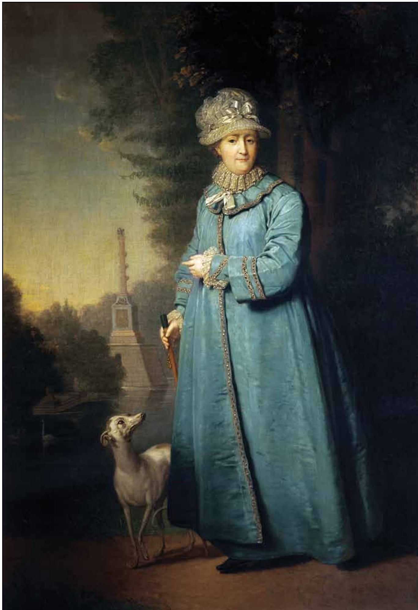
Портрет Екатерины II на прогулке в Царскосельском парке. 1794