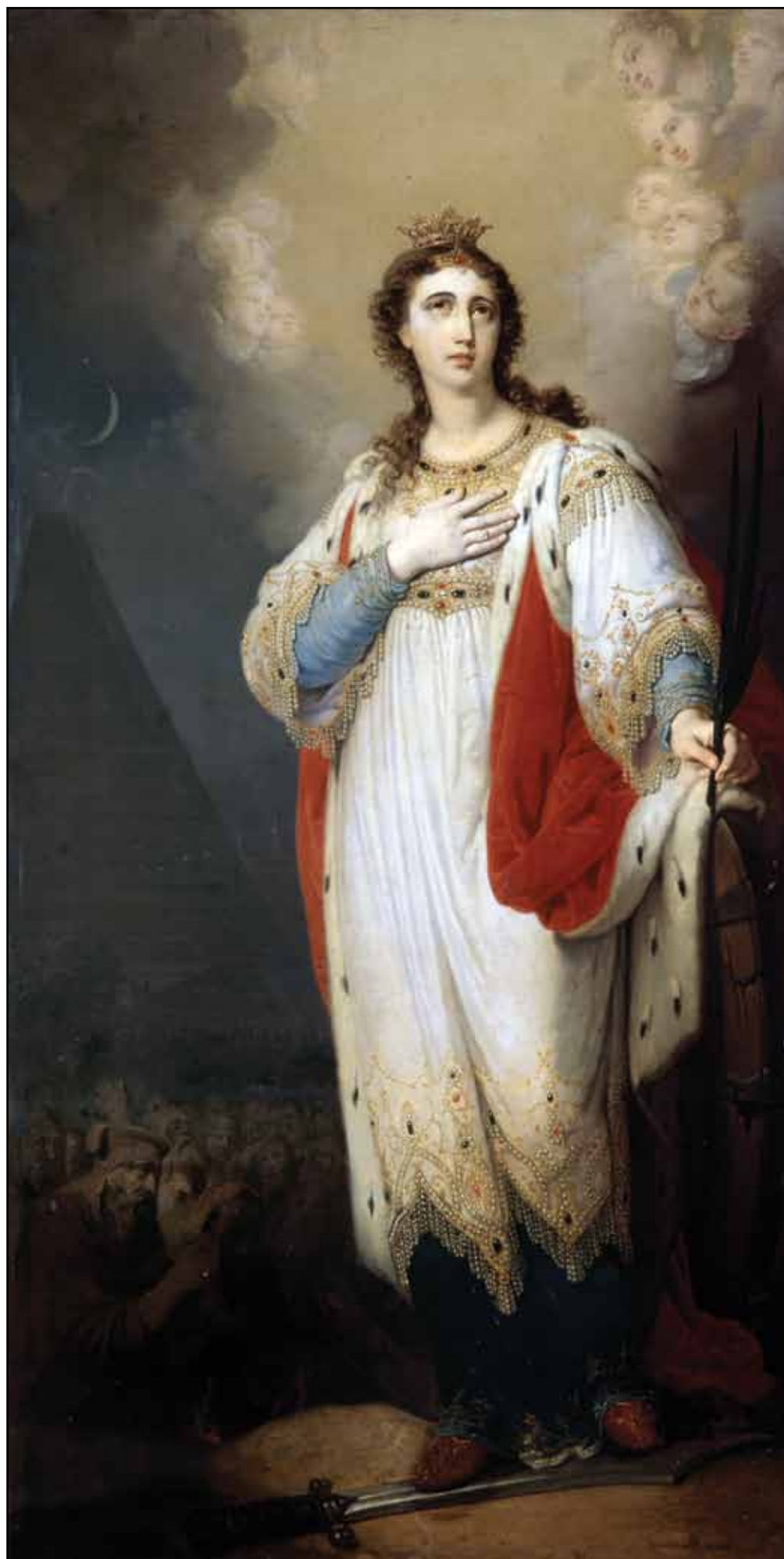
Святая Екатерина. 1820-е