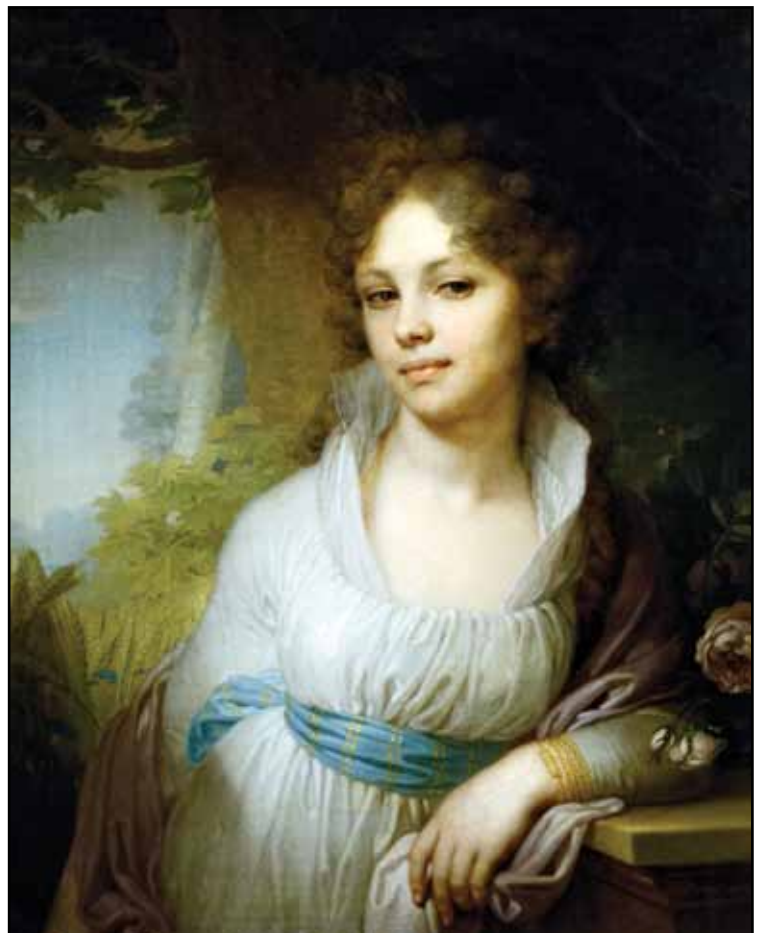
Портрет М. II. Лопухиной. 1797

Целый ряд исторических свидетельств заставляет думать, что князь Г. А. Потёмкин-Таврический и императрица Екатерина II были тайно венчаны. 13 июля 1775 в Москве Екатерина Алексеевна, которой было тогда сорок шесть лет, родила дочь. Ее назвали Елизаветой, по отчеству – Григорьевна, по фамилии – Тёмкина (у незаконнорожденных детей удаляли первый слог фамилии). Обстоятельства появления на свет девочки были известны лишь узкому кругу приближенных. Роды прошли в Москве, в Пречистенском дворце, во время празднования Кючук-Кайнарджийского мира, которым закончилась первая Русско-турецкая война 9 . Дальнейшая судьба княжны могла бы стать сюжетом романа. Повзрослев, Елизавета Григорьевна оказалась особой расточительной и прославилась тем, что проматывала свое огромное состояние.