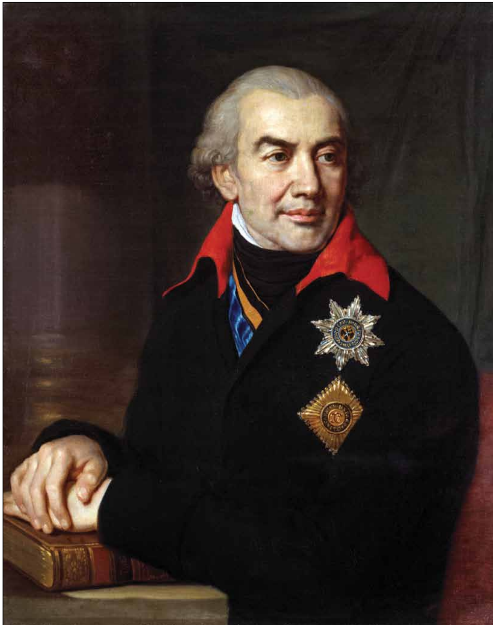
Портрет князя Г. С. Волконского. 1806