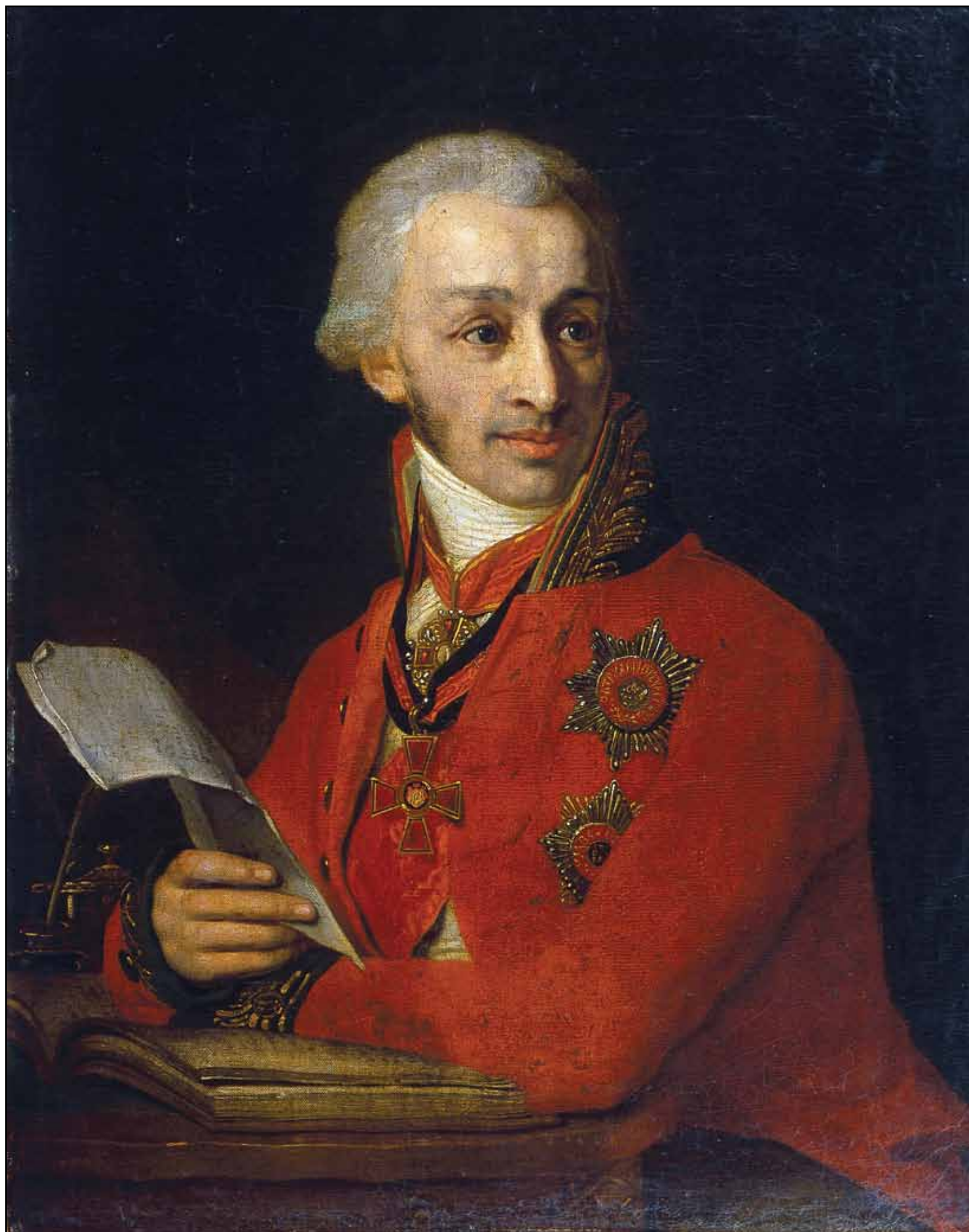
Портрет государственного казначея Ф. А. Голубцова. Около 1806