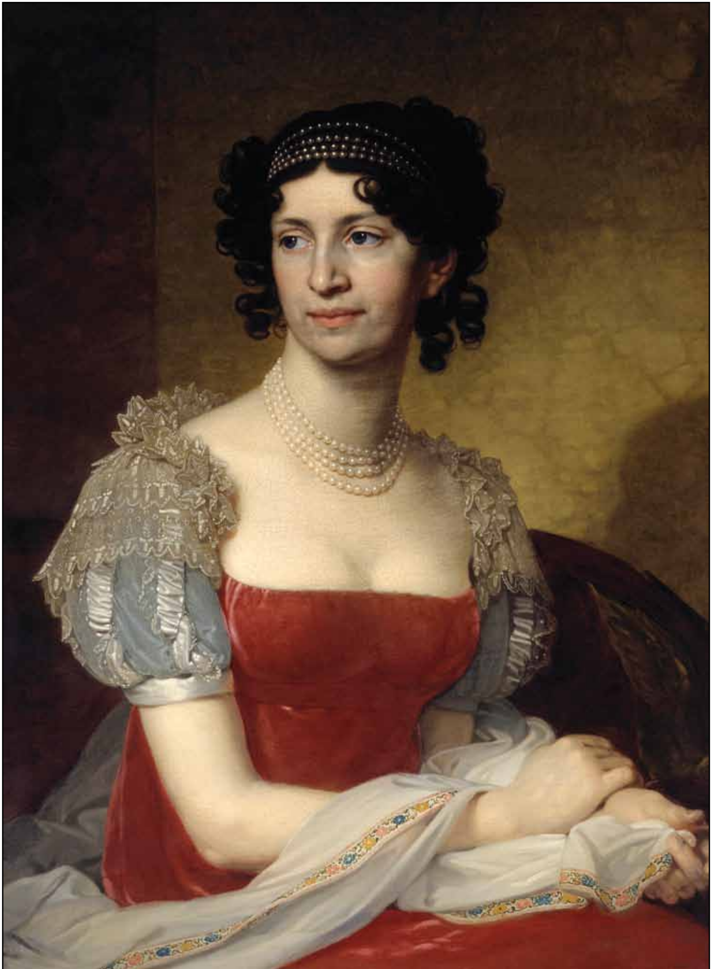
Портрет княгини М. II. Долгорукой. 1811