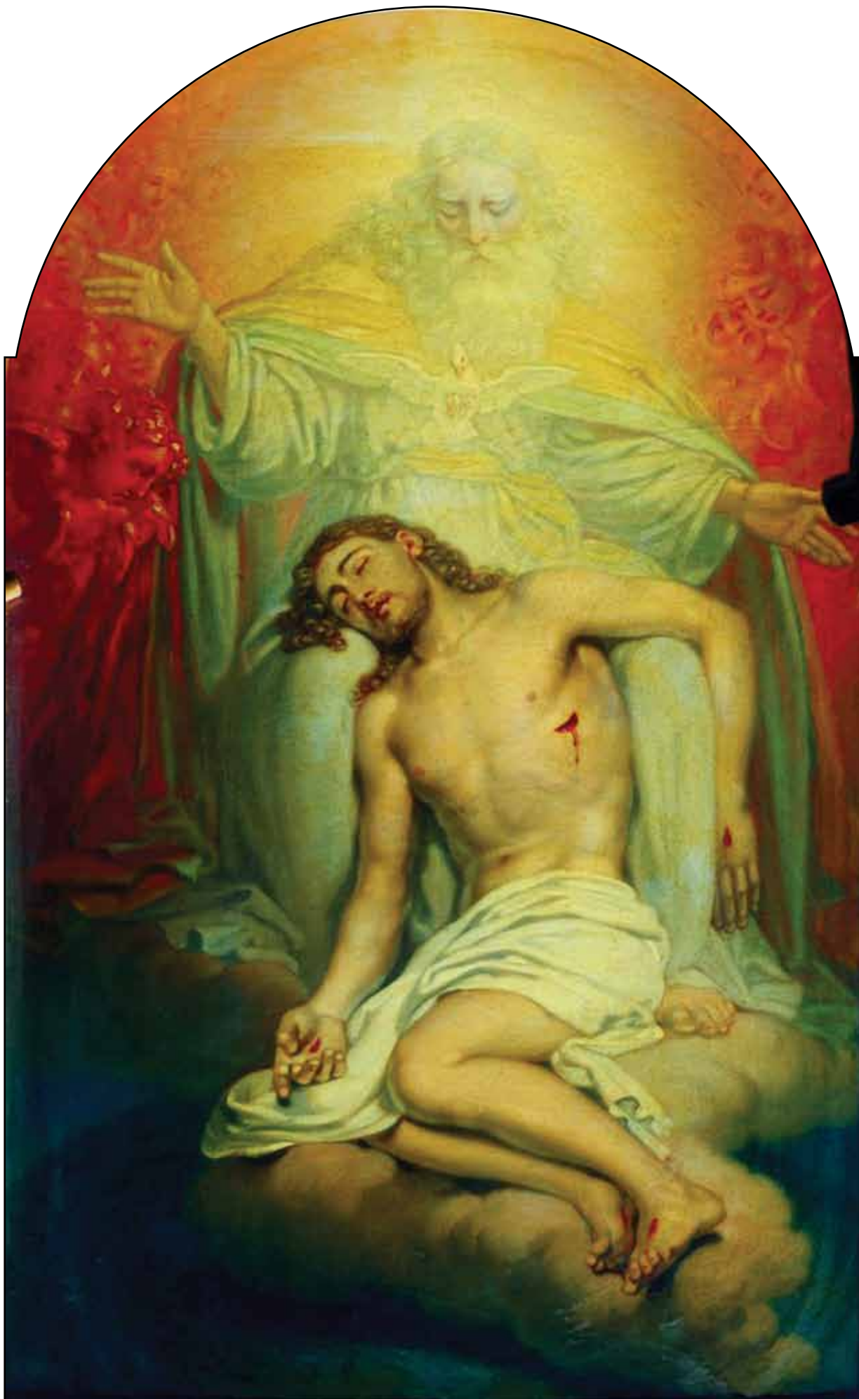
Бог Отец, созерцающий мертвого Христа. Эскиз. 1820-е (?)