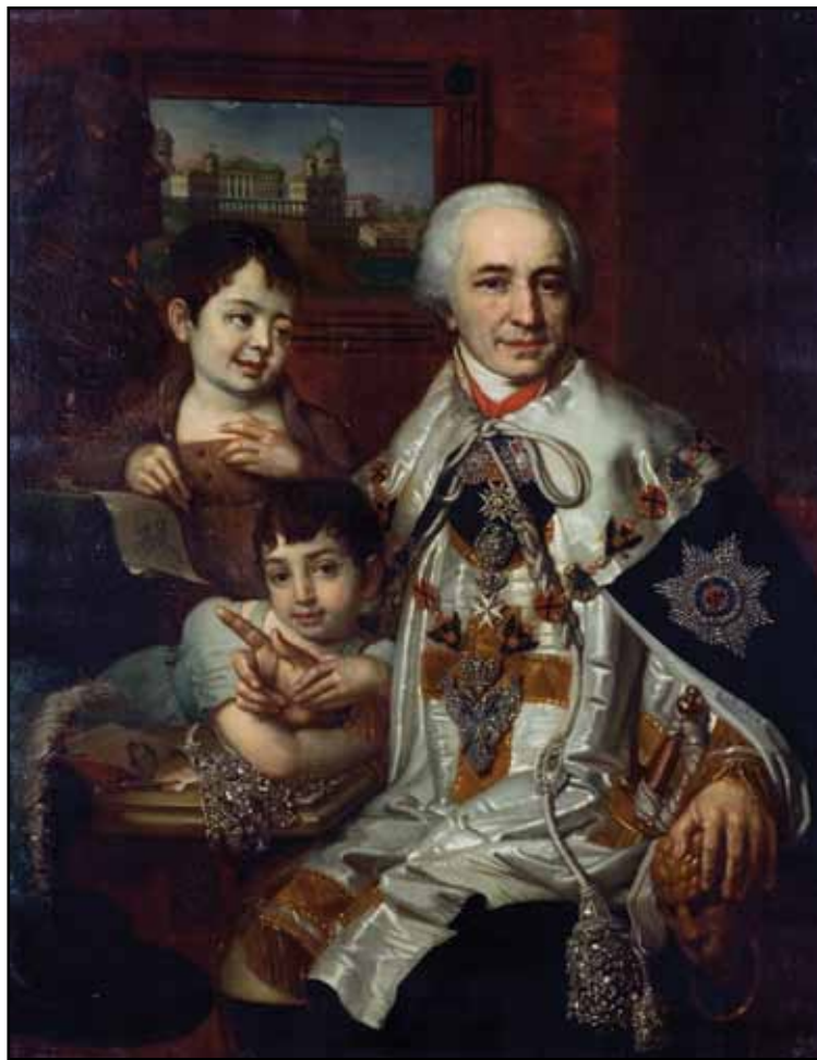
Портрет графа Г. Г. Кушелева с детьми. 1801

К 1801–1802 относится создание «Портрета князя А. Б. Куракина» (Государственная Третьяковская галерея, Москва). Князь Александр Борисович Куракин – крупнейший вельможа XVIII века, государственный деятель, дипломат. Будучи племянником Н. И. Панина, наставника великого князя Павла Петровича, он с детства воспитывался с цесаревичем. Однако в какой-то момент Екатерина II воспротивилась тому, чтобы у наследника с юности появились слишком близкие друзья, и молодой князь был отдален от Павла. Как сам Павел долго ждал своего часа, так и Куракин ждал момента воцарения друга юности. Конечно, и при Екатерине он занимал высокие посты: в 1778 был пожалован в действительные камергеры и обер-прокуроры Сената, с 1796 был вице-канцлером, но уже в 1798 получил отставку. Павел же осыпал его орденами, почестями и деньгами. В 1801 Куракин вновь назначен вице-канцлером, его амбиции были полностью удовлетворены.