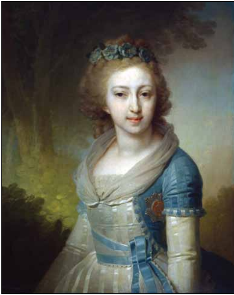
Портрет великой княжны Елены Павловны. Около 1796