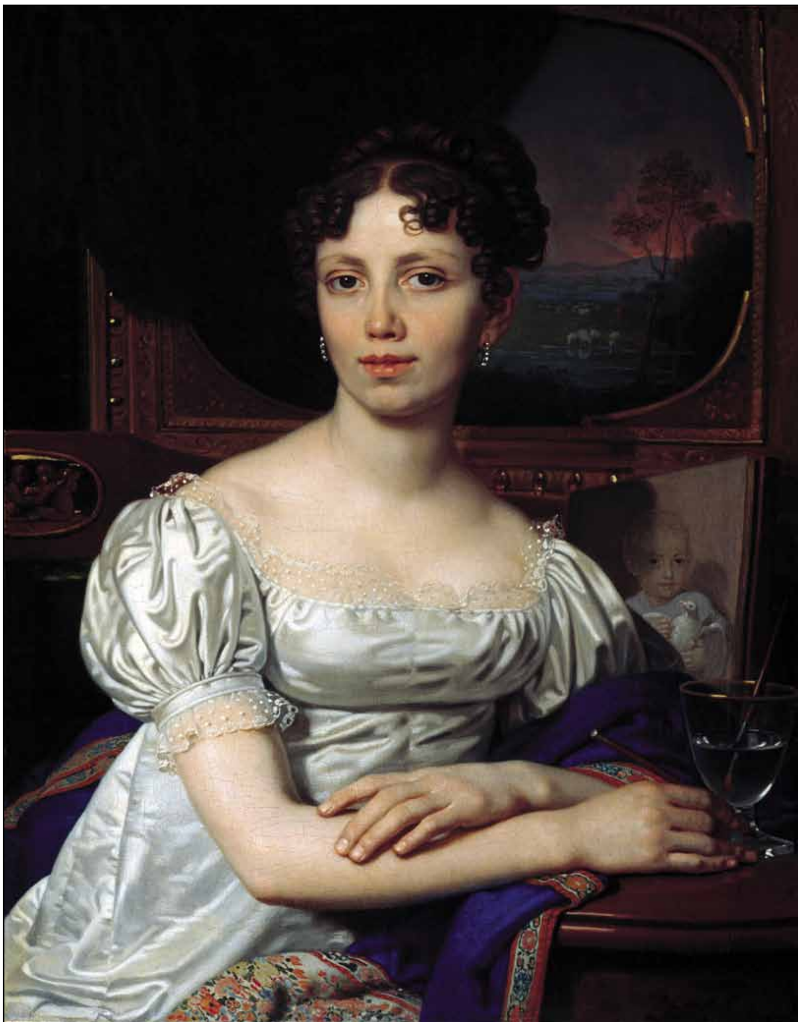
Портрет Е. В. Родзянко. 1821