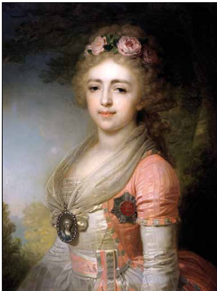
Портрет великой княжны Александры Павловны. 1798