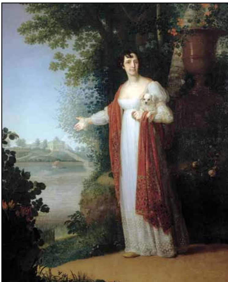
Портрет Д. А. Державиной. 1813