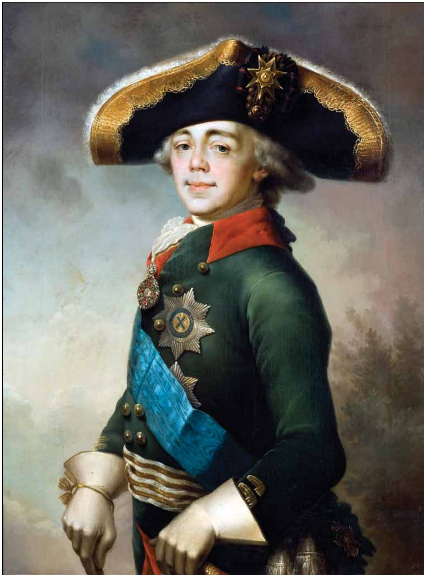
Портрет Павла I, российского императора. 1796