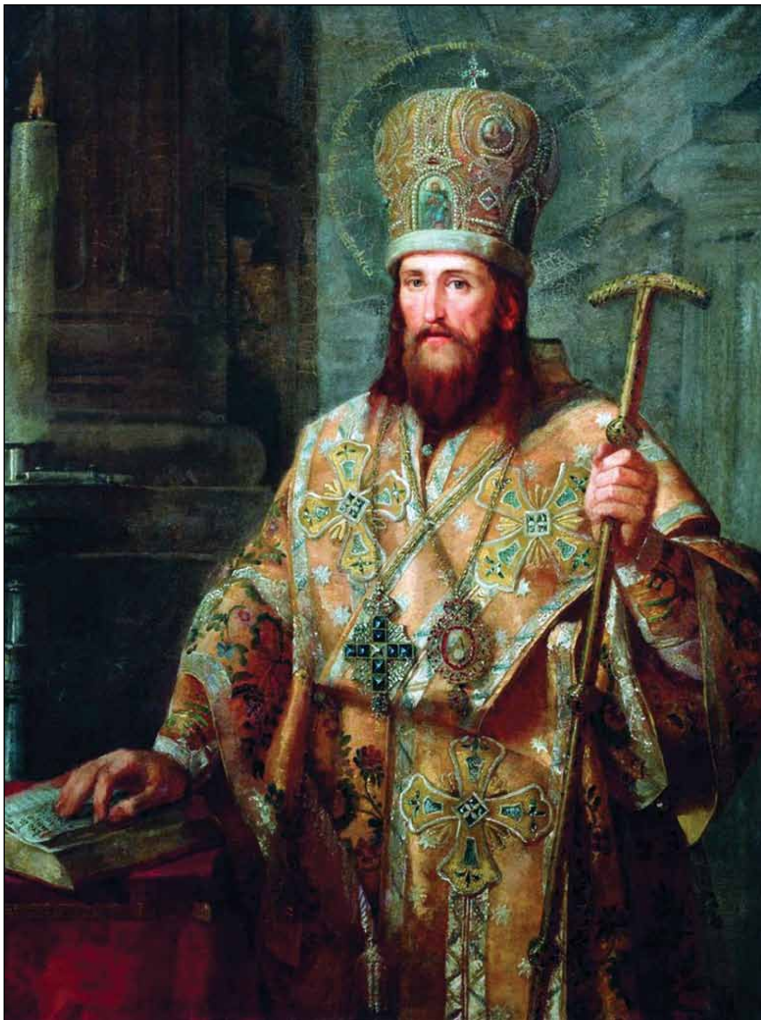
Образ святителя Димитрия Ростовского. 1825