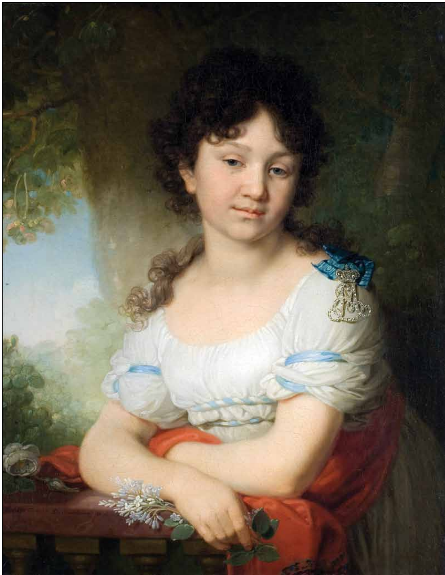
Портрет М. А. Орловой-Денисовой. 1801