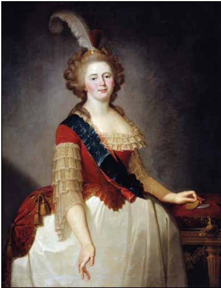
Портрет императрицы Марии Федоровны. 1790-е

выражением, таковы были тогда моды и привычки художества: льстить, нравиться и для того искажать все, что ни случилось изображать художеством» 1 .