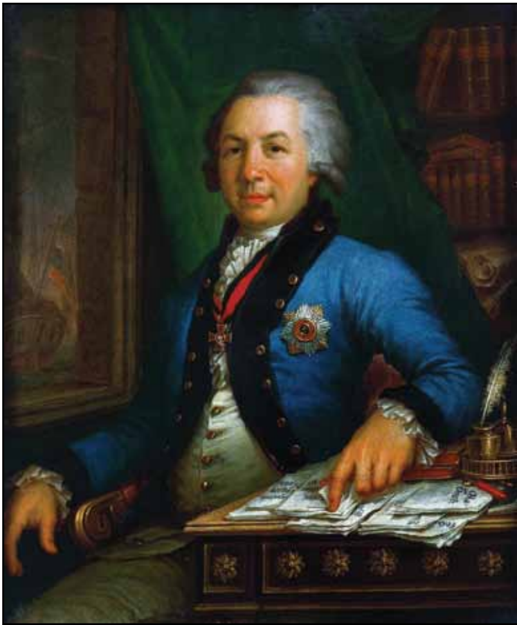
Портрет поэта Г. Р. Державина. 1795

Художник изображал его дважды – в 1795 (Государственная Третьяковская галерея, Москва) и в 1811 (Всероссийский музей А. С. Пушкина, Санкт-Петербург). Первый портрет был создан вскоре после портрета Екатерины II. В то время императрица, как отмечалось, испытывала неприязнь к поэту. Боровиковский, уже связанный с двором (несмотря на большое количество заказов от монаршего дома, он никогда не являлся придворным живописцем официально), знал об опале Державина. Несмотря на это, он решился изобразить Гаврилу Романовича, к которому испытывал искреннюю привязанность. У Державина в то время началась пора новой счастливой жизни – он женился на Д. А. Львовой. Новобрачные были очень дороги Боровиковскому (ранее художник уже сделал миниатюрный портрет невесты).