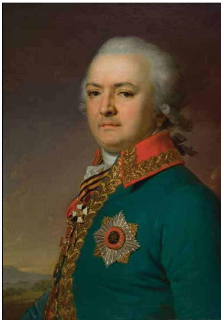
Портрет А. В. Поликарпова. 1796

Известны два варианта картины и эскиз. Последний хранится в собрании Тверской областной картинной галереи. Уменьшенное живописное повторение – в Третьяковской галерее. Большой парадный портрет (1796) украшал царский дворец, а сейчас находится в Русском музее. Композиционно эскиз и уменьшенная копия отличаются от окончательного варианта лишь деталями заднего плана. Фигура Муртазы предстает во всем богатстве своего царственного восточного костюма, при дорогом оружии и драгоценностях. Фоном в третьяковском варианте является родной для принца пейзаж (весьма условный; на петербургской картине – с восточными фигурами). Этот портрет – в силу экзотичности самой модели – стоит особняком в творческом наследии Боровиковского.