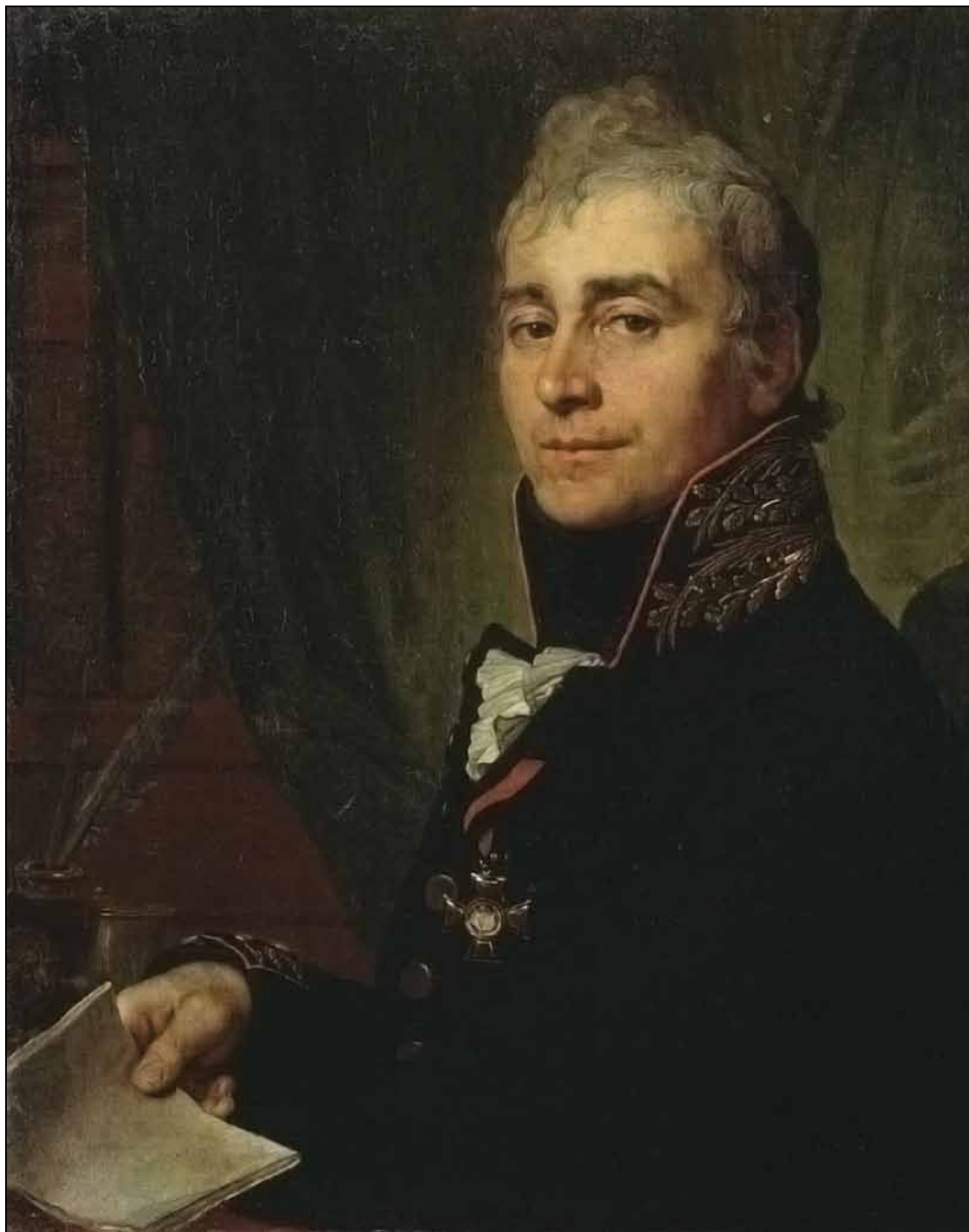
Портрет А. Ф. Бестужева. 1806