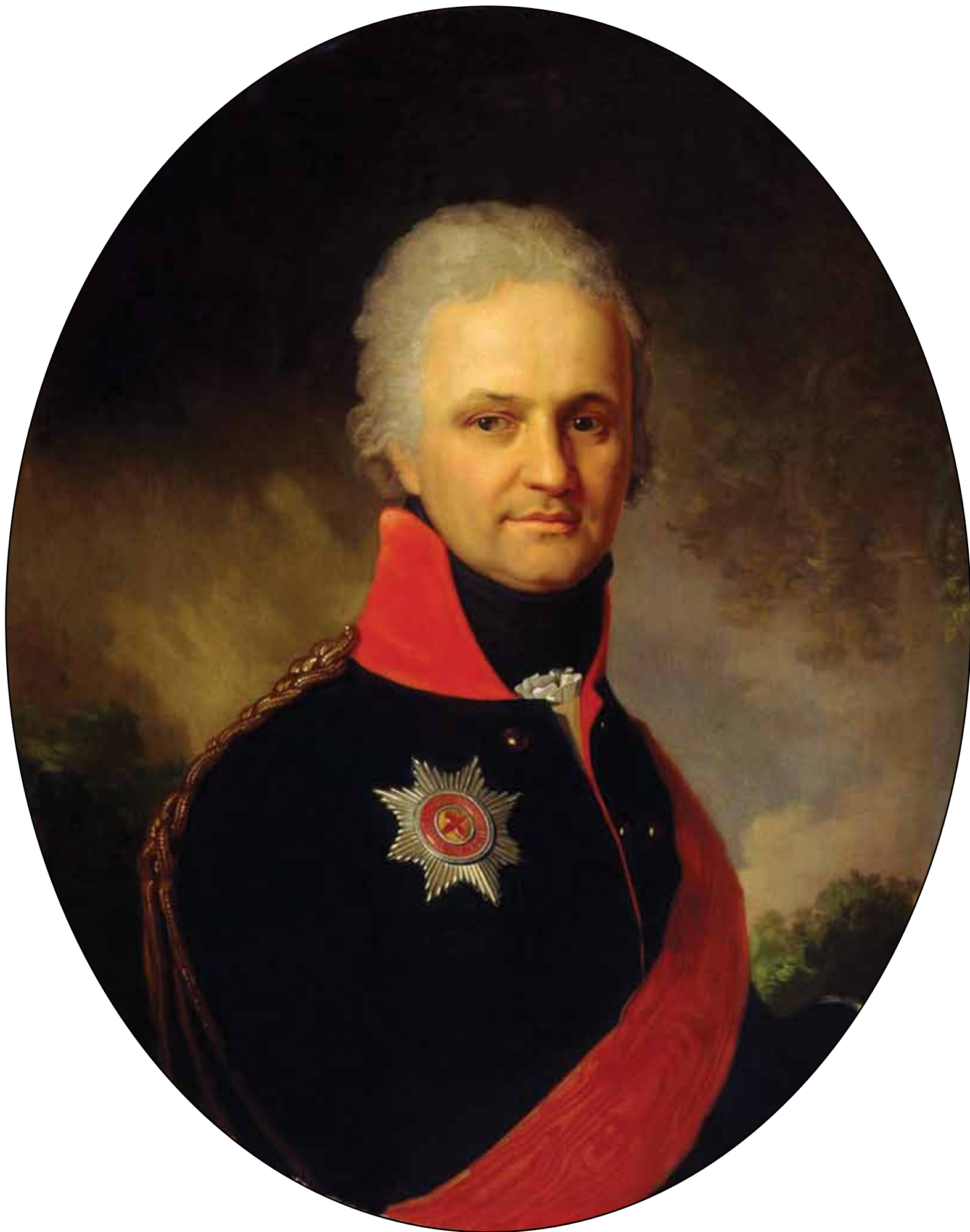
Портрет неизвестного генерала из семьи Бенкендорф. Середина 1800-х