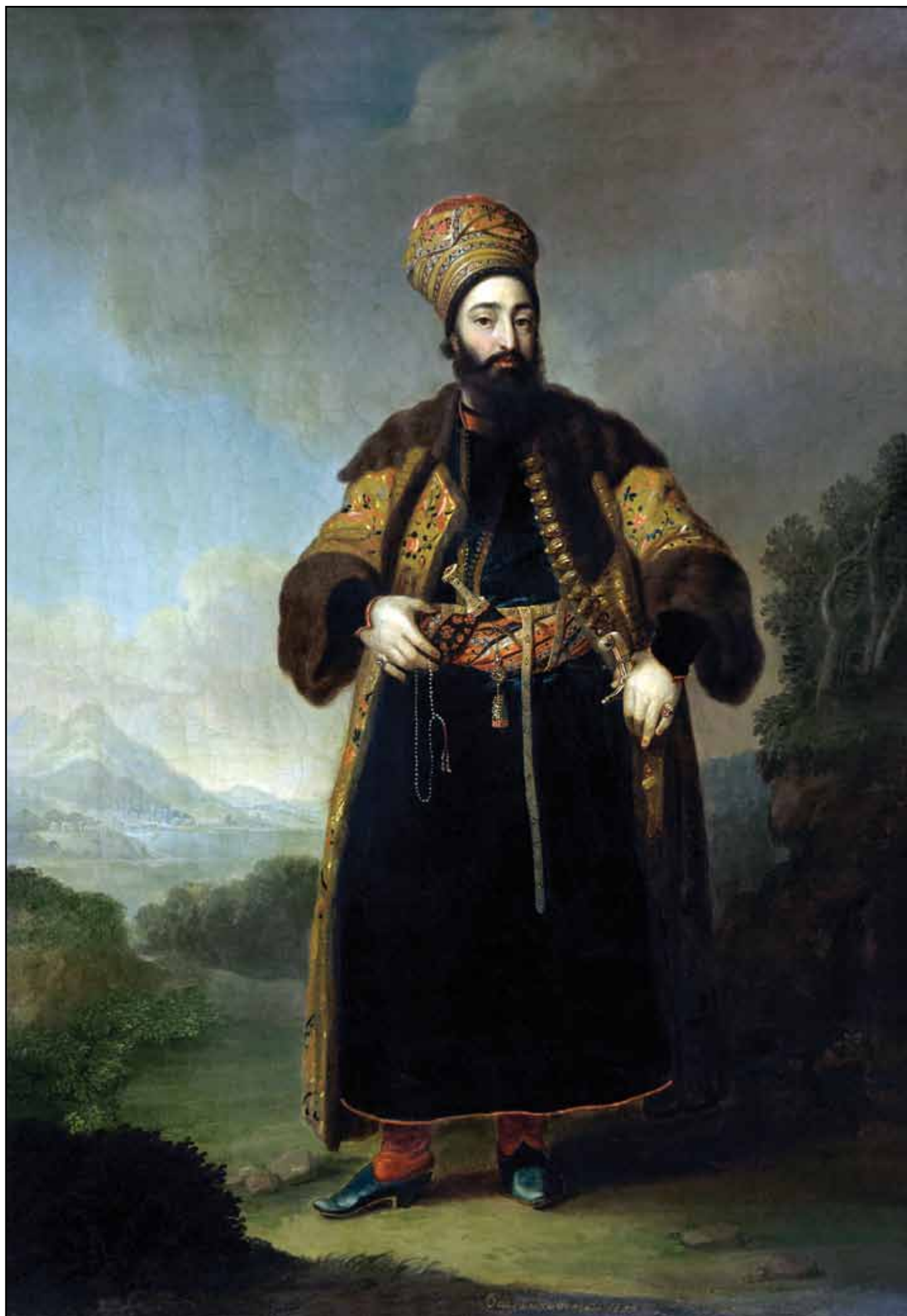
Портрет Муртазы-Кули-хана. 1796