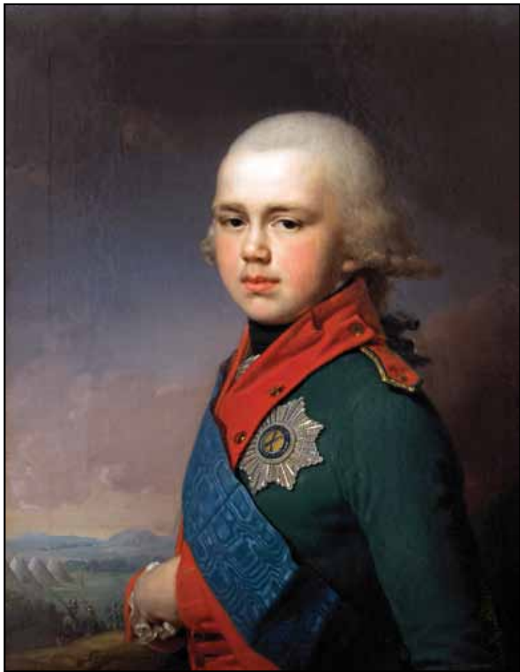
Портрет великого князя Константина Павловича. 1795

искусствоведы). В действительности же, наоборот, поэт описал то, что он уже видел на картине художника: портрет появился в 1794, тогда как стихотворение – в 1797. Такова хронология произведений, хотя, конечно, в личных беседах их идеи могли быть высказаны в другой последовательности.