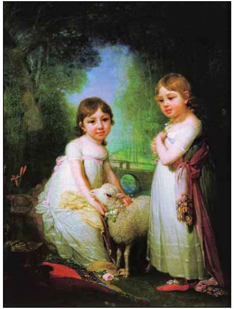
Дети с барашком. 1790

Поучительно и интересно наблюдать, как менялась оценка творчества художника в разные эпохи: признание и много заказов при жизни, охлаждение в XIX веке, причисление к сонму корифеев в наше время. И сейчас, по прошествии почти двухсот лет со