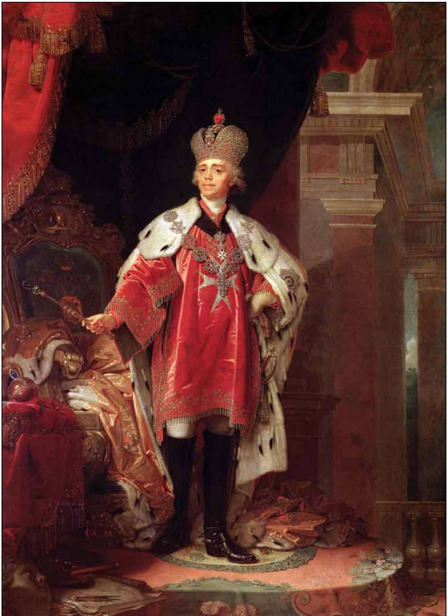
Портрет Павла I в costume гроссмейстера Мальтийского ордена. 1800