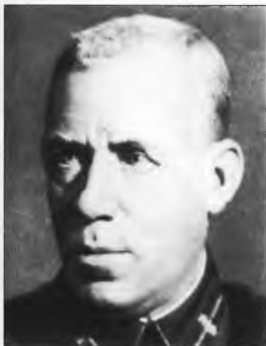
М.Я. Лацис (Судрабс) – член Коллегии ВЧК, председатель Всеукраинской ЧК в 1919 г.