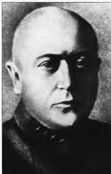
С.А. Мессинг – председатель Петроградской ЧК