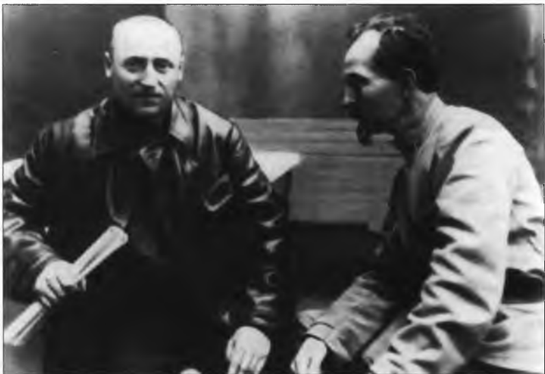
Председатель ВЧК Ф.Э. Дзержинский и заместитель председателя ВЧК И.К. Ксенофонтов, 1919 г.