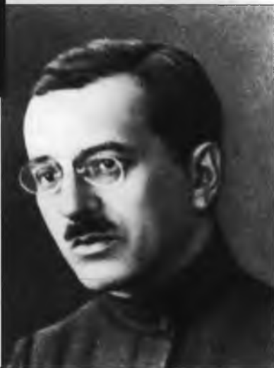
И.С. Уншлихт – заместитель председателя ВЧК