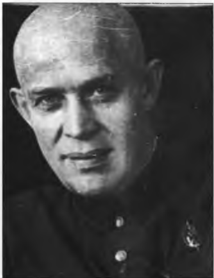
П.Ф. Сидоров-Шестёркин, середина 1930-х гг.