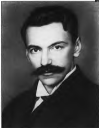
В.Р. Менжинский – член Коллегии ВЧК, затем председатель ОГПУ