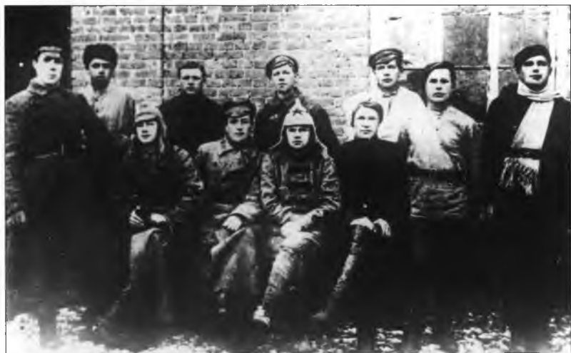
Типы рядовых чекистов, 1921–1922 гг.