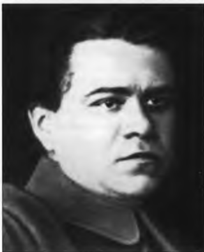
Я.Х. Петерс – заместитель председателя ВЧК