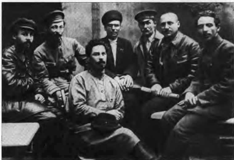
Коллегия ВЧК, 1919 г.