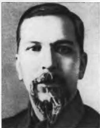
М.С. Кедров – в 1919 г. член Коллегии и начальник Особого отдела ВЧК