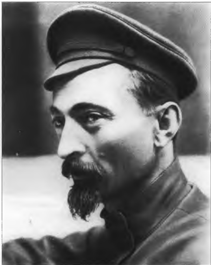
Ф.Э. Дзержинский – председатель ВЧК