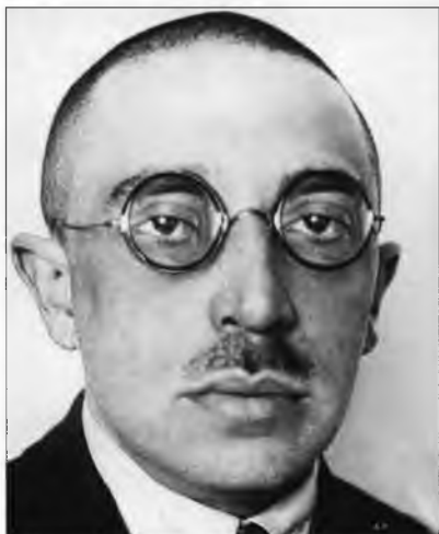
Осип Брик, в начале 1920-х гг. — следователь МЧК