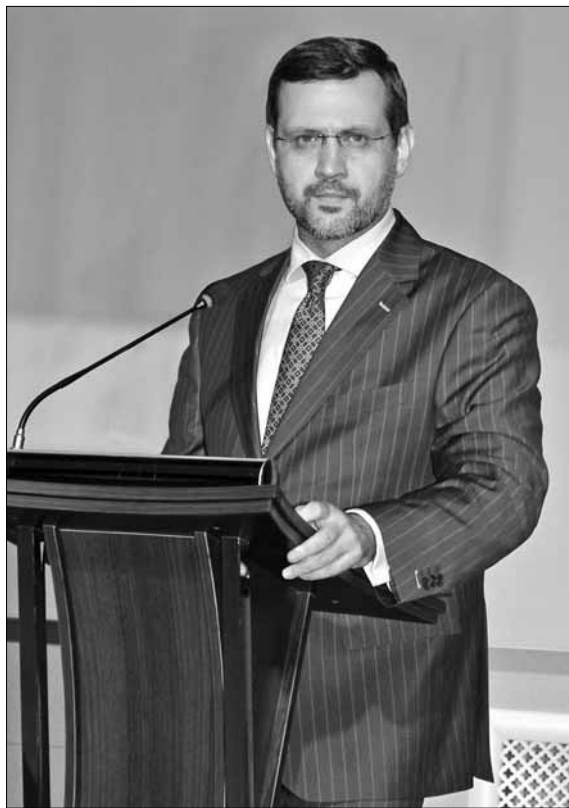
Владимир Легойда открывает фестиваль «Вера и слово».

Вечером 22 сентября по уже установившейся традиции председатель Синодального информационного отдела Московского Патриарха-