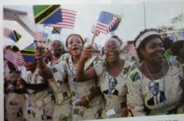
Интересная одежда в Дар-эс-Салам (Танзания). По какой-то причине она не стала модной в Америке.