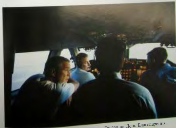
Кабина пилота Борта №1 во время полета в Багдад на День Благодарения в 2003 г.