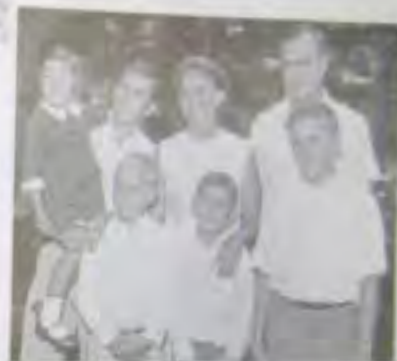
Во время остановки по пути из Андовера в Хьюстон, где мы жили. Из-за разницы в возрасте я чувствовал себя скорее дядей, чем братом.