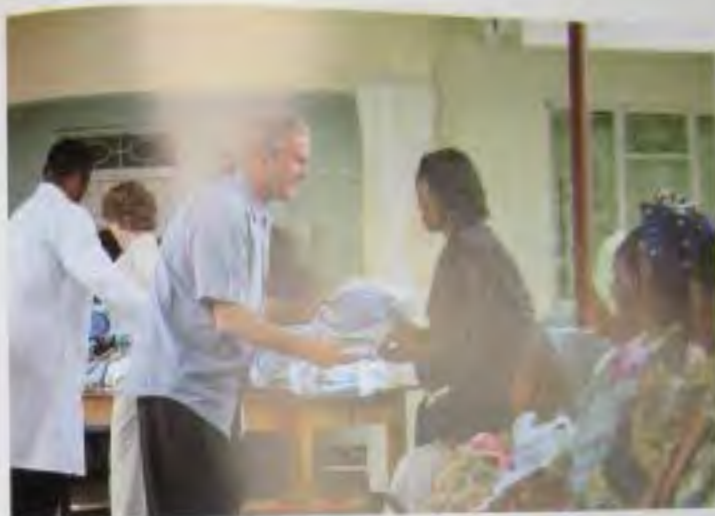
Я раздаю антимооситные сетки матерям в Аруше (Танзания) в рамках программы по борьбе с малярией.