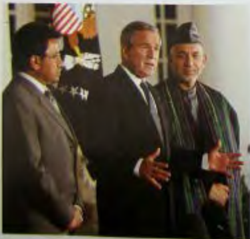
До 2006 г. президент Пакистана Первез Мушарраф (слева) и президент Афганистана Хамид Карзай отказывались от общения друг с другом. Мне все же удалось убедить их встретиться.