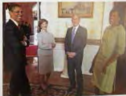
С избранным президентом Бараклом Обамой и его женой Мишель в Голубой комнате в День инаугурации, 2009 г.