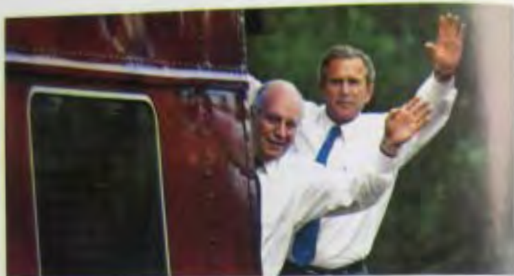
Во время поездок по стране в рамках предвыборной кампании с Диком Чейни, который прекрасно дополнял надежного и принципиального вице-президента.

С членами моей команды по связям с общественностью Дэн Бартлетт, Дана Перино и Тони Сноу.