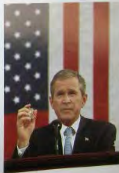
Я показываю значок офицера полиции Управления порта Джорджа Ховарда, который погиб во Всемирном торговом центре.