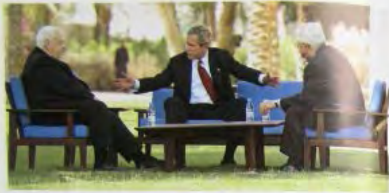
С премьер-министром Израиля Ариэлем Шароном (слева) и премьер-министром Палестинской автономии Махмудом Аббасом в Акабе (Иордания), где они договорились совместно работать над созданием демократического палестинского государства.