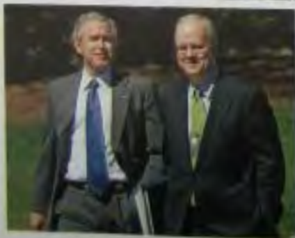
Карл Роув напоминал безумного ученого в политике; умного, странного и полного энергии и идей.