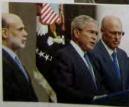
Во время объявления программы по спасению проблемных активов (TARP) с председателем Федеральной резервной системы Бенном Бернанке (слева) и министром финансов Ханком Полсоном.