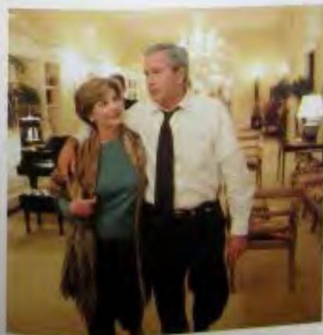
В Белом доме в ночь выборов 2004 г. в ожидании результатов.