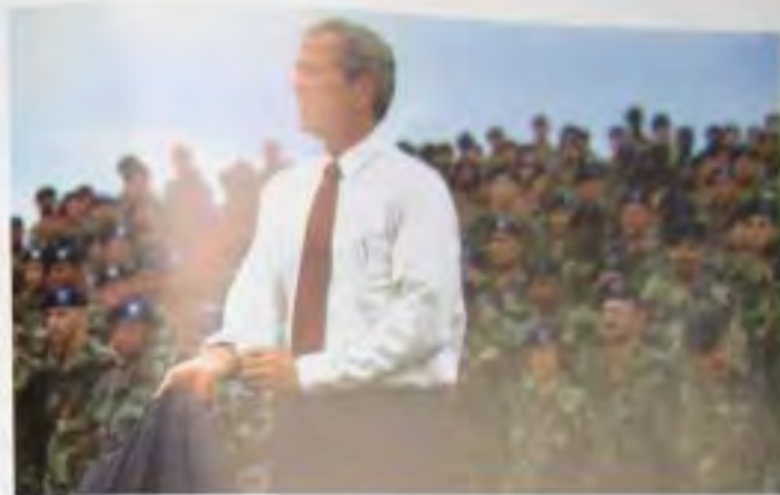
Речь в форте «Драм» в 2002 г. перед солдатами 10-й горнострелковой дивизии, которым удалось ослабить влияние Аль-Каиды и Талибана в Афганистане.