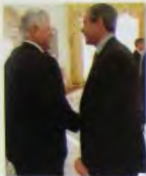
Сенатором Тедом Кеннеди в начале 2001 г. Мы вместе работали над реформой системы образования и иммиграционной реформой, несмотря на то что имели разные зрения относительно войны.

В начальной школе им. Хораса Грили в Чикаго. 92% учеников этой школы живут в бедных семьях, уровень знаний по чтению и математике здесь был улучшен в рамках программы No Child Left Behind.