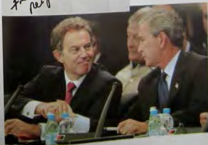
На саммите НАТО в Турине Дон Рамсфелд протянул мне записку от Конди, в которой сообщалось об успешной передаче суверенитета в Ираке, с чем мы поздравили друг друга с Тони Блэром.

The President, Iraq is sovereign. Letter was passed from Bremer at 10:26 AM Iraq time — Let Freedom Reign — Condi