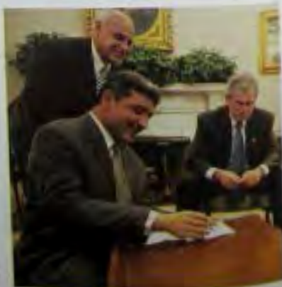
В Овальном кабинете житель Ирака использует свою новую искусственную руку, чтобы написать «мысли о беге с прощальной благодарностью Америке».