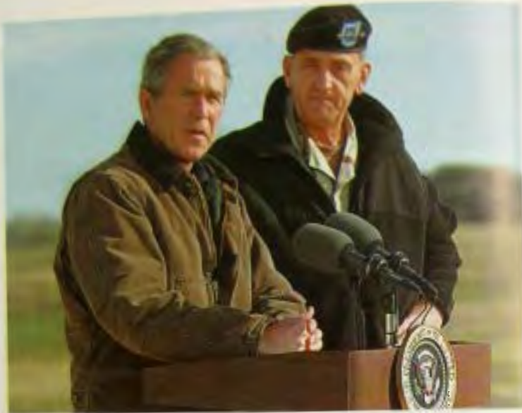
На ранчо с генералом Томми Фрэнксом, руководившим операцией по освобождению Афганистана и Ирака.