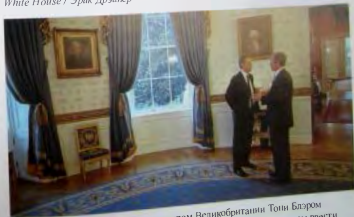
Во время встречи с премьер-министром Великобритании Тони Блэром в Голубом кабинете Белого дома я сообщил ему, что мы планируем ввести сухопутные войска в Афганистан.