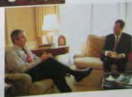
За чашечкой кофе с Джоном Робертсом в Белом доме утром после его назначения на должность в 2005 г.