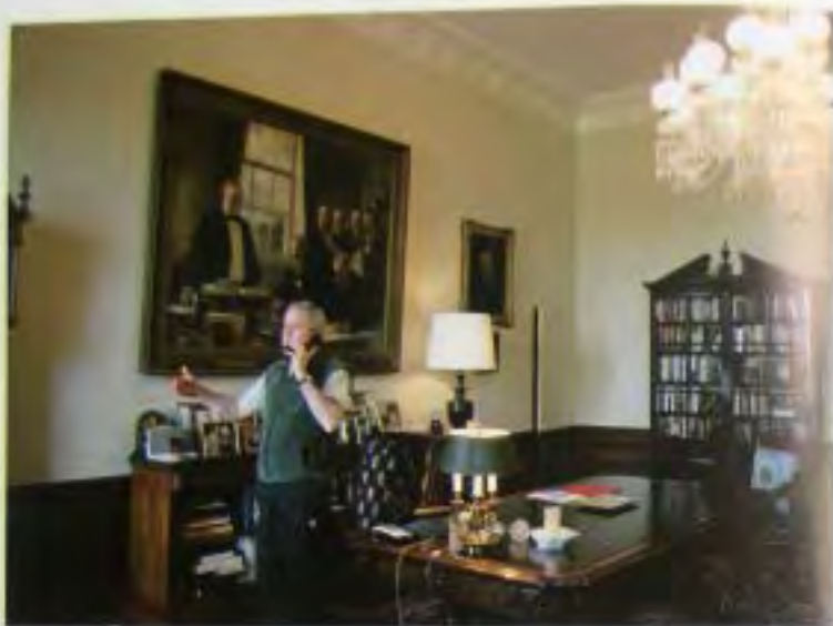
7 октября 2001 г. в переговорном кабинете, где я сообщил о разворачивании военных действий в Афганистане.