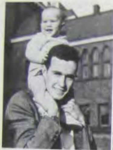
На плечах у отца в Пелте, когда мне было 9 месяцев.