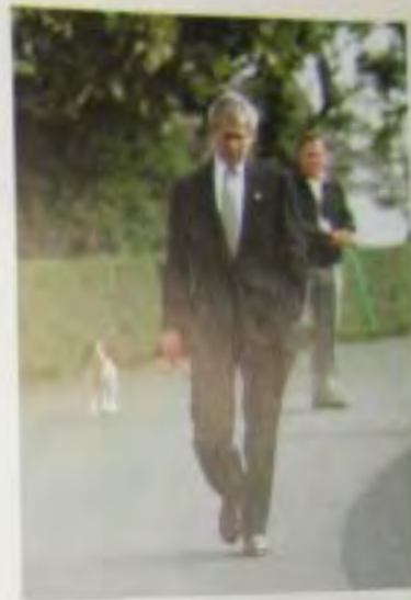
На Юстиниановой террасе перед открытием войны в Ирак.

Пока шел процесс переговоров, давление на активизацию действий возрастало. В начале 2003 года президент федерального резервного банка Алан Гринспен известил меня о нестабильности в экономике. Принц Саудовской Аравии Бандар, мой друг со времени президентства моего отца и посол королевства в Вашингтоне в течение длительного времени, поведал мне в Ovalном кабинете, что наши союзники на Ближнем Востоке ждут решения.