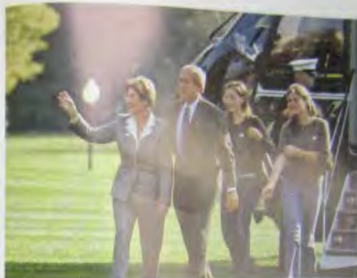
Выход из вертолета в день выборов 2004 г. Мы только что получили результаты экзит-полл, из которых было видно, что я должен проиграть.

Я черпал силу от поддерживающих меня людей во время предвыборной кампании 2004 г. На фотографии я произношу речь в Трое, штат Алабама.