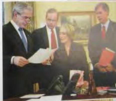
С членами моей команды по связям с общественностью. Слева направо: Дэн Бартлетт, Дана Перино и Тони Сноу.