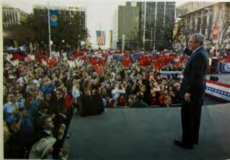
Во время городского собрания в Мидленде в честь моего назначения домой: «Мы с Дорой, возможно, и уехали из Техаса, — сказал я, — но Техас никогда не покидал нас».

Всякий раз, когда кто-то говорит о том, что мы стремились к войне, я вспоминаю все, что происходило в то время. Прошло больше десятка лет со времени принятия решения о войне в Заливе, решений, требовавших от Саддама разоружения; более четырех лет — с тех пор как Саддам выгнал из страны представителей ООН — инспекторов по вооружению; шесть месяцев, как я предъявил ООН ультиматум; четыре месяца с момента принятия резолюции 1441, которая давала Саддаму «последний шанс», и уже минуло три месяца со времени точки отсчета обнаружения его запасов ОМП. Казалось, что нет конца и края этим дипломатическим «отсрочкам», и нас нельзя обвинять в том, что мы спешили начать войну.