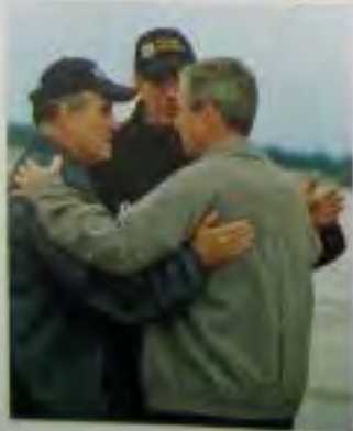
Мэр Нью-Йорка Руди Джулиани (слева), губернатор штата Нью-Йорк Джордж Патаки и я подбадриваем друг друга на базе ВМС «МакГуайр» перед вылетом на место трагедии.