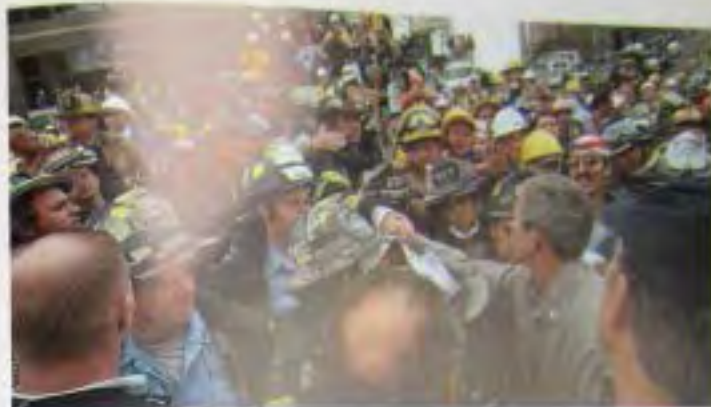
Встреча со спасателями на месте разрушенных башен. «Джордж, найди ублюдков, которые это сделали, и убей их!» — выкрикнул кто-то из толпы. А другой человек добавил: «Чего бы это ни стоило!»