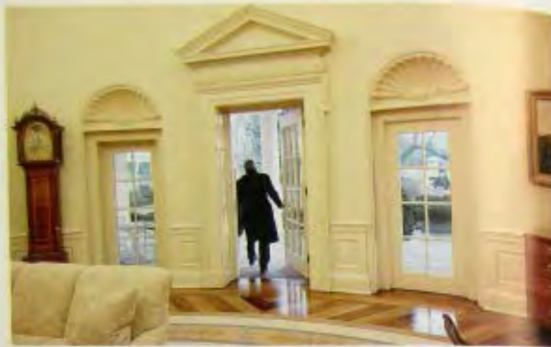
В последний раз я покидаю Овальную кабинет.