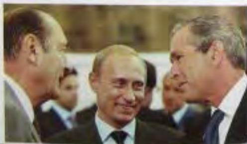
С президентом Франции Жаком Шираком (слева) и президентом России Владимиром Путиным.