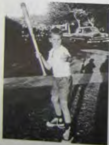
Типичный день в Мидленде, когда я мог играть в бейсбол хоть целый день.