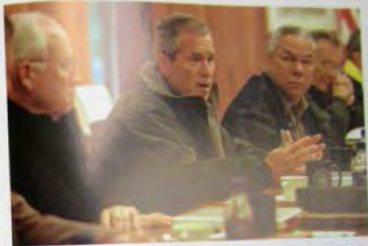
Встреча с Диком Чейни, Колином Пауэллом, Доном Рамсфелдом и лицами, отвечающими за национальную безопасность, в загородной резиденции Кэмп-Дэвид в субботу, после 11 сентября.