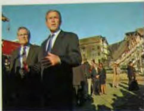
12 сентября 2001 г. я приехал в Пентагон с министром обороны Донам Рамсфелдом. White House / Эрик Дрэйпер

Во время моего обращения к народу 14 сентября 2001 г. «Этот конфликт начался не по нашей инициативе, — сказал я. — Но именно мы выберем время и способ, чтобы положить этому конец». White House / Эрик Дрэйпер