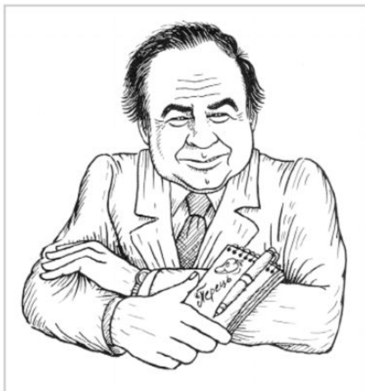
Дружній шарж Олександра Монастирського