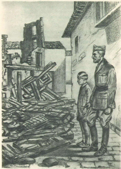
К развалинам улица привела.