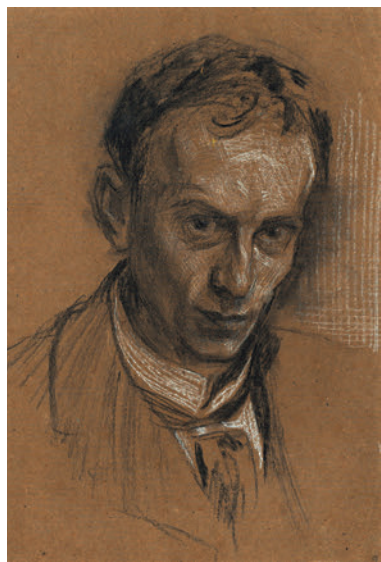
Артур Рэкхем пастель, 1900 г.

Вышедшая в 1920 году книга Джеймса Стивенса «Ирландские предания» была украшена работами знаменитого британского художника Артура Рэкхема. К этому времени этого человека называли одним из выдающихся мастеров золотого века британской книжной иллюстрации. За его плечами