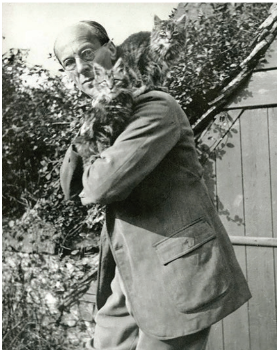
Артур Рэкхем со своими котами, 1920-е годы

Рэкхем прекрасно справился с этой работой. Более того, он почувствовал, что иллюстрации к произведениям в стиле фэнтези — это его призвание. Не случайно следующей его крупной работой стали рисунки к «Легендам Инголдсби». Это был сборник мифов, легенд и рассказов о привидениях, написанных неким Томасом Инголдсби из поместья Тэппингтон (на самом деле