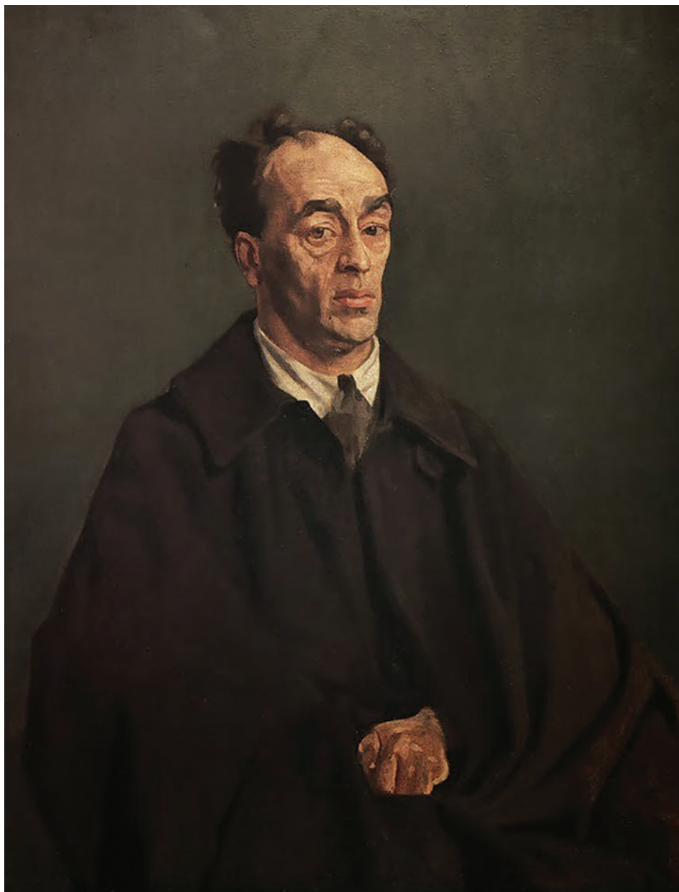
Джеймс Стивенс (1882–1950)