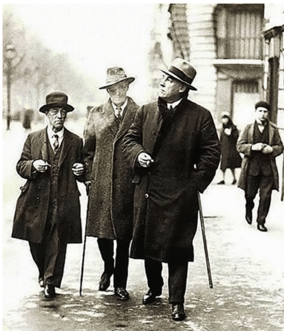
Джеймс Джойс озаглавил этот снимок «Три ирландские великолепия».

Стивенс прожил долгую жизнь. Он скончался, разменяв девятый десяток, 26 декабря 1950 года. После него осталось множество стихов, несколько романов и сборники творчески переработанных ирландских легенд, по которым знакомиться с фольклором этой страны интересно и по сей день.