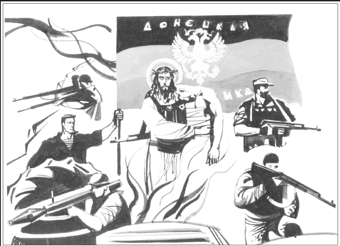
Рис. Геннадия ЖИВОТОВА

Донбасс разбудил дремлющую Россию. Так свет солнца проникает в тёмную, огромную гору, в её холодные глы-