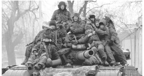
г. Рязань, Рязанская область

Отче наш, спаси Россию! Русь Святую обереги! Милосердно отпусти ей Все великие грехи. Упадём мы на колени, Вскинем взор на образа — След жестоких поколений Сметет чистая слеза. Миром будем мы молиться От зари и до зари: — О, Небесная Царца, Благодарю озари! И святым своим покровом Всю Россию защити, Помоги нам путь суровый С верой в Господа пройти!