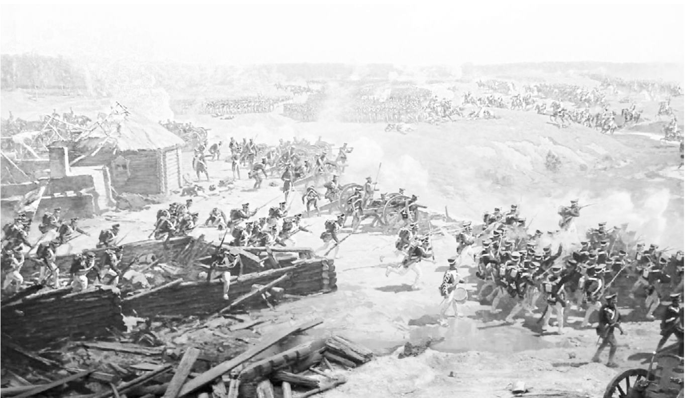
Фрагмент панорамы «Бородинская битва», художник Франц Рубо

При отступлении русских войск отмечалось массовое дезертирство солдат-литовцев. А коллаборанты добавились к "двунадесяти языкам", создавая Литовский корпус, польско-литовскую жандармерию. Но белорусские крестьяне восприняли обстановку иначе. Когда их паны предали России, принялись громить усадьбы. Литовские и польские помещики сбегались в города, жаловались оккупантам. Те высылали карательей. И в первую Отечественную по всей Белоруссии тоже заполыхали деревни. Народ усмирлял расстрелами и виселицами. Недоформированный Литовский корпус там и остался, на подавлении мятежей — пока его не пobiли и не разогнали русские части генерала Эртеля, действовавшие из Мозыря.