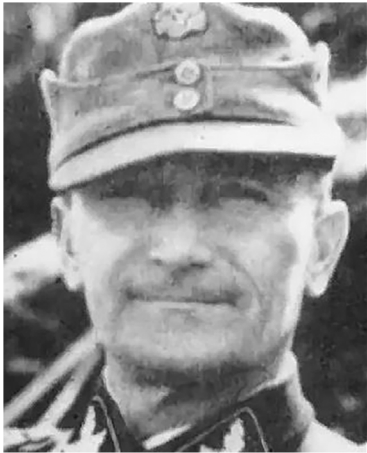
Предполагаемые дед и внук: группенфюрер СС Фриц фон Шольц и канцлер Германии Олаф Шольц