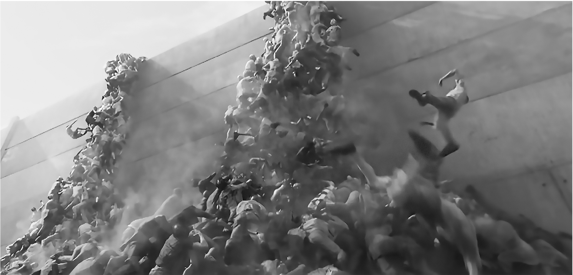
Так с точки зрения Голливуда выглядит мировой продовольственный кризис на фоне вирусной эпидемии. Кадр из фильма «Война миров Z» (2013).

Когда мы говорили о проигрыше Трампа в конце 2020 — начале 2021 года, мы отмечали, что он был неожиданным. В составе следующего кабинета, который был сформирован Байденом, оказались в основном его личные назначения — католики и евреи. И весь 2021 год мы наблюдали метаморфозы концепта под названием "инкклюзивный капитализм". Помните, мы слышали про борьбу с глобальным потеплением из каждого "утюга" — борьба шла увлекательная, весь мир готовился неизвестно к чему. У нас ещё успел выступить Чубайс, который заявил, что мы должны