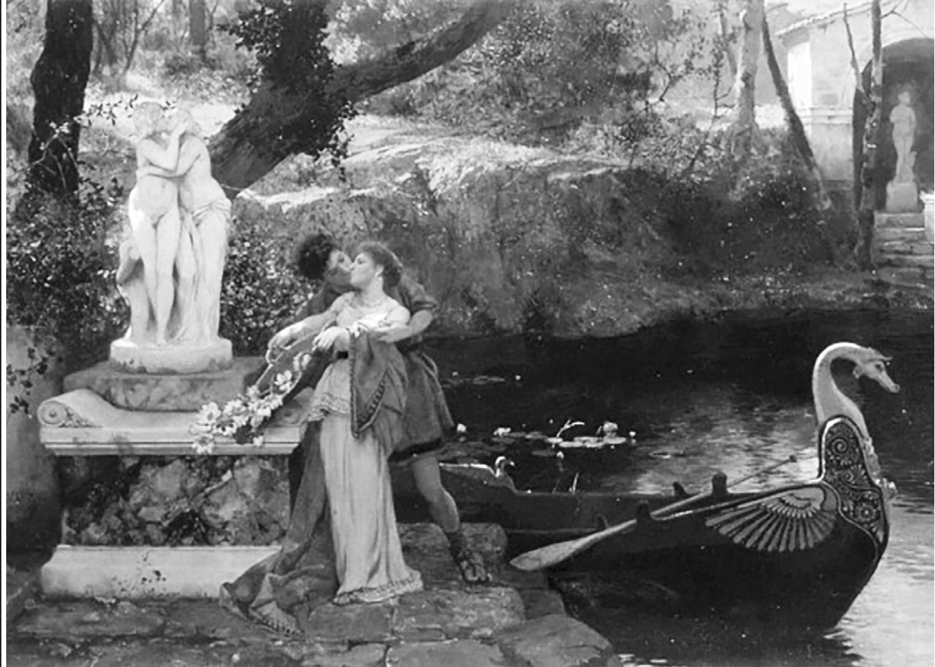
«По примеру богов», художник Г.И. Семирадский (1899 г.)

вызывали шквал нареканий и подлинный восторг, а чаще — то и другое одновременно. "Шарлатан в рисунке, шарлатан в колерах он, однако же, с таким умением воспользовался светотенью и блеском общего, что на первый раз поразил", — сказал о мастере его самый грубый критик Илья Репин. Тем не менее он изумлялся умениям "пронырливого поляка". К зависти, нормальной в творческой среде, примешивалась зависть сословная, потому что Семирадские — знатная шляхта, род