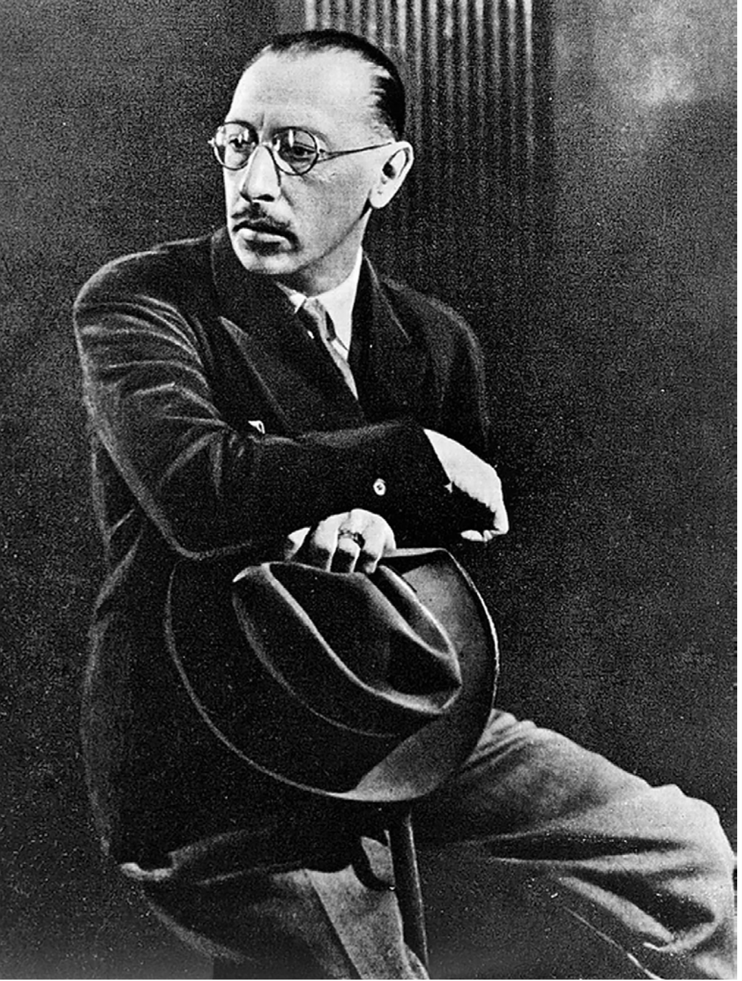
Игорь Фёдорович Стравинский. Ницца (Франция), 1927 г.

И вот идея мессианства русской культуры уже завладела умами в Петербурге. Балет здесь и раньше занимал привилегированное положение, служил возведению мощи и красоты империи. Открыть новый красочный мир Русского балета, по-новому раскрыть его национальную тематику, утвердить в глазах Запада русское национальное искусство — задача.