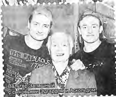
Вальтер Запашный с сыновьями Эдгардом и Аскольдом

пашный был на арене. Но ради такого события он прервал представление, выбежал во двор цирка, выпалил всю обойму холостых патронов из своего нагана и затем разрядил в воздух ракетницу.