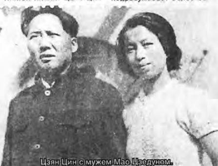
Цзян Цин с мужем Мао Цзедунем.

Все шло согласно партийной линии: Цзян Цин