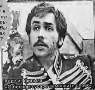
Кадр из фильма «О бедном гусаре замолвите слово»

О себе артист заявляет просто: «Я всегда любил придуриваться. Никогда не хотел быть лучше, чем я есть. Наоборот, всегда хотел быть хуже... Я играю гениально, даже враги признают. Вы приходите, посмотрите, как надо играть. Нескромно? Скромность оставим неудачникам, а я удачливый».