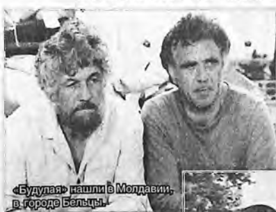
«Будулая» нашли в Молдавии, в городе Бельцы.

По сценарию в конце первого фильма Будулая убивает, однако Михай Волонтир упорно сценариста изменить судьбу киногероя, сохранив ему жизнь. К просьбе присоединился и литературный «отец» Анато-