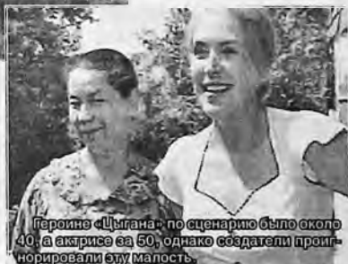
Героине «Цыгана» по сценарию было около 40, а актрисе ее 60, однако создатели проигнорировали эту малость.

ни. Клара Степановна не раз получала письма с дежурной строчкой: «Кланяемся вашему мужу, Будулаю Романову». Уверовали в их роман и романы. Как-то после выхода сериала Лучко остановили цыгане: «А Будулай где?»