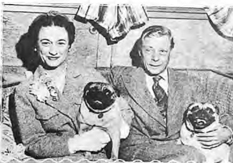
Герцог Виндзорский не стал королем, не короновал свою избраницу, но сделал почти невозможное, подниме ее выше британской короны. И уж точно по праву обеспечил себе место среди великих историй любви.

ленно... И тут же женился на миссис Симпсон!