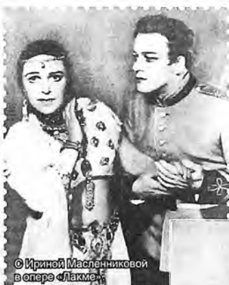
© Ириной Маслениковой в опере «Лакме»

спектакля заканчивается провалом из-за того, что накануне Пята поспорил с любимой девушкой. А в жизни, сам того не ожидая, он стал символом новой советской действительности: деревенский паренек из семьи батраков становится ведущим солистом Большого театра. Но в целом-то миф творился не столько деревенский паренек трудом, упорством, обаянием, где-то удачей,