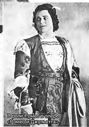
В роли Ромео в опере «Ромео и Джульетта»