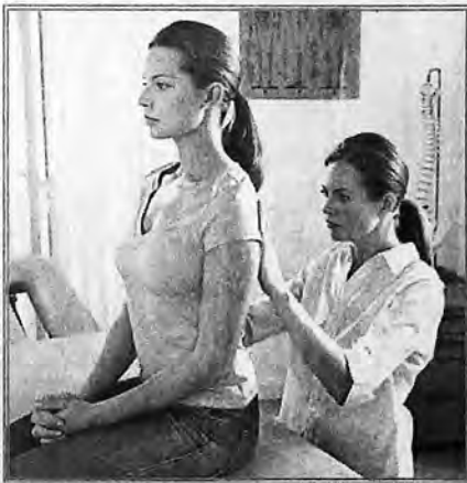
В наш век высоких технологий еще не изобретен аппарат, который позволил бы исследовать позвоночник в полной мере. Тем не менее, придя на прием к врачу, вы имеете право на максимально полное обследование с использованием всех имеющихся методов диагностики.

Что касается походов в баню или сауну, то следует запомнить: любые температурные перепады могут вызвать обострение заболевания. Прогревать больное место при остеохондрозе опасно, впрочем, так же, как закаливать ледяной или контрастным душем.