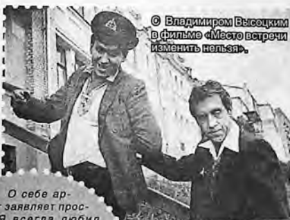
© Владимиром Высоцким в фильме «Место встречи изменить нельзя».

О себе артист заявляет просто: «Я всегда любил придуриваться. Никогда не хотел быть лучше, чем я есть. Наоборот, всегда хотел быть хуже... Я играю гениально, даже враги признают. Вы приходите, посмотрите, как надо играть. Нескромно? Скромность оставим неудачникам, а я удачливый».