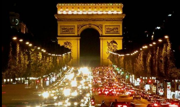
Символ Парижа — Пизда ( глаз из Да , Бога щель), Триум ФАЛШ ная арка 11

Ведать Пи — знать его как Мир, Три без иного 9 : без тени Огнь. Ибо Пи есть Мир в очах, с ним согласных: в Трех Три . Зреть Пи Тройкою — видеть : единым очьми с Миром быть; зреть иначе — с|мо|треть , зреть без в|д|енья . Видел Пи — Мир, Тройку, — Пращур , очей При|мит|ив : при Метé , Цели — верный ей, при Сердце — Ум как слуга 10 .