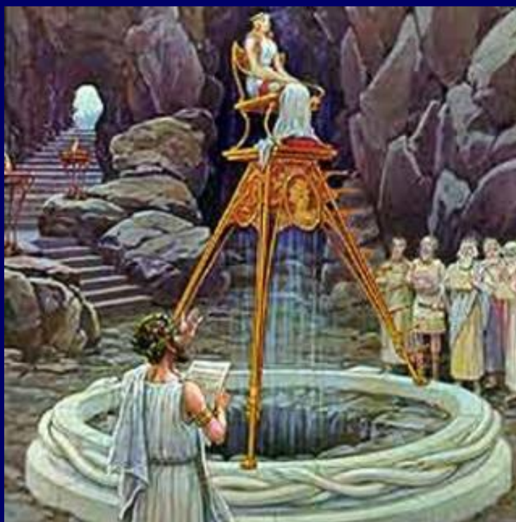
Пифия, восседающая на медном треножнике над дырой в Нижний мир в храме Аполлона Пифийского в Дельфах.

*Иглюзии как пелены, скрывшей эту Реальность.