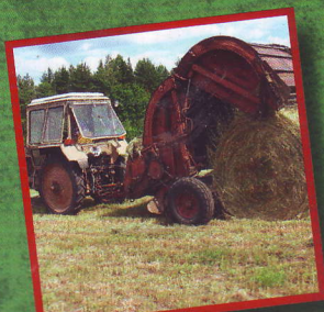
Пресс-подборщики и комбайны