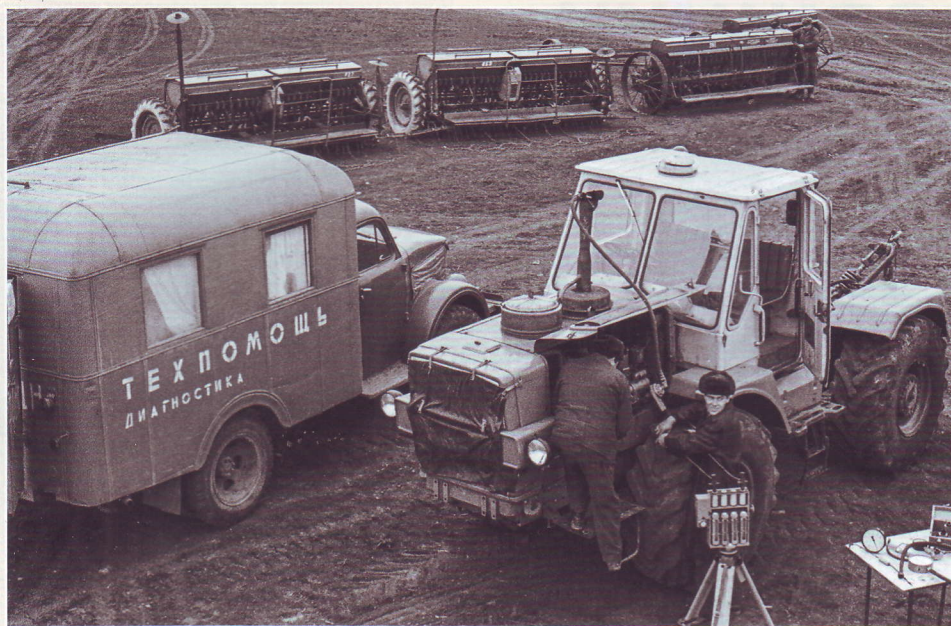
Диагностика двигателя трактора Т-150К в поле. 1975 г.

На базе трактора сконструировали бульдозер Т-150КД, погрузчик Т-156, лесопромышленный трактор Т-157, промышленный Т-158, легкий колесный тягач Т-155, машину химизации ЭСВМ-7.