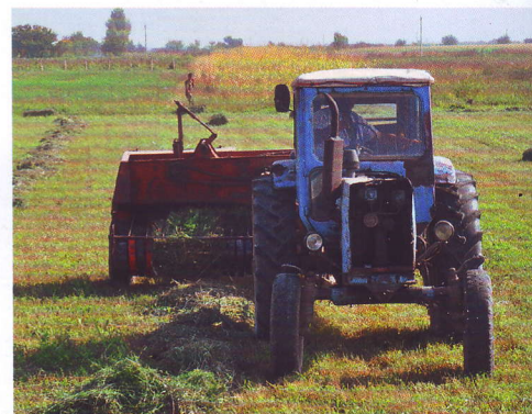
Трактор с прицепным тюковым пресс-подборщиком «Киргизстан».

Эти машины еще называют поршневыми пресс-подборщиками. В них в прямоугольных прессовальных камерах сено уплотняет поршень, образуя из растительной массы малогабаритные и крупногабаритные тюки весом до 35 и до 750 кг соответственно. Пресс-подборщики ПС-1,6 и ППЛ-Ф-1,6 формируют при максимальной плотности прессования тюки массой до 27–36 кг. Стандартная длина тюка – 80–100 см, ширина – 50, высота – 35–36 см. Длину тюка регулируют изменением частоты срабатывания вязального аппарата. Оптимальная плотность валка для работы названных пресс-подборщиков – 1,4–1,6 кг на 1 м валка. Пресс-подборщик ПКТФ-2,0 формирует с обвязкой шпагатом тюки размером 220 × 240 × 120 см и массой до 500 кг. По мере образования тюка вязальный аппарат увязывает его специальной проволокой (ПС-1,6А) или синтетическим шпагатом (ПС-1,65).