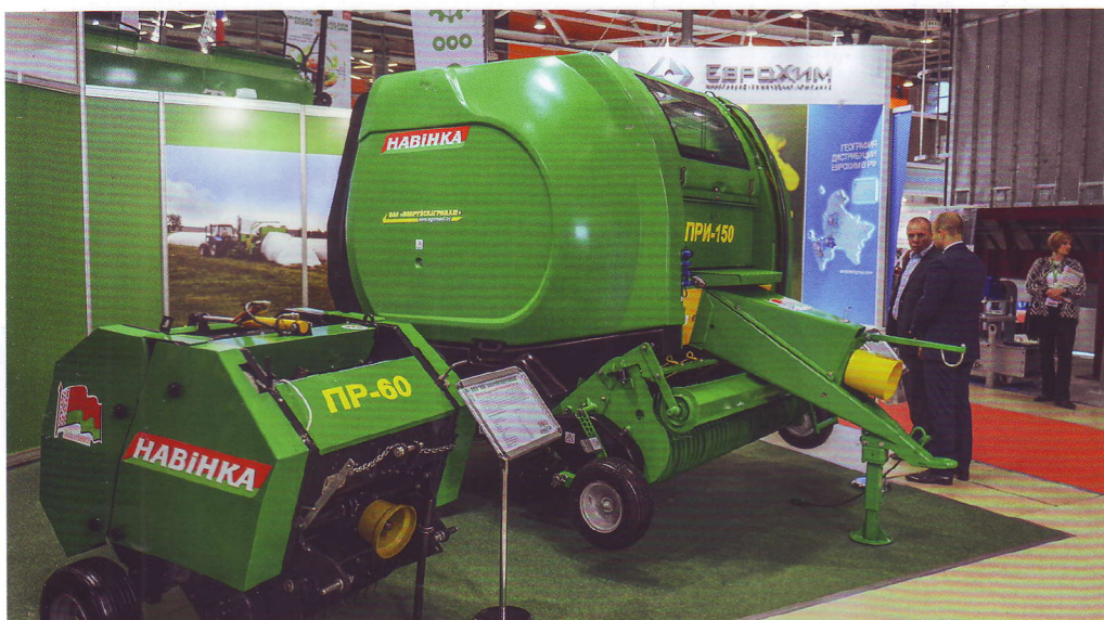
Рулонный пресс-подборщик ПР-60 «Бобруйскагромаш». 2016 г.

Практически все питающие аппараты оснащаются металлодетектором и камнеуловителем, которые предотвращают попадание посторонних предметов внутрь машины.