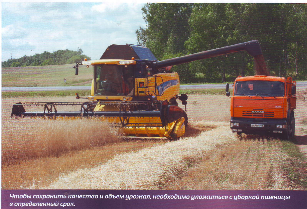
Чтобы сохранить качество и объем урожая, необходимо уложиться с уборкой пшеницы в определенный срок.

25 и 40° ю. ш., где годовая норма осадков составляет в среднем 300–1100 мм. Оптимальный урожай созревает при 250–1000 мм осадков в год и сезонном их распределении. Рост идет, пока температура не падает ниже 3 °С и не поднимается выше 32 °С, а оптимальная – 25 °С. Яровую пшеницу сеют с марта по май в зависимости от местных условий. Урожай обычно убирают, когда влажность зерна снижается до 13 %. Яровой пшенице для созревания нужно около 100 безморозных дней. Более ранняя уборка, когда влажность зерна выше, требует его сушки, а более поздняя – снижает объем получаемой продукции, поскольку зерно начинает осыпаться из колосьев, а растения – полегать.