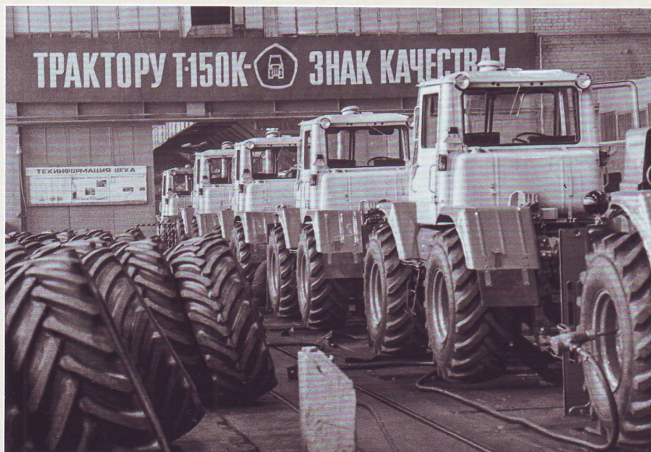
Тракторы Т-150К на главном сборочном конвейере завода. 1978 г.

Трактор Т-150К оснащался двигателем СМД-62. Это модификация базовой модели – СМД-60, которую устанавливали на гусеничный Т-150. Дизель СМД-62 отличается регулировкой на мощность 165 л. с. при скорости вращения коленчатого вала 2100 об/мин и установкой компрессора для пневмосистемы трактора Т-150К. Остальные параметры и особенности конструкции как у базового дизеля. СМД-60 – четырехтактный, шестицилиндровый, короткоходовый дизель, жидкостного охлаждения, с непосредственным впрыском топлива и турбонаддувом. Цилиндры расположены в два ряда под углом 90° и выполнены в общем блоке вместе с верхней частью картера. Левый ряд цилиндров смещен относительно правого на 36 мм, что дало возможность устанавливать два шатуна противоположащих цилиндров на одну шатунную шейку коленчатого вала. V-образная схема расположения цилиндров обеспечивает компактную компоновку агрегатов и механизмов