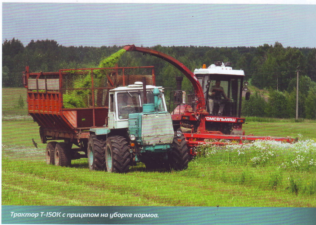
Трактор Т-150К с прицепом на уборке кормов.

включается гидроподжимная муфта последующей передачи, затем выключается гидроподжимная муфта предыдущей передачи. Долю секунды обе муфты включены, что и обеспечивает безразрывность переключения. Трактор Т-150К оснащен колодочными рабочими тормозами на каждое колесо. Тип стояночного тормоза – ленточный, располагается на валу привода переднего моста.