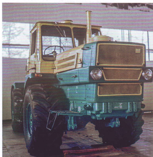
Новенький Т-150К перед отправкой с завода.

Предназначенный для трелевочно-транспортных работ тягач Т-157 имеет специальное технологическое оборудование: лебедку, арку, челюстной захват для пачки деревьев или хлыстов, щит, толкатель и защитное ограждение. Для его установки в Т-150К внесены следующие изменения: применена безресорная подвеска переднего моста, снижены передаточные числа на первой и второй передачах; увеличены дорожный просвет и колея; установлены шины большего диаметра и большей грузоподъемности; усилены