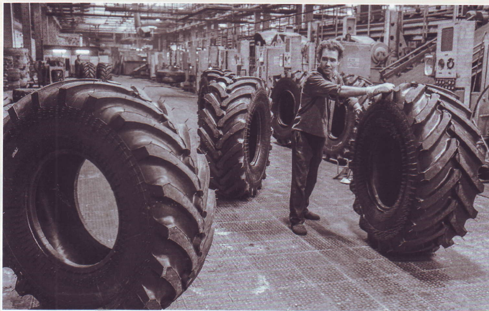
Шины повышенной ходимости для тракторов Т-150К в Нижнекамске. 1977 г.