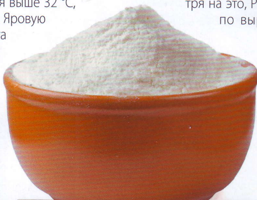
В основе классификации муки по сортам – показатель, сколько порошка получается из 100 кг того или иного зерна. Чем выше процент выхода, тем ниже сорт продукта.

рискованного земледелия), конъюнктурой мирового зернового рынка и длительным, в 5–7 месяцев, стойловым содержанием скота. Однако в XXI веке Россия стала экспортером пшеницы. Причем быстро заняла лидирующие позиции на мировом рынке. А в 2016 году даже вышла на первое место (25 млн тонн), обогнав США (24 млн), Канаду и Австралию (по 20 млн).