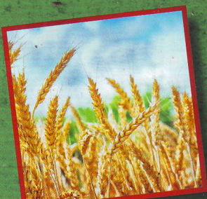
Пшеница: королева зерновых