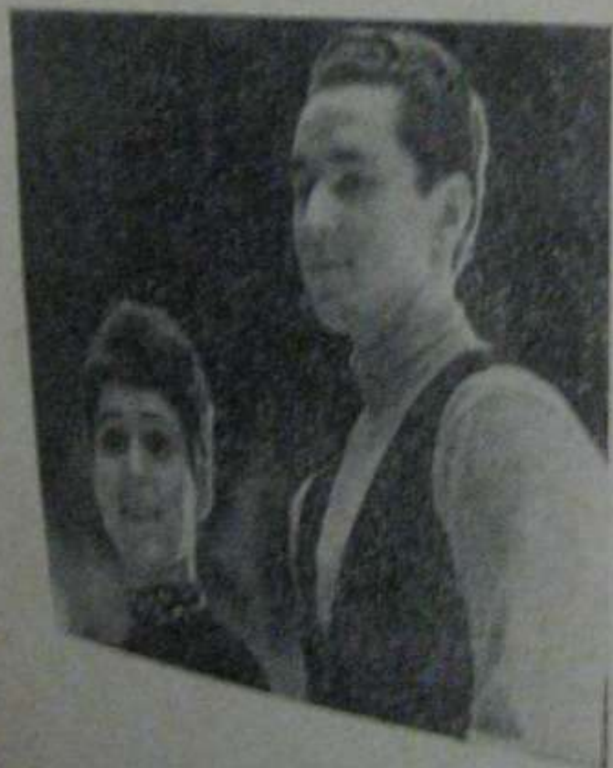
ИРИНА РОДНИНА И АЛЕКСЕЙ УЛАНОВ

Двукратные чемпионы мира и Европы в спортивных танцах на льду окружены в «десятке лучших» представителей олимпийских видов спорта. Но их появление здесь не случайно: спортивные танцы на льду давно пробивают себе дорогу на олимпийскую арену, а советские танцоры идут сейчас впереди всех. Им, конечно, очень трудно, но настоящий успех когда-нибудь придет легко!