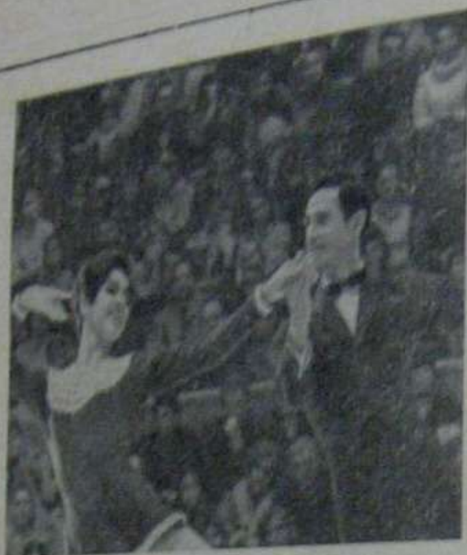
ЛЮДМИЛА ПАХОМОВА И АЛЕКСАНДР ГОРШКОВ

Двукратные чемпионы мира и Европы в спортивных танцах на льду окружены в «десятке лучших» представителей олимпийских видов спорта. Но их появление здесь не случайно: спортивные танцы на льду давно пробивают себе дорогу на олимпийскую арену, а советские танцоры идут сейчас впереди всех. Им, конечно, очень трудно, но настоящий успех когда-нибудь придет легко!