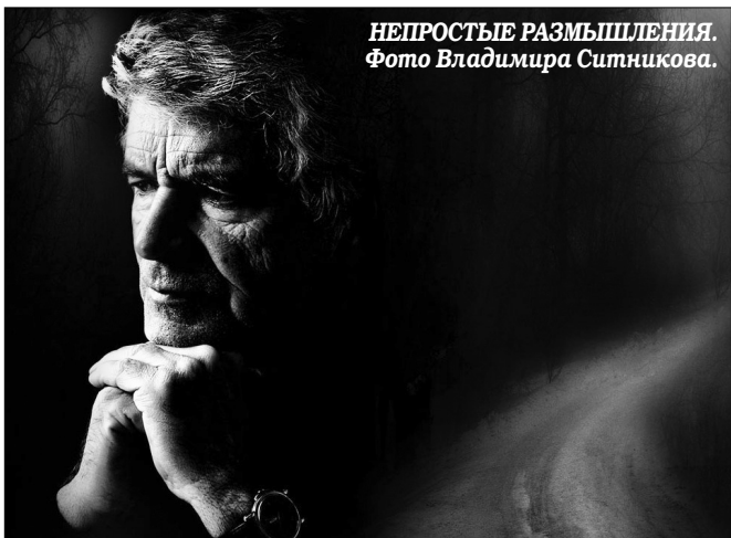
НЕПРОСТЫЕ РАЗМЫШЛЕНИЯ.

Потратили все эти деньги, кошелек выбросили. Потом пошли на исповедь, рассказали, мол, так и так, согрешил воровством (не особо распространяясь, что, собственно, произошло). «Бог тебя простит и разрешит» , – говорит священник. И теперь вы с чистой совестью, потраченными чужими деньгами дальше иде-