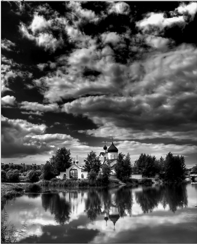
Островок веры.