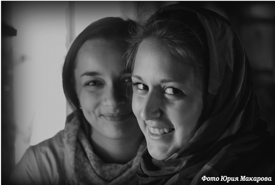
Фото Юрия Макарова

«Нескучный сад» Подзаголовок «Православной газеты» Фото протоиерея Алексия Уминского сделано диаконом Андреем РАДКЕВИЧЕМ.