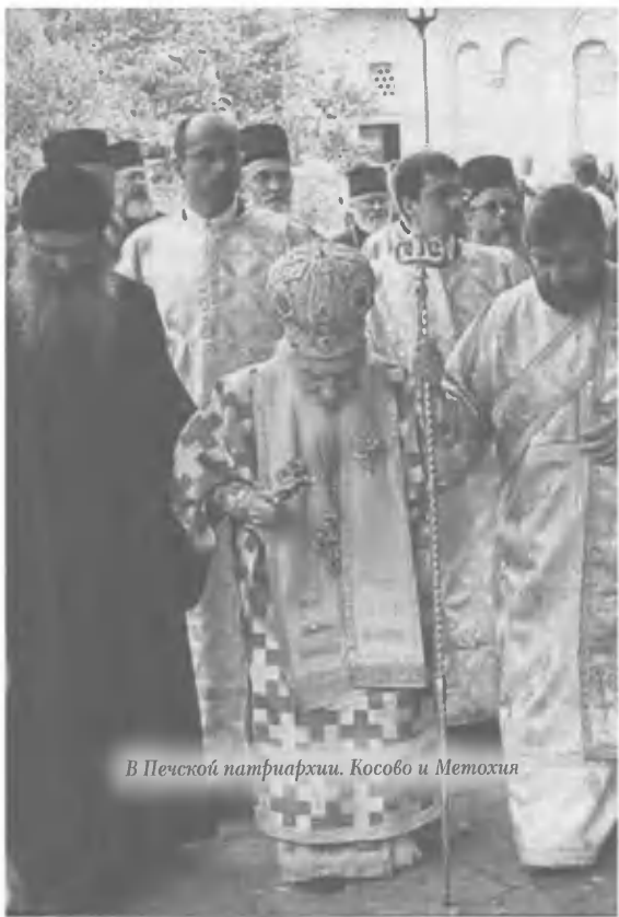
В Печской патриархии. Косово и Метохия