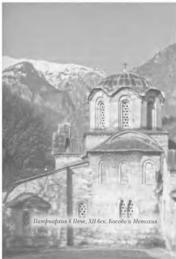
Патриархия в Пече, XII век. Косово и Метохия