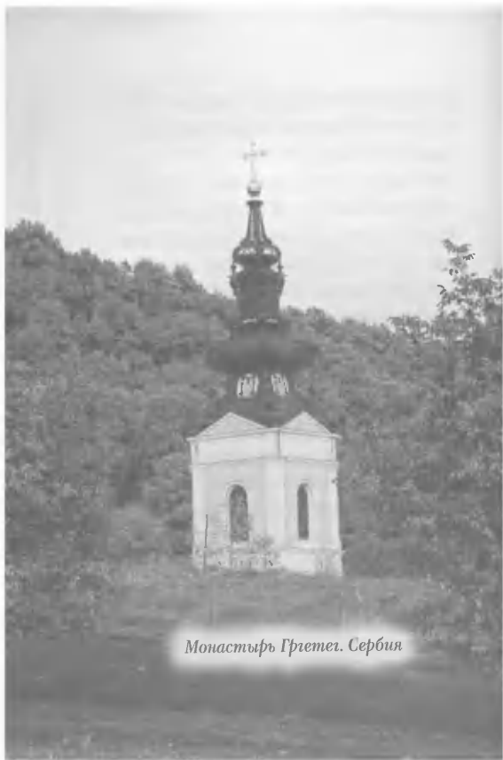
Манастир Гргетег. Србија