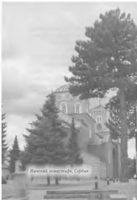
Жички манастир, Србија