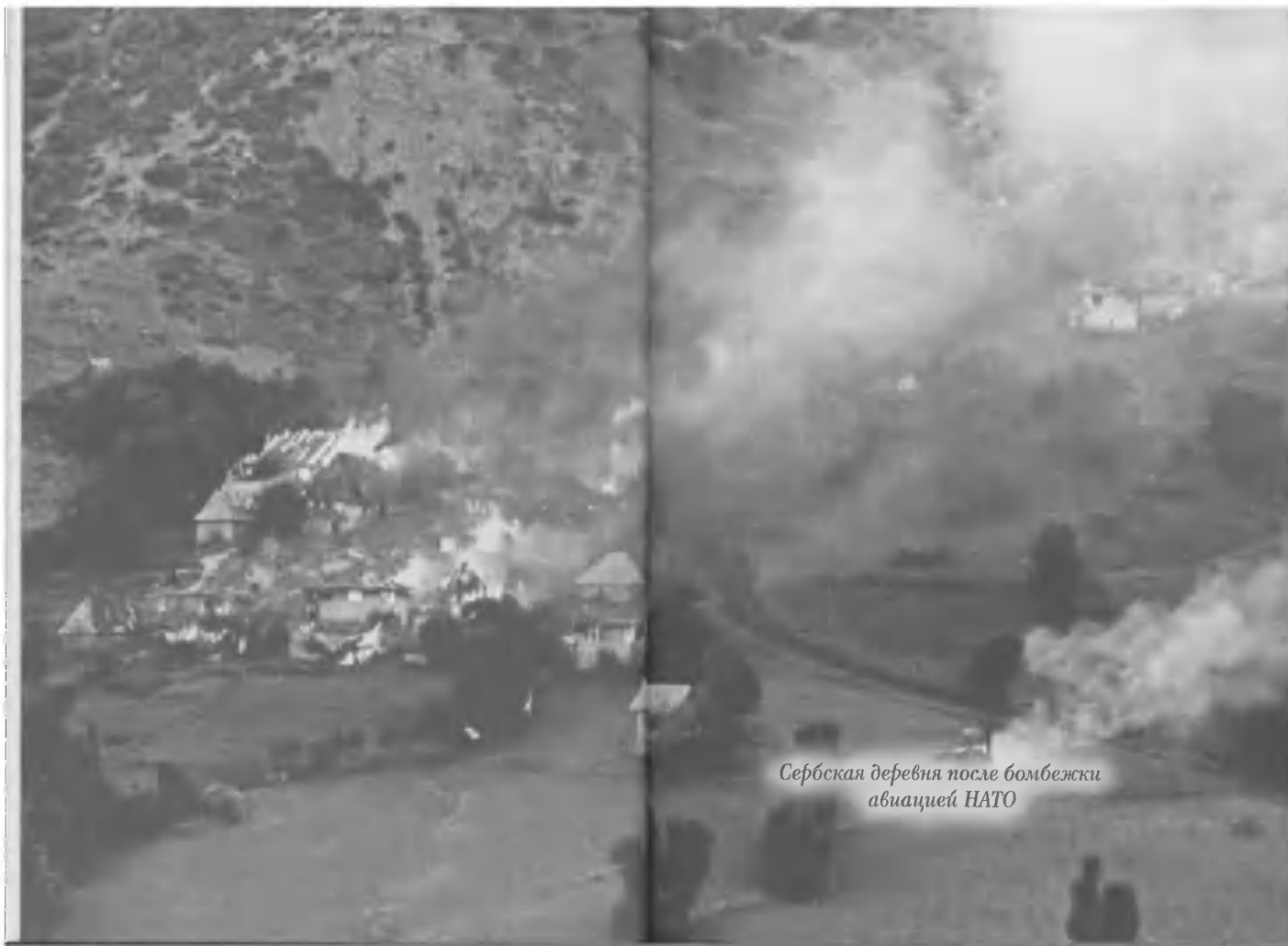
Сербская деревня после бомбежки авиацией НАТО