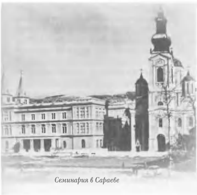
Семинария в Сараеве