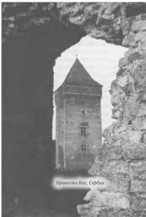
Крепостъ Бач, Сербия