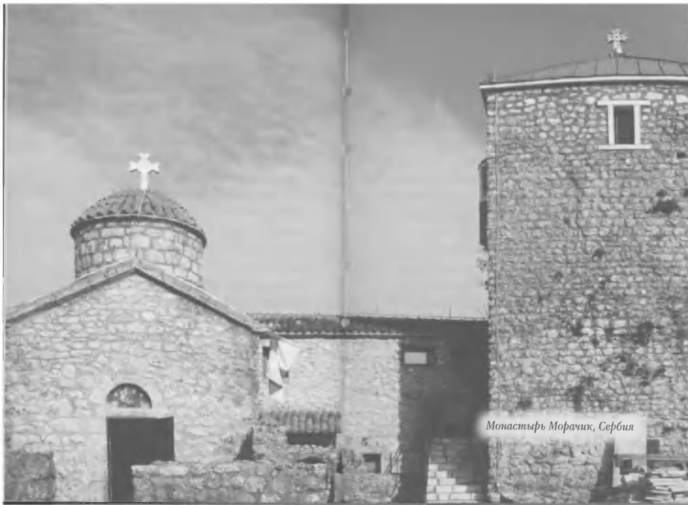
Монастырь Морачик, Сербия