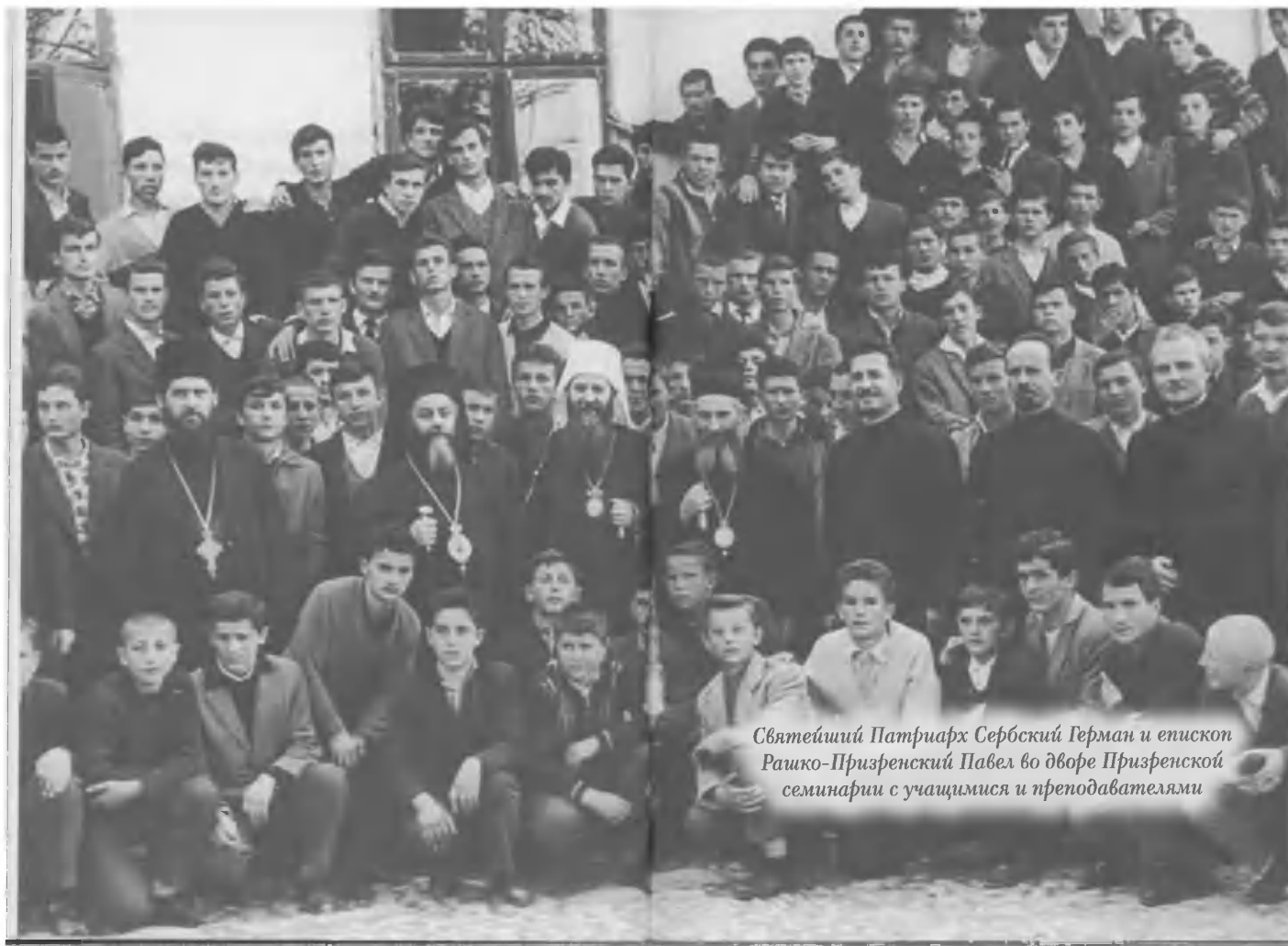
Святейший Патриарх Сербский Герман и епископ Рашико-Призренский Павел во дворе Призренской семинарии с учащимися и преподавателями