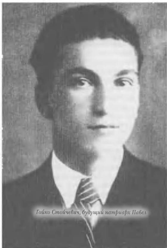
Го́йко Стой́чевич, будущий патриарх Павел