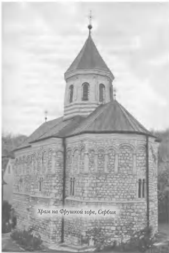
Храм на Фрушкој горе, Србија