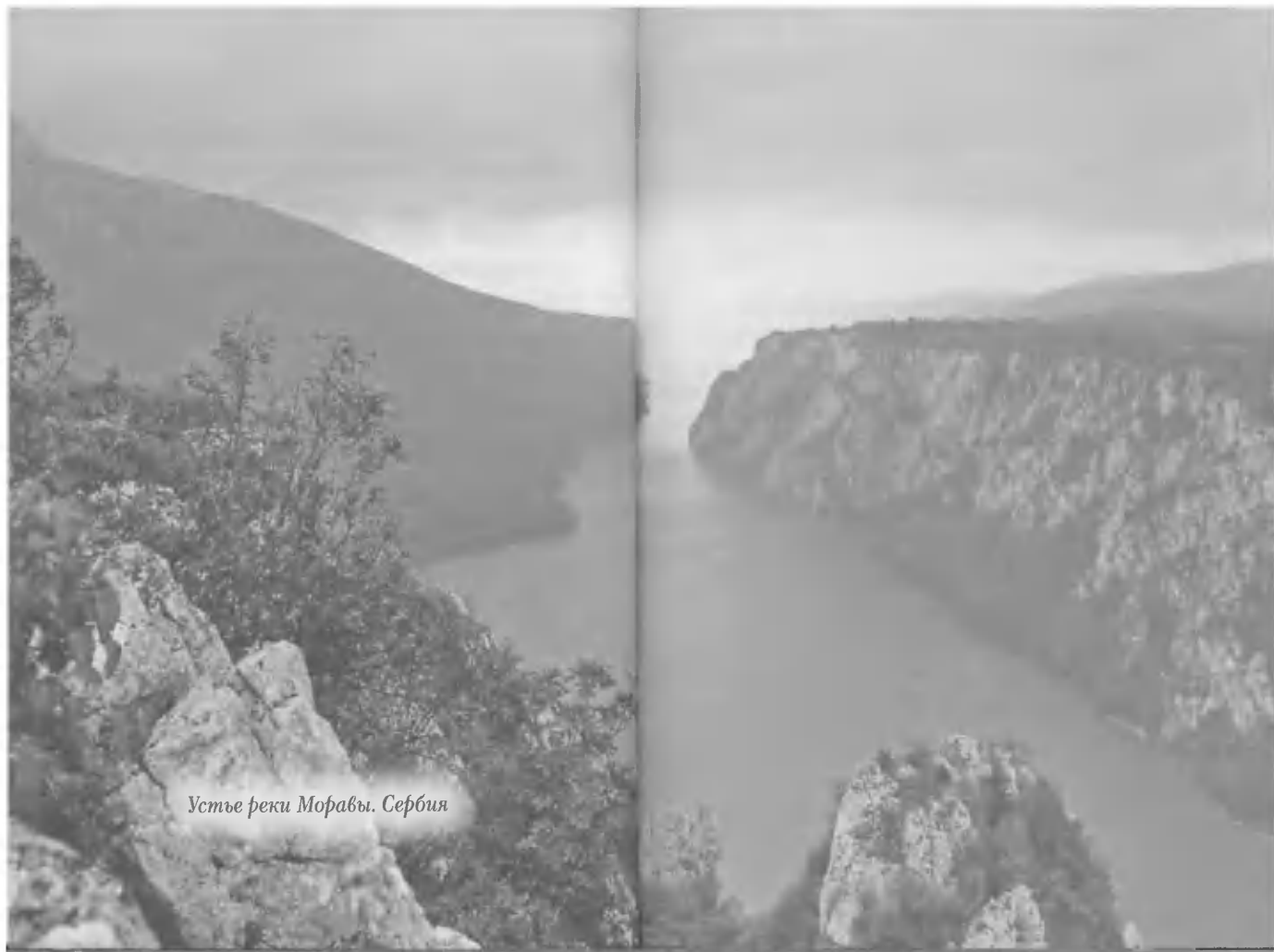
Устје реки Моравы. Србија