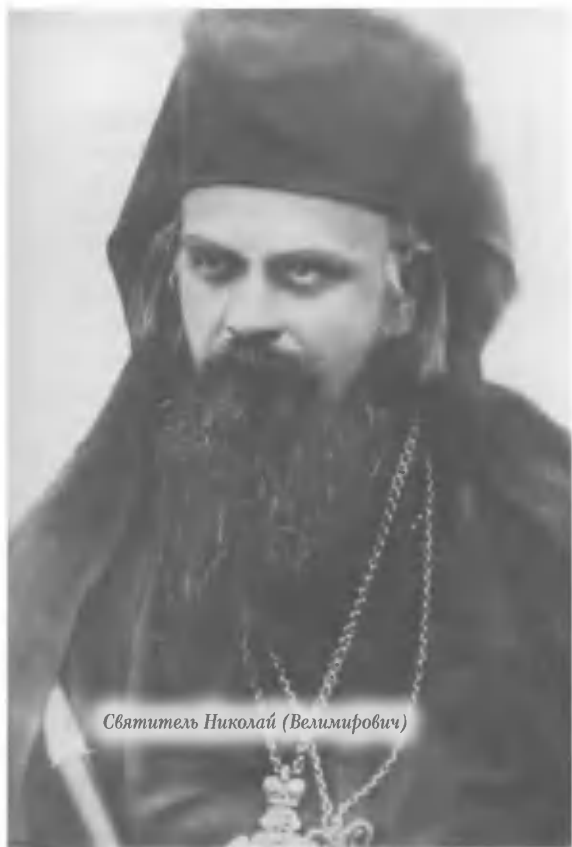
Святитель Николай (Велимирович)