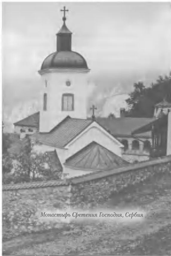
Монастырь Сретения Господня, Сербия