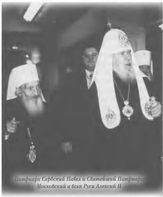
Патриарх Сербский Павел и Святейший Патриарх Московский и всея Руси Алексий II