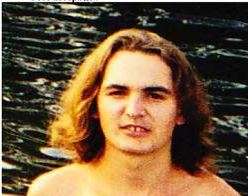
Фото автора в момент творчества: